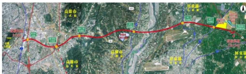
高屏第二快速公路路線全圖