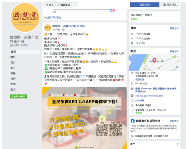
圖一、本府衛生局粉絲專頁宣導圖文。