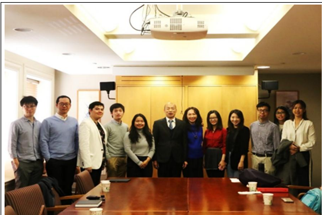
照片 2：韓國瑜市長與美國史丹佛大學學生座談交流