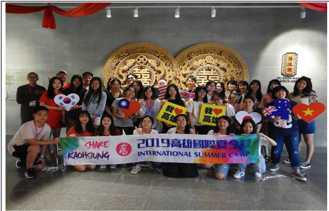
照片 10：辦理「2019 炫高雄—高雄國際夏令營」，共有台灣、美國、日本、韓國、越南等 31 位國內外學生熱情參與