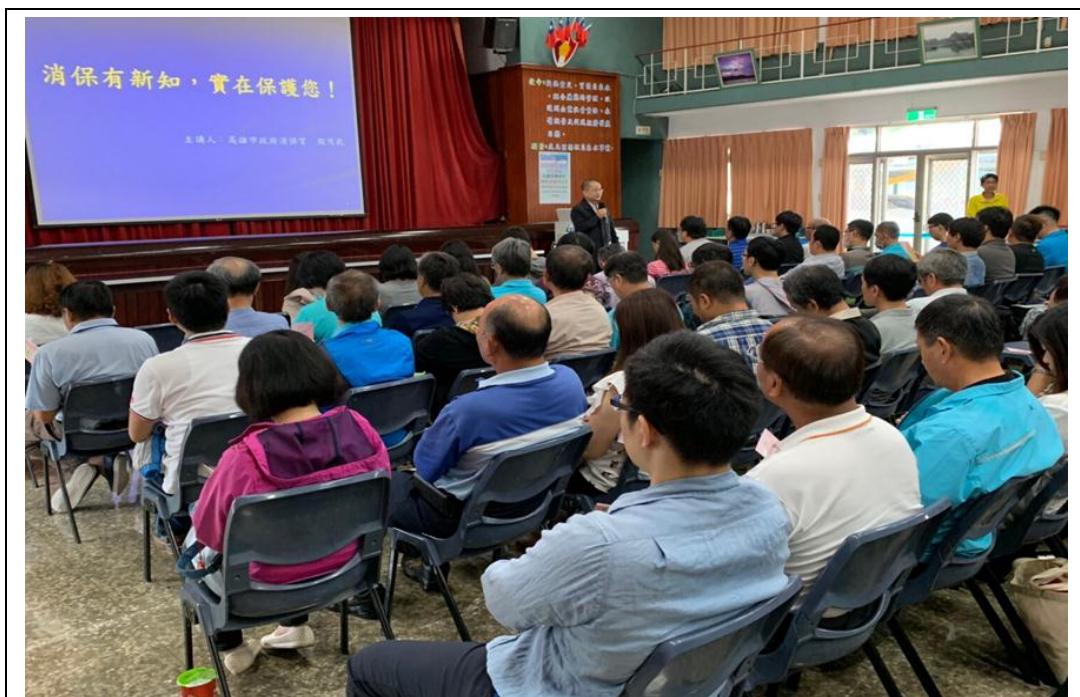
照片 23：至本府各機關學校進行消費者保護權益教育宣導，提升同仁消保意識