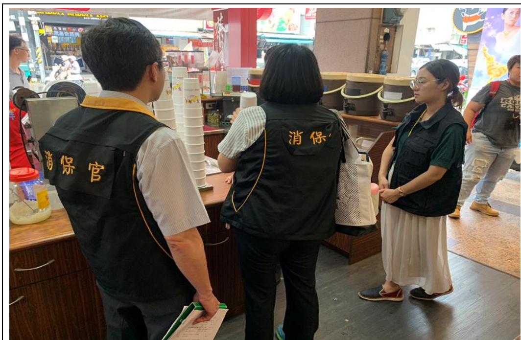
照片 22：會同本府衛生局稽查夏季冷飲冰品店，確保食安健康