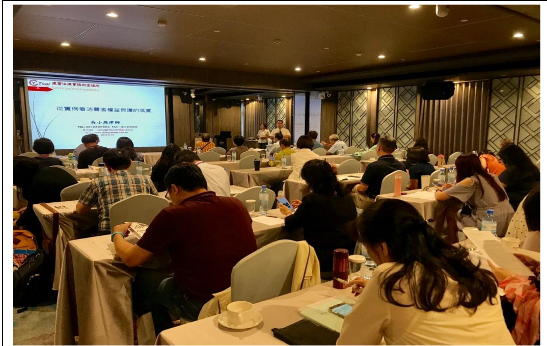
照片 25：辦理「全國消費者保護官第 69 次聯繫會報」，會報中進行各項消保業務檢討及議題討論