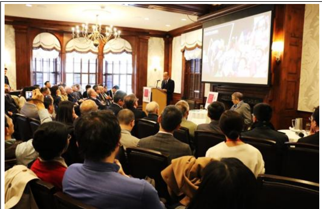
照片 1：韓國瑜市長於美國哈佛大學費正清研究中心發表演說

108 年 7 月 25 日，日本長野縣松本市菅谷昭市長拜會本府，與葉匡時副市長就長照政策、社會福利、兩市觀光等議題交流討論。