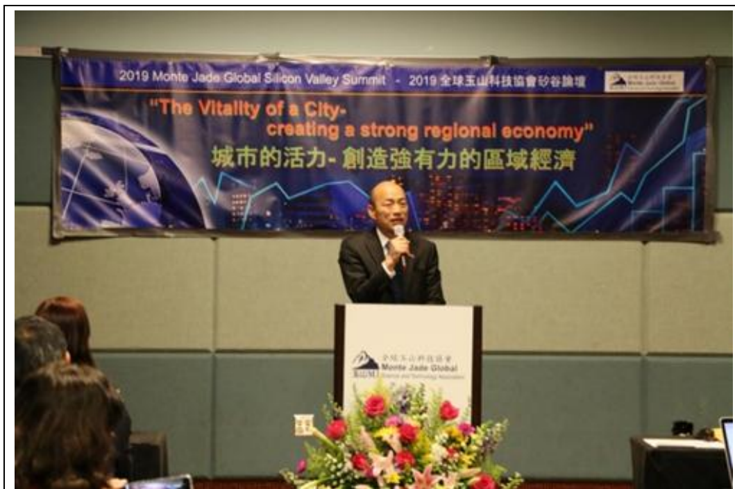
照片 4：韓國瑜市長於「全球玉山科技協會矽谷論壇」圓桌經濟座談致詞