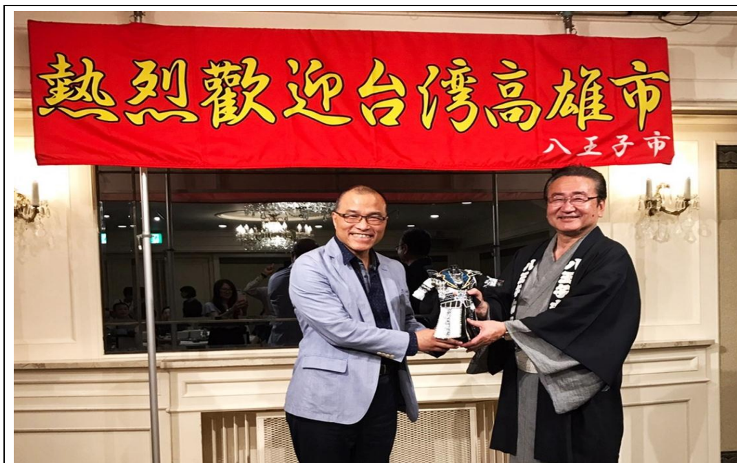
照片 8：日本八王子市石森孝志市長歡迎葉匡時副市長及市府訪團