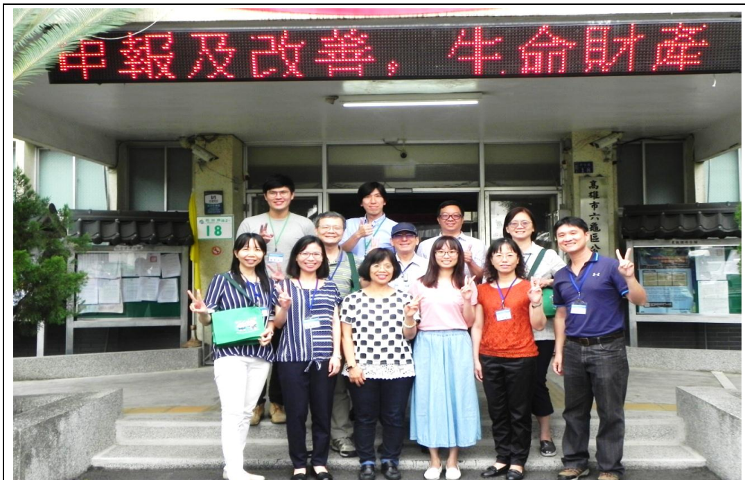
照片 16：108 年度於本市六龜區公所進行檔案管理考核

定期舉行市政會議，議定市政重要決策，並落實本府各機關橫向聯繫及加強各局處與區公所間統合協調作用，發揮整體合作精神，以提升行政績效。市政會議由本處負責彙整議程及紀錄，並函請各權責機關確實辦理，由市府研考會列管追蹤，本期共計召開 26 次市政會議。