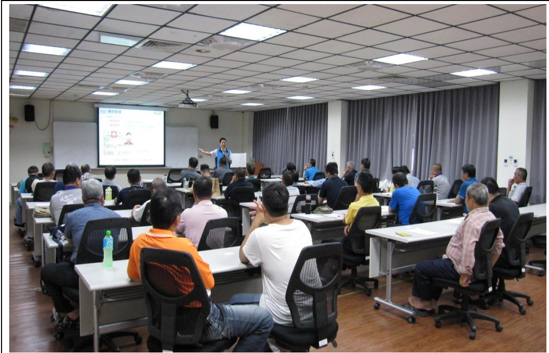
照片 20：「交通法令與安全駕駛研習班」授課實況