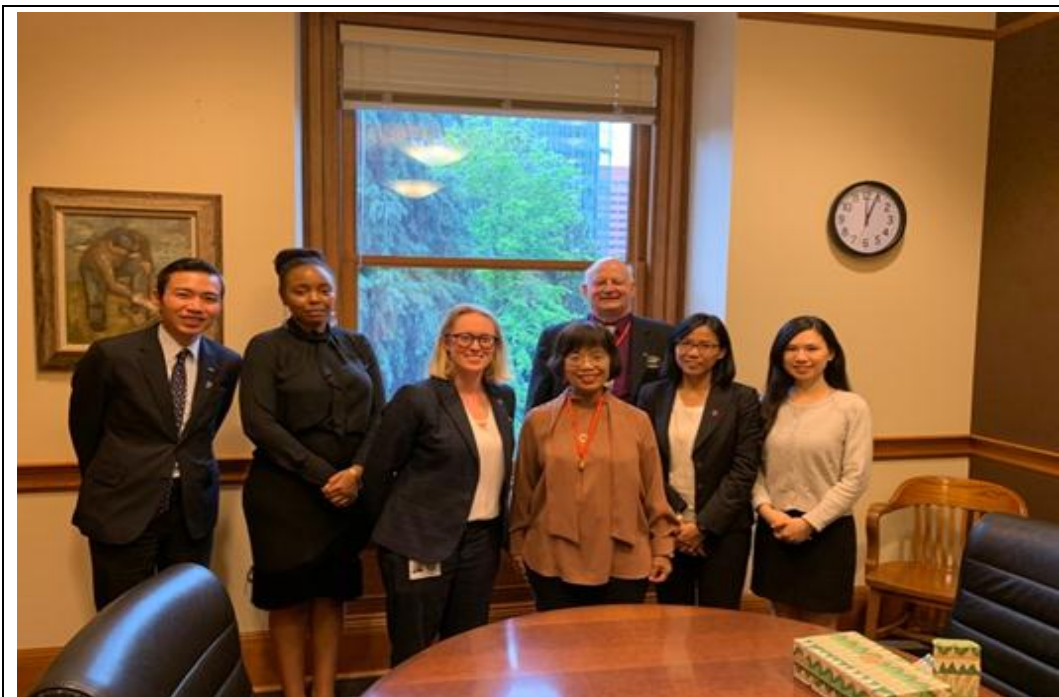
照片 5：本府訪團拜會波特蘭市政府，就增進雙方交流之方式交換意見