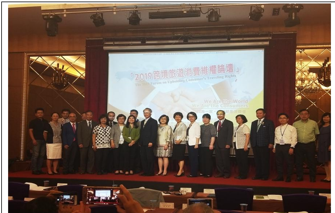
照片 26：協助台灣消費者保護協會辦理「跨境旅遊消費維權論壇」，探討各項跨境旅遊消費議題