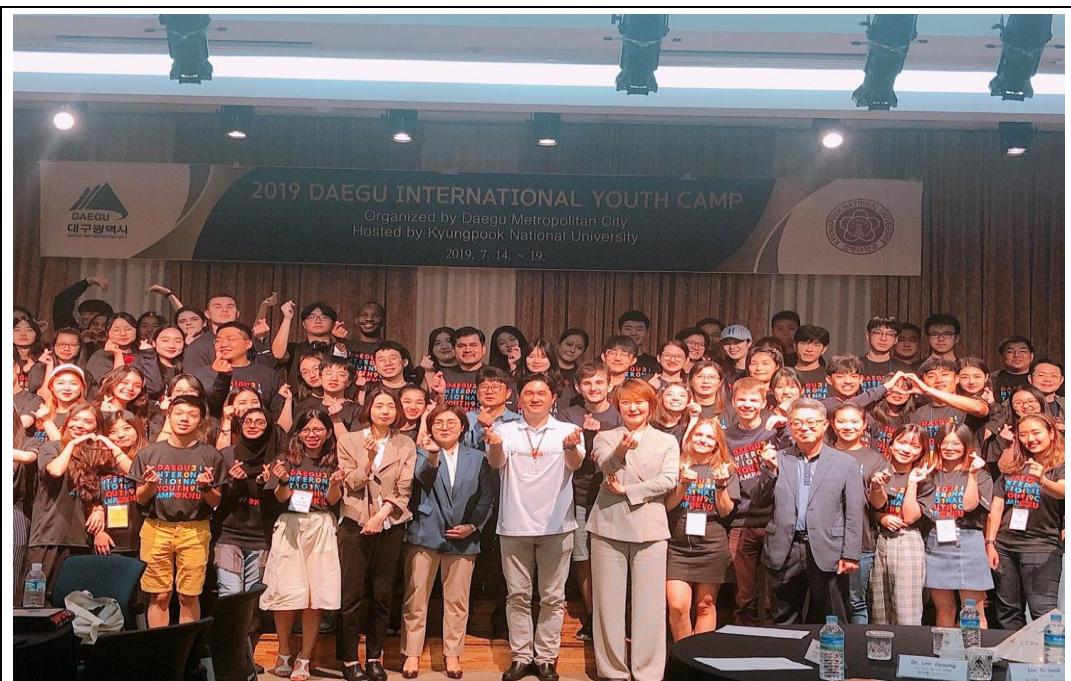
照片 7：由本處率 5 名高雄大學生前往韓國大邱友好城市參與「2019 韓國大邱國際學生夏令營」