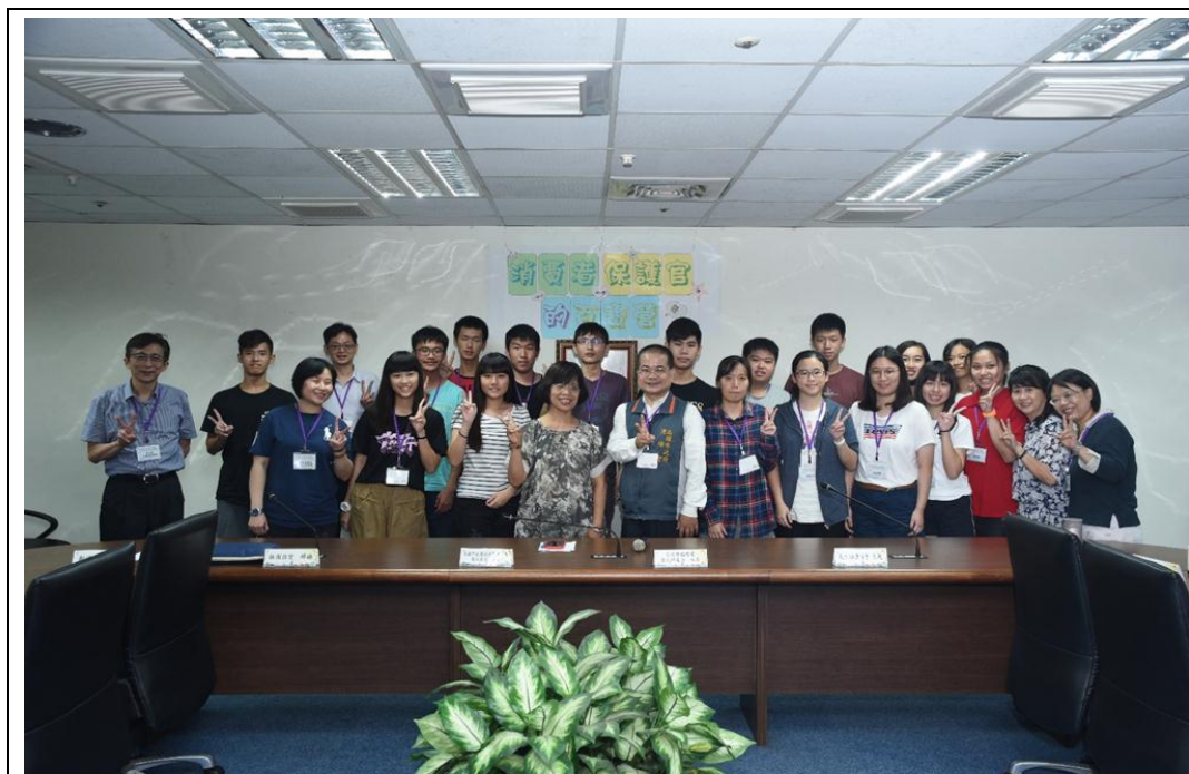
照片 24：辦理「108 年消費者保護官的百寶營」，設計課程、參觀、宣導及外場體驗等內容，習得自我保護的正確觀念