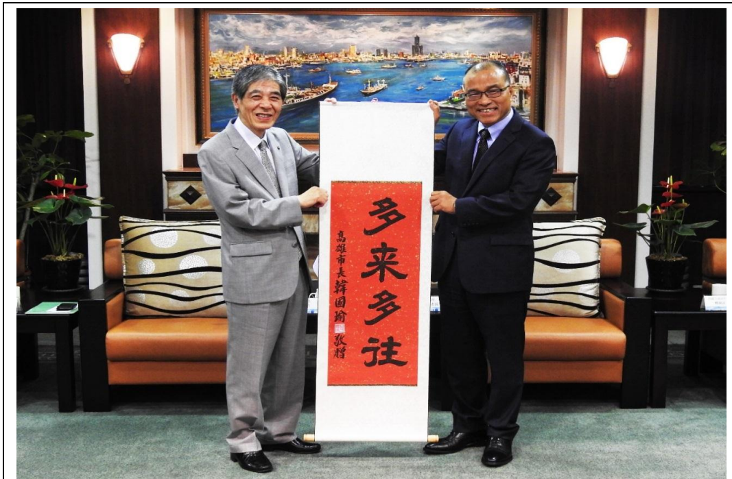
照片 15：日本長野縣松本市菅谷昭市長拜會本府葉匡時副市長