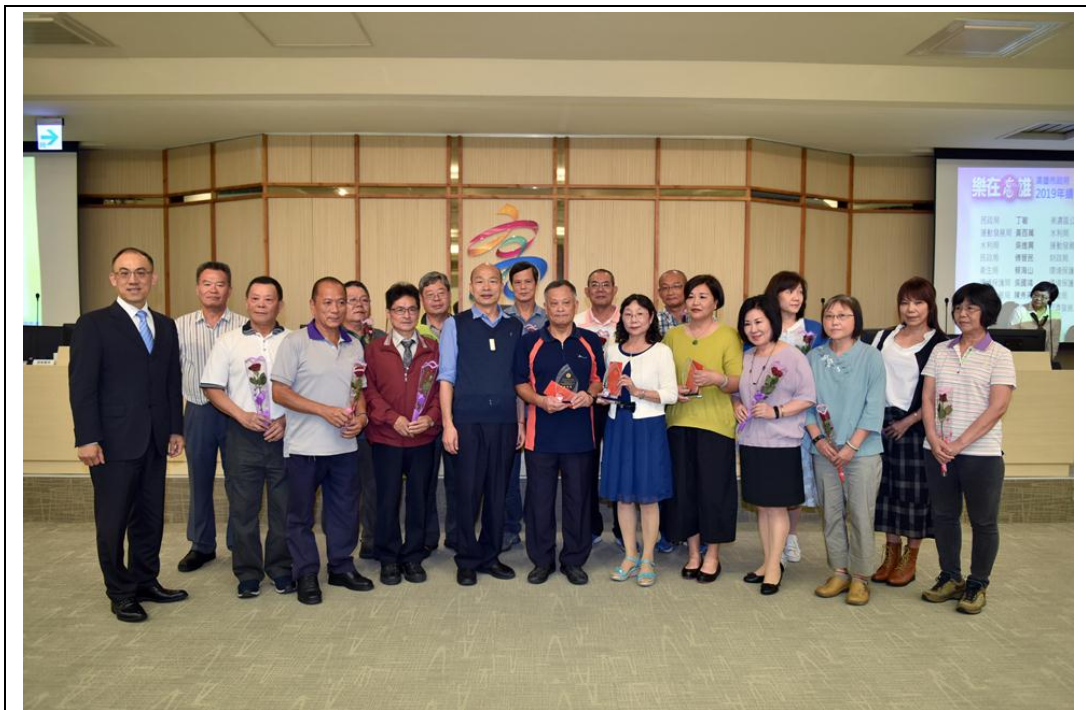
照片 17：韓國瑜市長親自頒獎鼓勵辛勤奉獻的績優基層人員

為展現本府肯定與支持第一線維護社會治安及救災的設備需求，爰將 109 年車輛設備下授經費 7,746.4 萬元扣除核予新成立機關青年局 2 輛新租費用 28 萬元外，餘數 7718.4 萬元全核供警消汰換逾齡特種車輛。