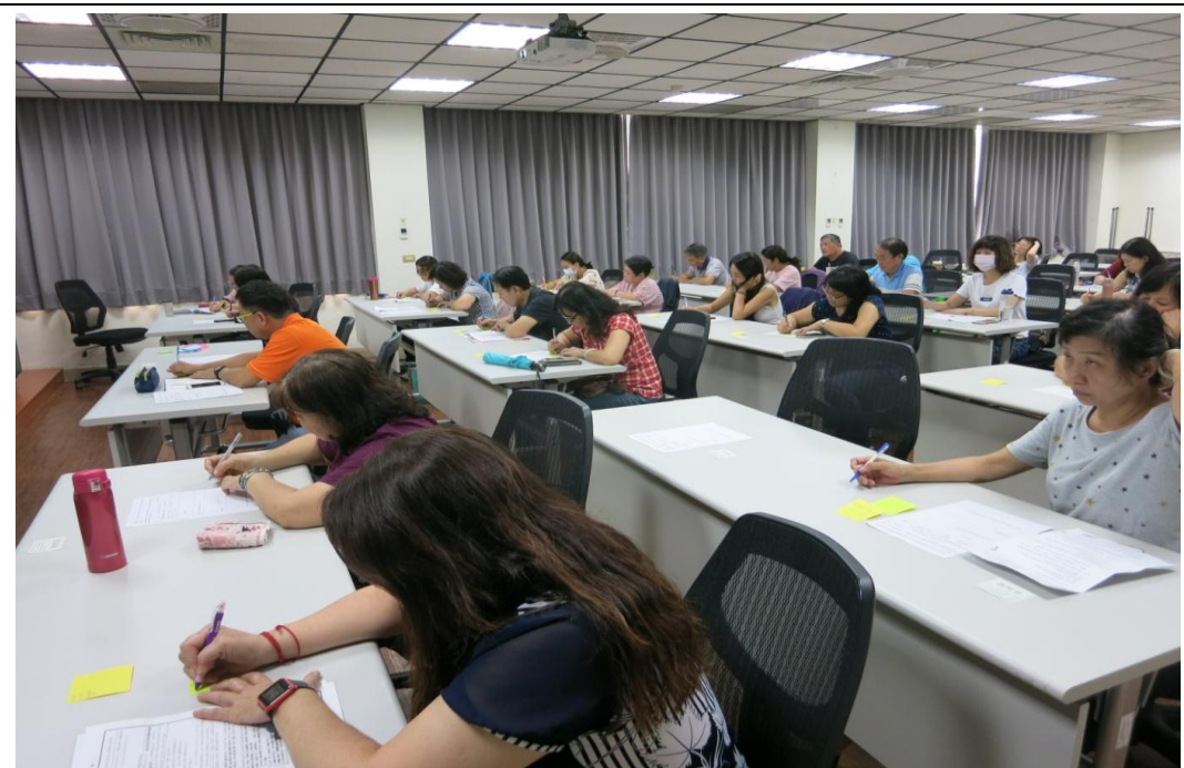
照片 19：「工作的神聖性—創造自己的無限可能」研習班授課實況