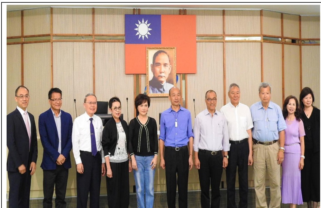
照片 9：韓國瑜市長召開國際關係小組會議，邀集產學界專家學者集思廣益、提供城市外交政策建言