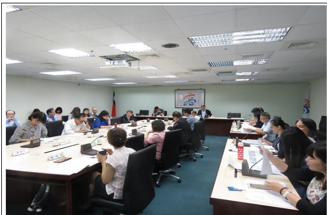
照片 21：召開 108 年度第 1 次消費者保護委員會議，議決各項消保政策，加強消費者保護