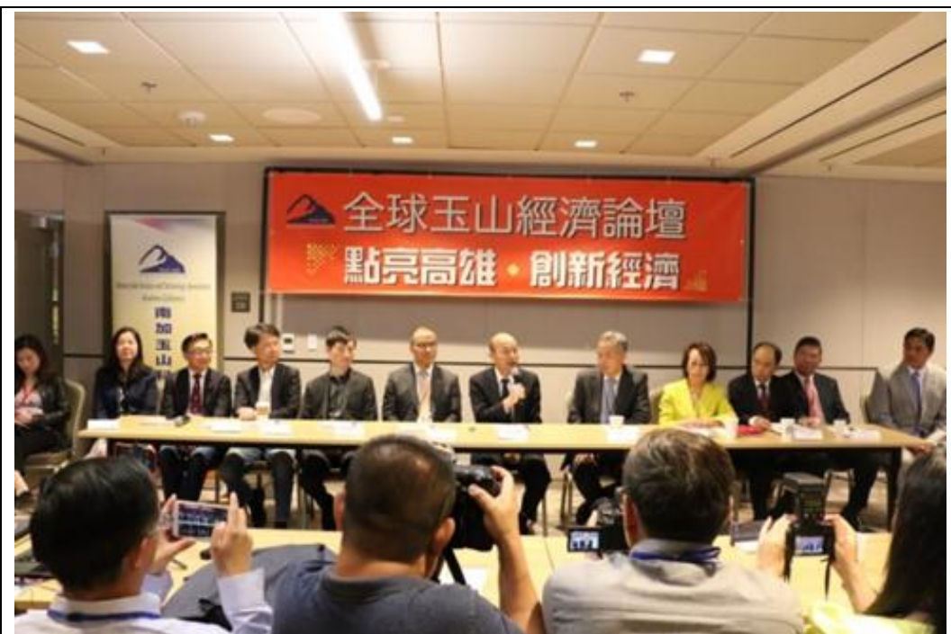
照片 3：韓國瑜市長出席「全球玉山經濟論壇『點亮高雄，創新經濟』」圓桌招商座談會