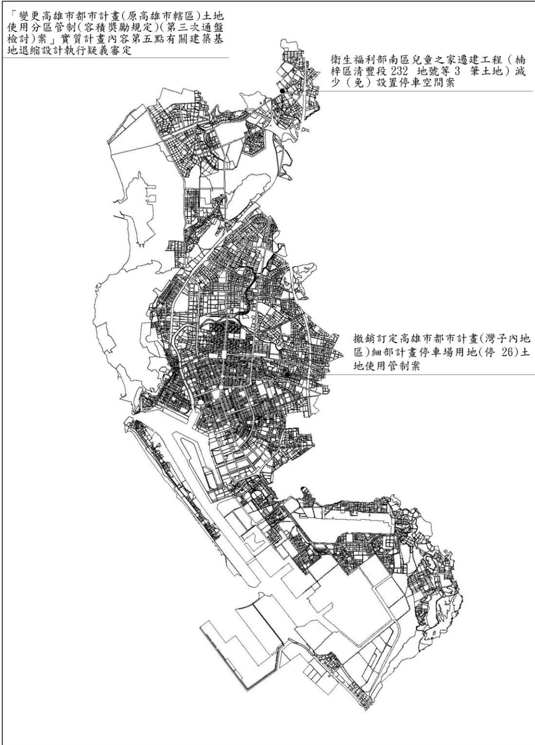
附圖一 近期審議案件位置示意圖