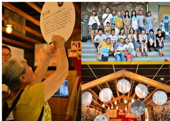
五一八國際博物館日「我們的女工時代」活動