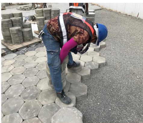
協助藥癮者就業服務