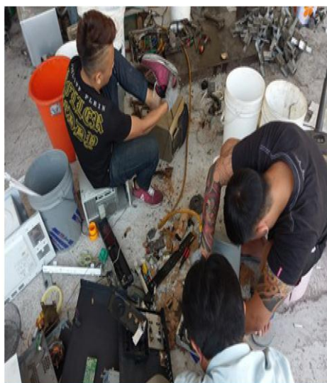
協助高風險高關懷弱勢青少年就業