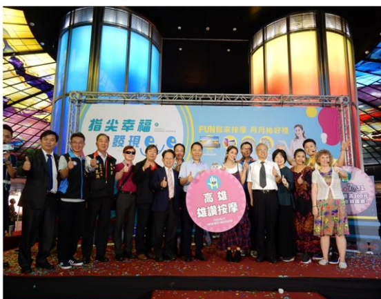
積極行銷視障按摩產業-「指尖幸福發現eye」莎莎代言站台視障按摩