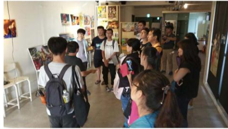
108年青年職涯輔導暨創業育成計畫成果