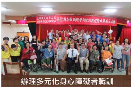
辦理多元化身心障礙者職訓