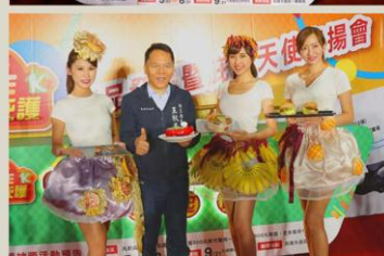
促進庇護商品新露頭角