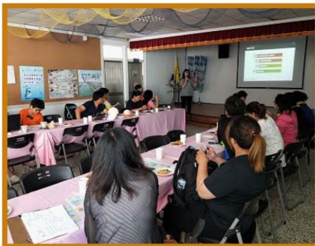
參訪多元就業方案卓越單位