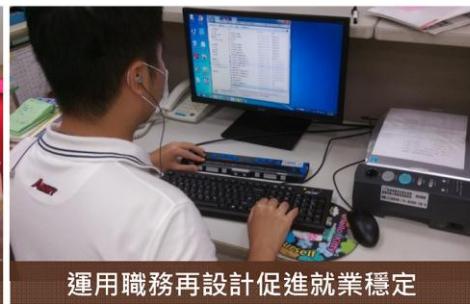
運用職務再設計促進就業穩定