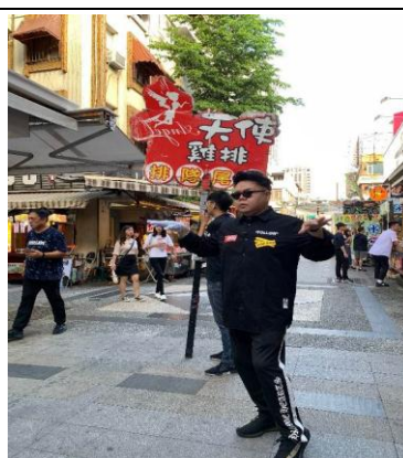
名人帶路－港星易智遠推薦新崛江美食