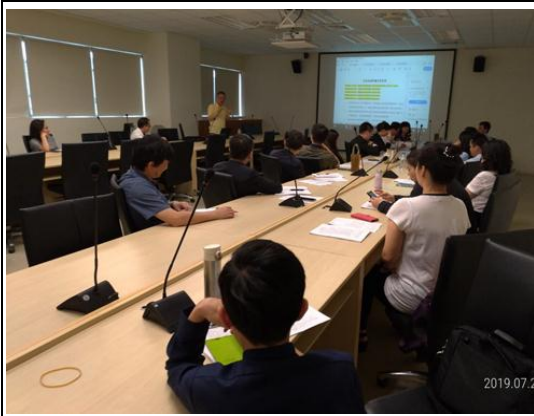
輔導本市旅館業者參加星級評鑑