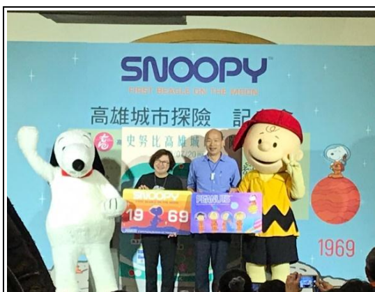
觀光代言人－Snoopy行銷高雄觀光活動

設計郵輪旅客專屬摺頁及遊程，完成灣靠郵輪遊客專屬遊程摺頁，並新增本市新興景點（棧貳庫、哈瑪星光任務、崗山之眼等）資訊，介紹4條灣靠遊客6-8小時之特色行程；另針對Fly-Cruise方式乘坐飛機來高搭乘郵輪旅客，設計不同主題，分別提供當日來回及二日遊的景點建議，讓旅客盡情探索高雄風光。