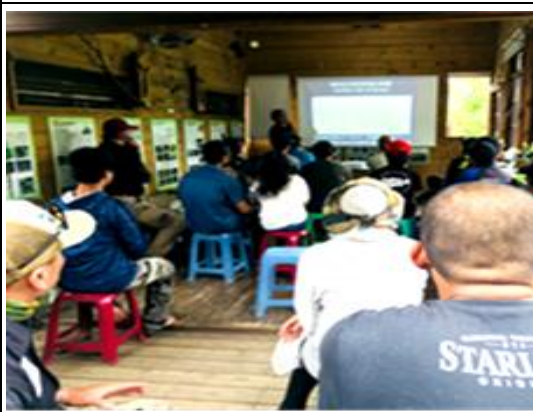
鳥松濕地導覽解說培訓