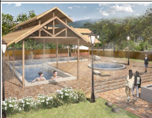
寶來花賞溫泉公園環境設施改善工程 （模擬圖）