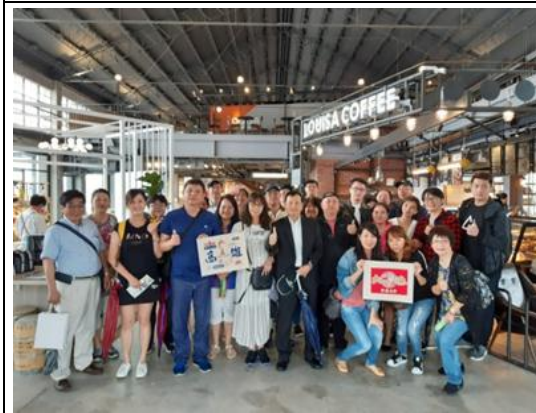
安排國內旅行業者採線