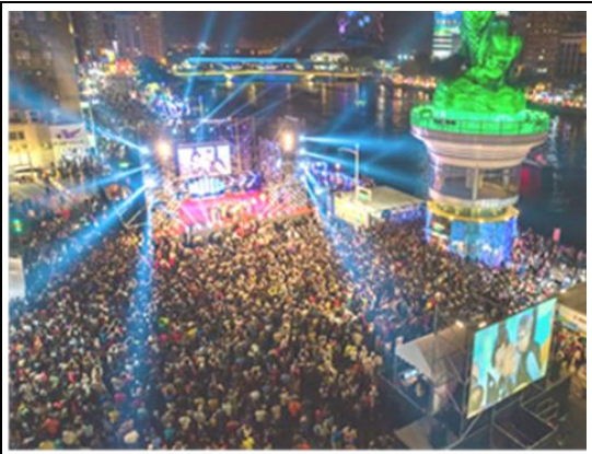
愛河燈會金銀河吸引眾多人潮