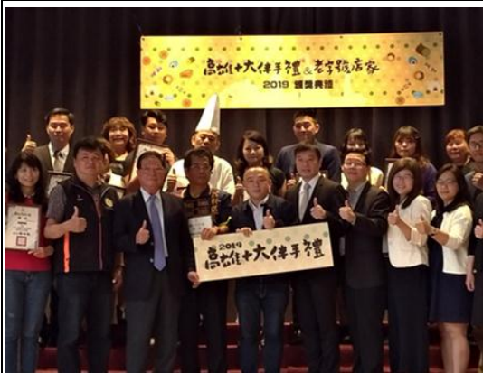
2019 高雄十大伴手禮選拔賽