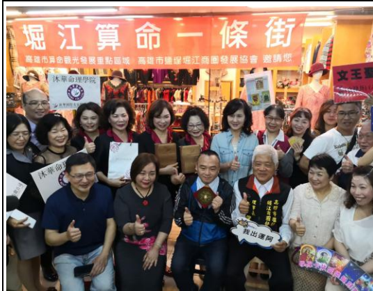
崛江算命一條街推廣活動