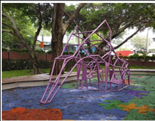
壽山風景區整建工程