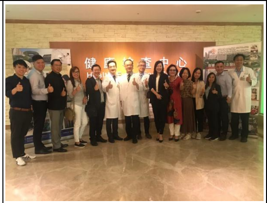
東南亞醫療觀光採線團