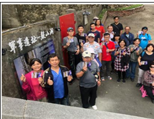
軍事遺址－鼓山洞開放遊客參觀