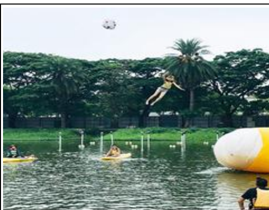
蓮池潭水上彈跳活動