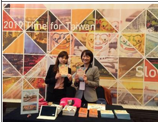
參加韓國觀光推廣活動