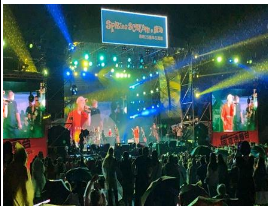
春吶 25 週年在高雄