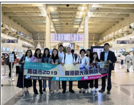
前往參加香港國際旅遊展