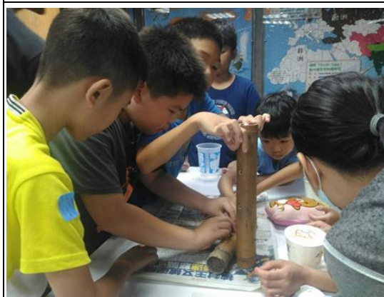
教育推廣體驗活動