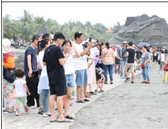
旗津黑沙玩藝節沙雕主題展