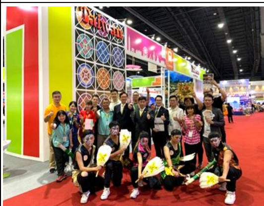
參加泰國秋季旅展