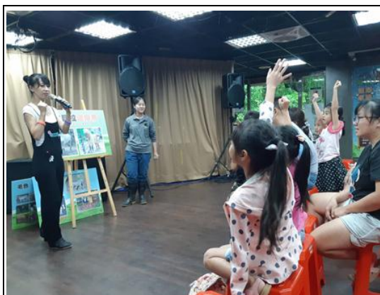
法拉貝拉馬主題月活動