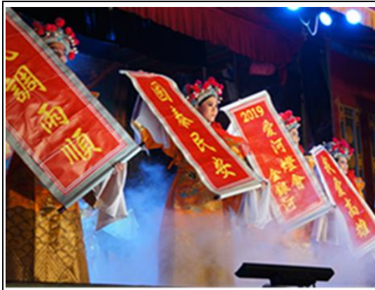
愛河燈會金銀河開幕