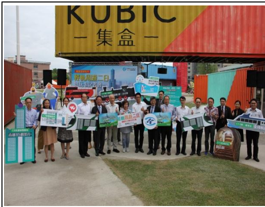
輕軌周遊 2 日遊好玩卡記者會