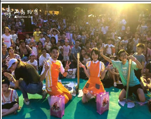
暑期夜間展演活動