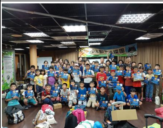
動物園夜宿營活動