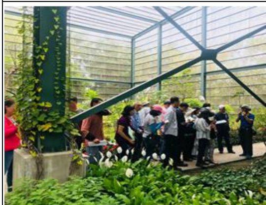
金獅湖蝴蝶園志工導覽解說