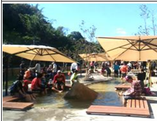
寶來花賞溫泉公園一足湯區