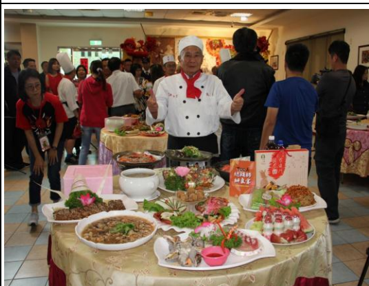
高雄內門宋江陣－總舖師辦桌宴