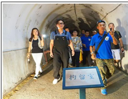
名人帶路探訪軍事遺址－鼓山洞