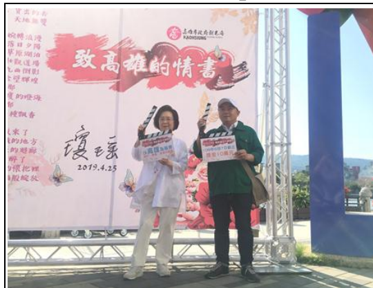
瓊瑤小說月－愛情教主瓊瑤給高雄的一封信

2.評估報告書已於 108 年 4 月 19 日送交市議會，觀光局及運動發展局亦於 108 年 5 月 25 日、26 日協助高雄市體育會馬術委員會辦理「2019 高雄港都盃馬術錦標賽」，現階段將持續推動馬術活動產業。