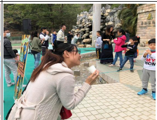
金剛鸚鵡－會飛的傳聲筒教育推廣活動