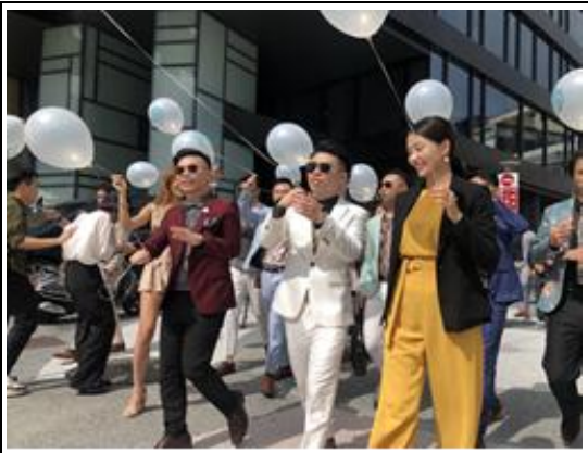
「紳士街頭配對」活動