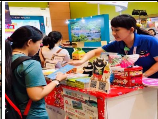
參加馬來西亞旅展向民眾介紹高雄