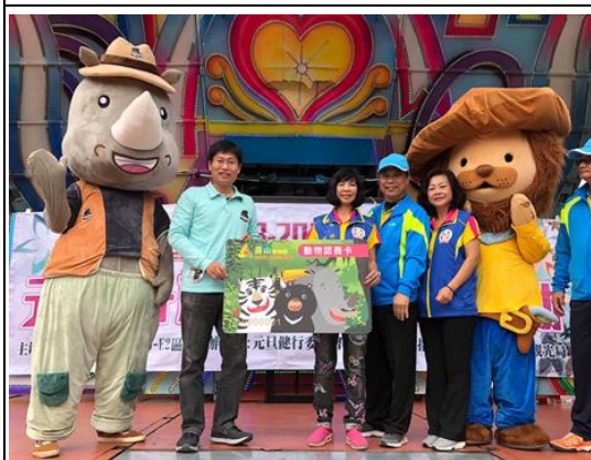
元旦澄清湖動物認養活動