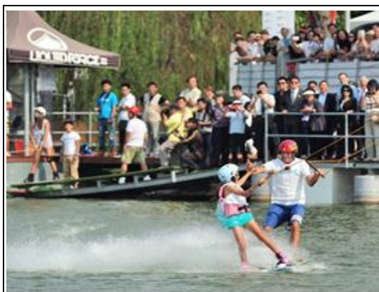
蓮池潭纜繩滑水活動