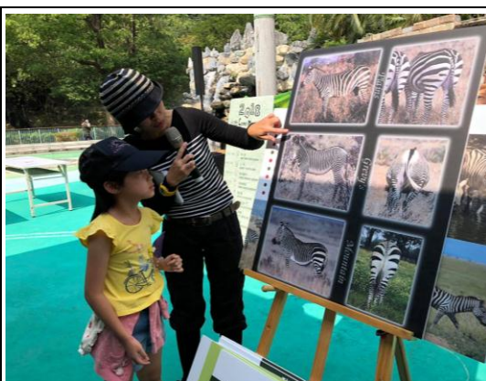
查普曼斑馬主題月活動