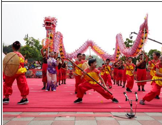
高雄內門宋江陣－創意宋江陣頭大賽