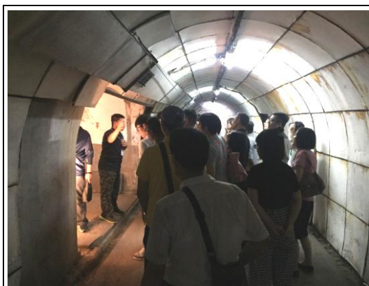
大陸媒體團參訪鼓山河軍事遺址