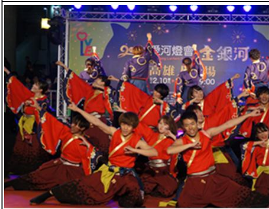
愛河燈會金銀河宋江陣精湛演出