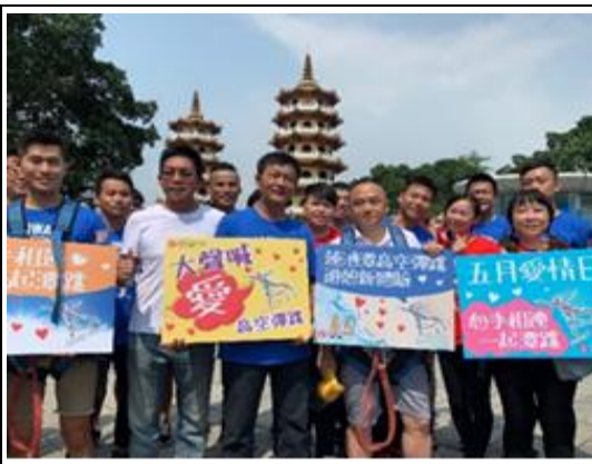
大聲喊愛高空彈跳