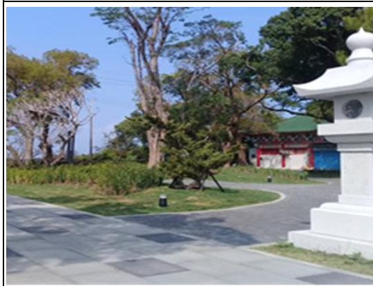
壽山情人觀景台周邊人文空間再造工程