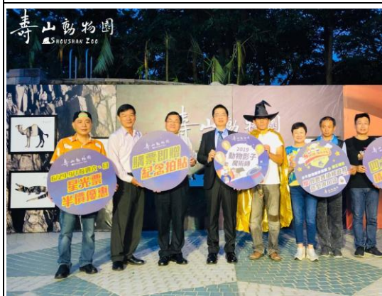
暑期夜間遊園開幕