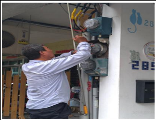
取締非法旅宿執行斷水斷電