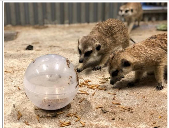
壽山動物園全新動物明星－狐獴