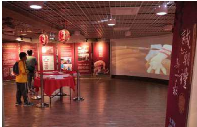
[圖 15] 誠心朝禮—新丁粄特展

3.107 年 8 月 26 日起在美濃客家文物館圓形劇場舉辦「誠心朝禮—新丁粄特展」，展示工藝製作過程、祭典祭儀之應用、播放紀錄片等，至 108 年 7 月底止吸引約 5 萬 8,000 人次參觀。（如圖 15）