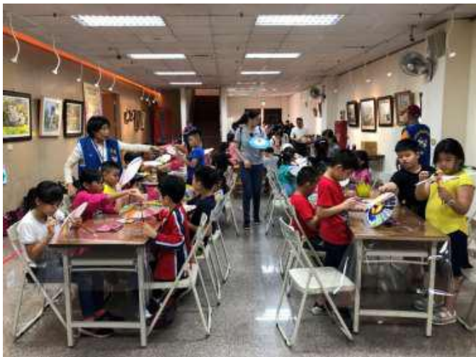
[圖 23] 彩繪客家紙傘