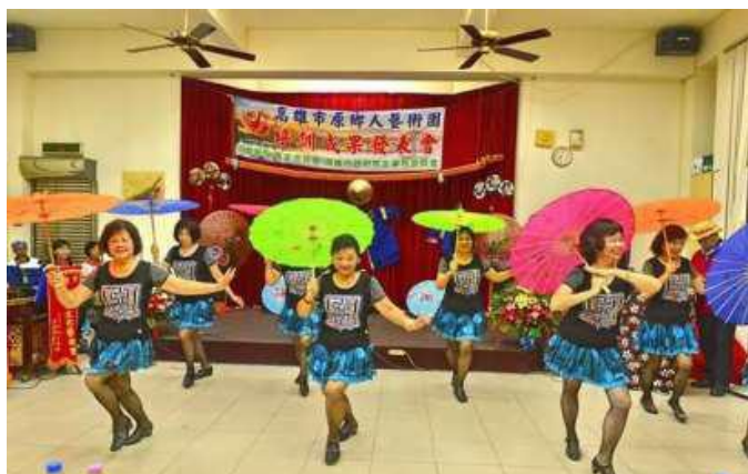
[圖 16] 社團成果發表會

108 年 1 月至 7 月計輔導 55 個客家社團，開辦客家歌謠、舞蹈及技藝班等培訓課程與客家文化活動，參與鄉親計 2,254 人；社區及學校巡迴公演 1 場次，參與鄉親及民眾達 100 人次。另輔導 9 個社團辦理「傳統客家美食教學與推廣活動」、「2019 第二十二屆美濃黃蝶祭」、「2019 笠山文學營」、「108 年客家美食節暨慶讚中元神豬比賽客家文化推廣活動」及「臺灣首位客家進士黃驥雲研究推廣」研討會等，參與鄉親及民眾達 15,810 人次，公私齊力推廣客家事務。（如圖 16）