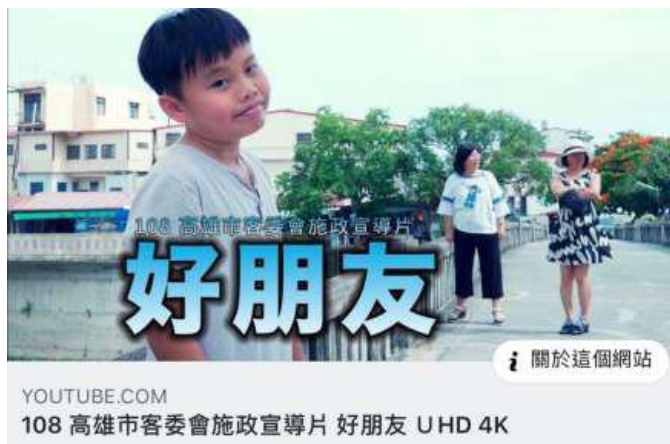
[圖 17] 客家市政宣導短片

為使民眾瞭解本會施政成果，108 年 7 月完成拍攝宣導短片「好朋友」，全片以客語發音，行銷美濃啖糕堂、文創中心搖籃咖啡、牛埔庄生活文化館等客家特色產業，並展現本會辦理客語沉浸教學、客家婚禮、客語保母及客庄生活營造等施政成果，藉由劇情影片網路行銷，擴大民眾參與，提升客家能見度。（如圖 17）