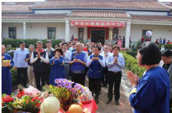
[圖 9] 韓市長率鄉親祭祀祈福