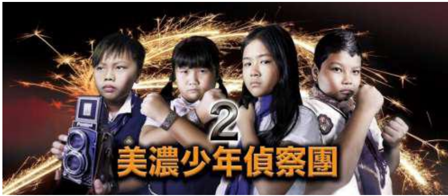
[圖 5] 美濃少年偵察團第 2 集劇照

邀請美濃國小客華雙語實驗班三、四年級學生拍攝 3 集短片，名為「美濃少年偵察團」，以孩童喜愛的推理、懸疑為主軸，並揉合詼諧、輕鬆的內容，透過影片傳達「講客語是件很酷的事」、「原來客家短片也可以這麼有趣」等印象，並營造「在美濃，我們可以用客語買東西」的社區群體意識。3 部影片分別於 107 年 6 月、8 月及 9 月播出，至 108 年 7 月底止，觸及率達 21 萬 399 人次、觀看次數 9 萬 9,853 人次、留言分享 6,147 人次，受到許多客家鄉親和民眾的鼓勵與肯定，成為客家文化推動的新指標。（如圖 5）