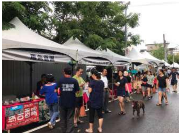
[圖 28] 好客市集

配合 108 年 1 月 1 日「浪漫客庄·富庶美濃」音樂會，及 7 月 27、28 日「田園音樂會」活動，於美濃文創中心及永安路辦理，集結美濃、杉林、六龜、甲仙和原住民特色商品與風味小吃，以及高雄品質優良的農特產品，吸引遊客採買。後續將配合客庄區各項節慶活動如「美濃白玉蘿蔔季」、「杉林瓜果節」、「六龜梅子節」、「甲仙芋筍節」展售特色商品，促進客庄經濟，落實「貨出去、人進來」政策理念。（如圖 28）