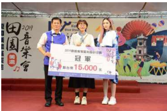
[圖 11] 創意藍衫競賽上衣組冠軍及作品

108年3月30日至6月3日徵求以藍衫為基礎元素進行創意設計，鼓勵民眾及各大專院校學生發揮創意報名參與，計有71件作品參賽。初選結果計上衣組9件、背心組8件、潮T組9件作品入圍，7月27日於「田園音樂會」活動中以走秀方式舉辦決賽及頒獎。（如圖11、12）