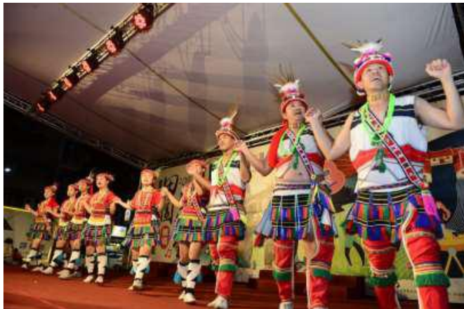
[圖 14] 高雄市原住民祖韻文化樂舞團演出