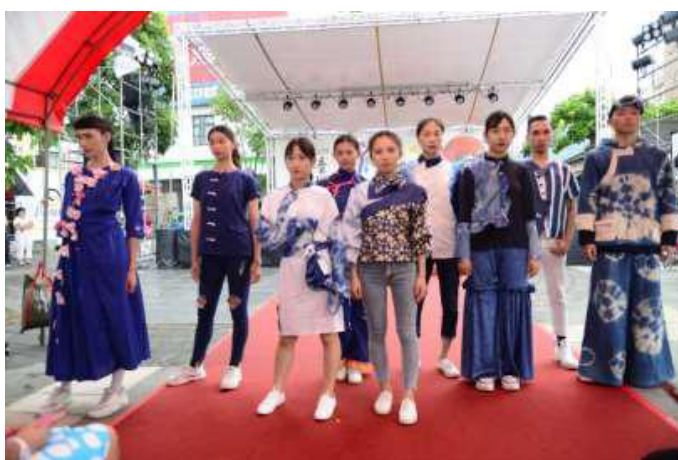
[圖 12] 創意藍衫競賽上衣組決賽走秀