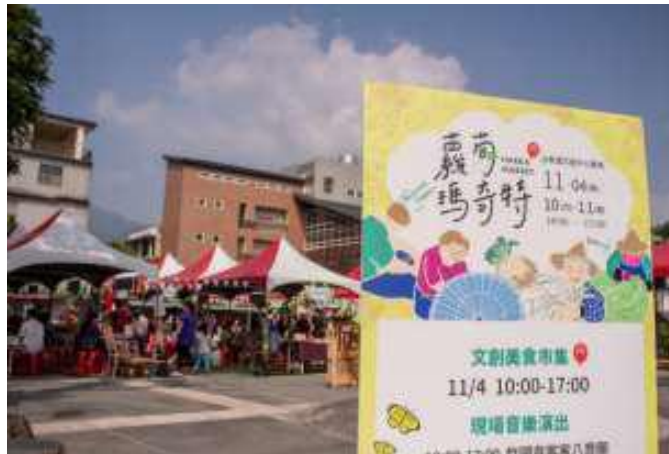
[圖 25] 開庄廣場舉辦葡萄瑪奇特市集