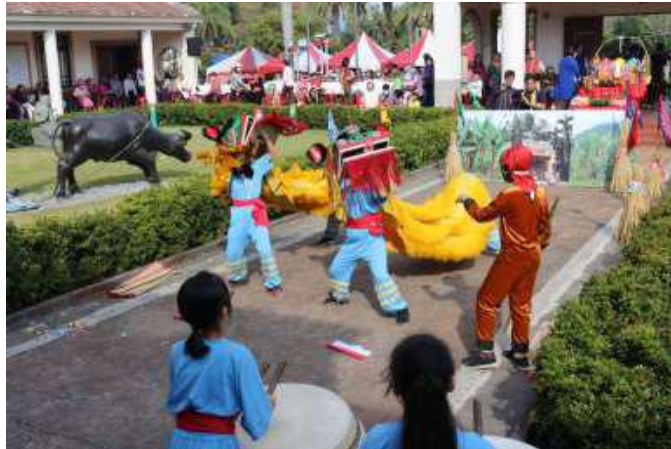
[圖 8] 新春祈福—東門國小客家獅表演

求新的一年風調雨順，祭祀完成後並發放開運紅包及客家粵食給現場民眾，還有客家小提燈、葉拓團扇、檳榔葉貓頭鷹等多樣親子 DIY 活動，吸引 700 位家長跟小朋友參與。（如圖 8、9）