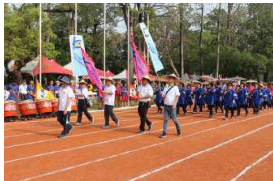
[圖 10] 六堆運動會開幕進場

108 年 3 月 16 日至 17 日第 54 屆六堆運動會由屏東縣內埔鄉主辦，本會同仁與志工組隊參與各項趣味競賽，開幕進場以藍衫與紙傘裝扮展露傳統客家文化特色，吸睛全場。（如圖 10）