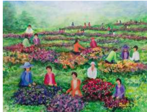
[圖 21] 圓夢畫會作品

108年4月2日至4月30日展出70件油彩、水彩、油畫、壓克力等多元藝術創作，題材含括靜物描繪、高雄人文風情景觀，吸引逾3,812人次參觀。（如圖21）