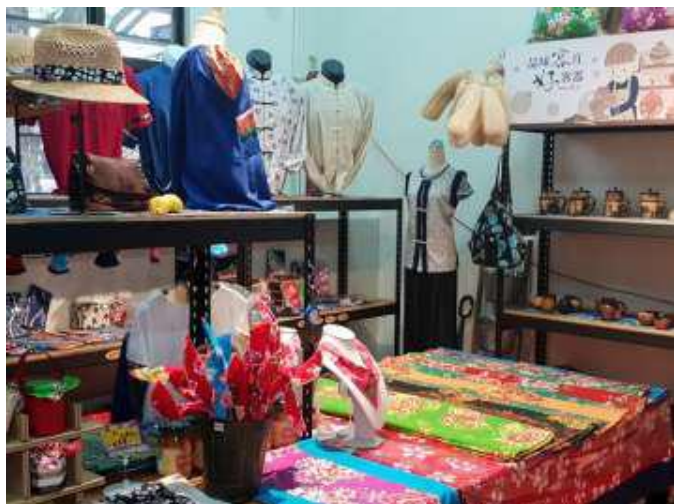
[圖 19] 好客來寮館豐富文創商品