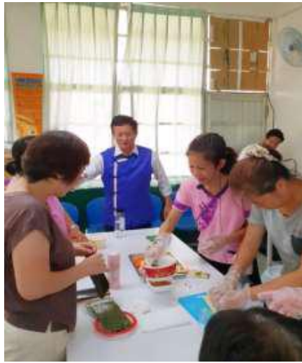
[圖 6] 鳳山區客家甜品播茶課程