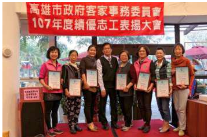
[圖 7] 107年度績優志工表揚

為有效運用社會人力資源，型塑客語無障礙環境，於三民區公所、美濃客家文物館、新客家文化園區文物館等重要公共場所，設置「客語服務窗口」，提供客語之專業服務解說及導覽，108年1月至7月計93名志工投入志願服務工作，總服務時數7,935小時、共服務13萬2,687人次。另為表揚107年度績優志工，108年1月於三民區、美濃區分別舉辦志工表揚活動，計表彰69位志工。（如圖7）