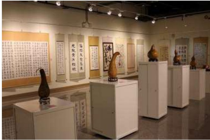
[圖 20] 濃情藝美墨畫香展覽