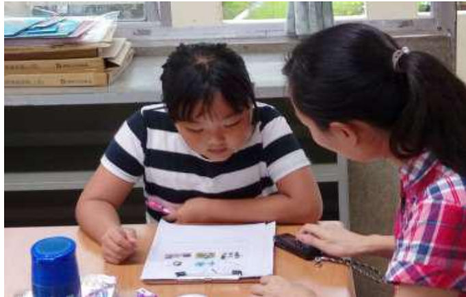
[圖 2] 國小客華雙語後測實施情形