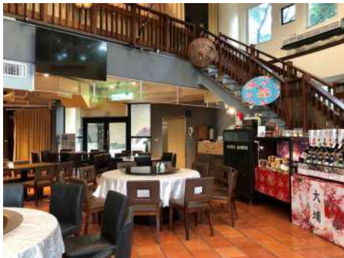
[圖 18] 圓窗驛棧

複合式經營理念打造客家美食餐廳、客家文創展售商店及創客中心，頗受消費者青睞，108年1月至7月來客數計有2萬3,000人次。（如圖18、19）