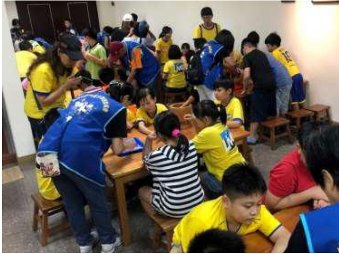
[圖 22] 搗麻糬體驗