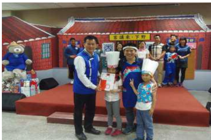
[圖 3] 親子客語說唱活動

為落實「母語在家學」政策，108 年 4 月 13、27 日舉辦「親子說唱培力及道具製作工作坊」及「客語說說唱唱親子演出觀摩活動」2 場多元化親子活動，吸引 49 組家庭 111 名本市國小學生及其家長參加，藉此增加親子間學習客語的傳承動力，並促進家庭世代間的連結與互動，進而營造學校、家庭、社區之客語學習環境。（如圖 3）