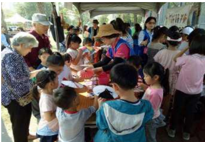
[圖 4] 世界母語日

108 年 2 月 23 日與教育局、原住民事務委員會假凹子底森林公園共同辦理，以客家、原住民、新住民及閩南等四族群文化為主軸，規劃歌舞動態演出及靜態展示，並提供闖關遊戲，鼓勵孩子多說母語，落實語言扎根政策。（如圖 4）