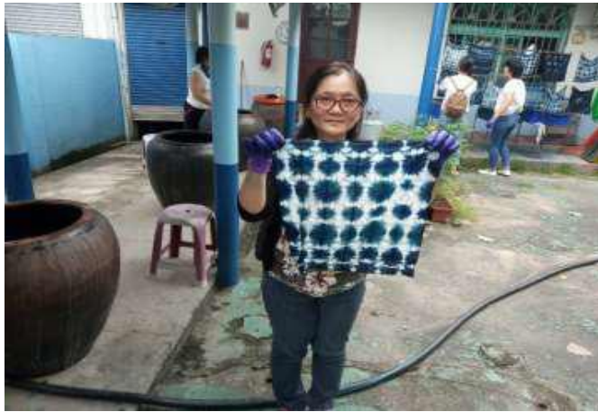
[圖 27] 客庄輕旅行－藍染體驗

配合「田園音樂會」活動，於 108 年 7 月 27、28 日規劃 IG 秘境一日遊、親子小旅行一日遊、深「客」體驗二日遊等特色遊程，並結合旅行社行銷宣傳，帶領遊客到美濃、杉林體驗客家美食、美景及手作 DIY，帶動客庄觀光旅遊發展，計 6 團 250 人參加。（如圖 27）