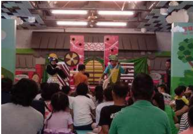
[圖 24] 兒童探索區安排豆子劇團表演