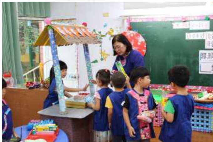
[圖 1] 幼教全客語教學