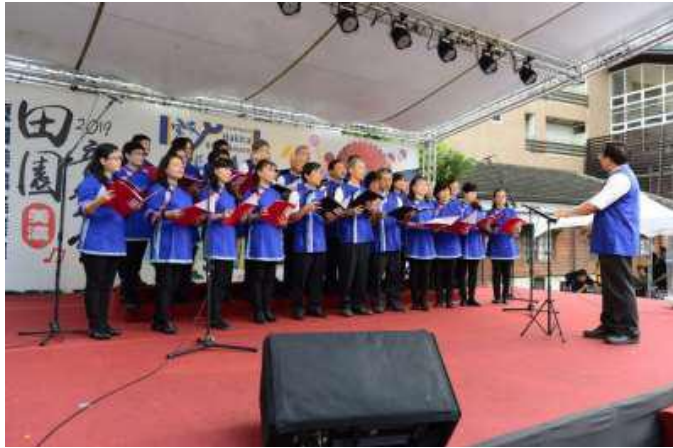
[圖 13] 高雄市田園合唱團演出