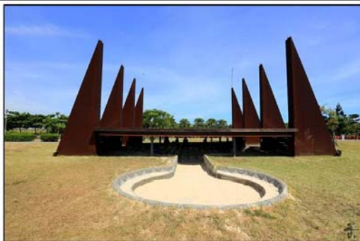
圖為八里十三行博物館·該遊樂場沙坑設有遮棚·能夠遮蔽陽光。南臺灣夏天如此酷熱·若公園沙坑加裝遮陽棚·不但可以防曬·亦能提高離峰時間使用率·但建議不超過 1/3·且定期置換砂土·讓遮陽區內的沙土能夠曝曬消毒。