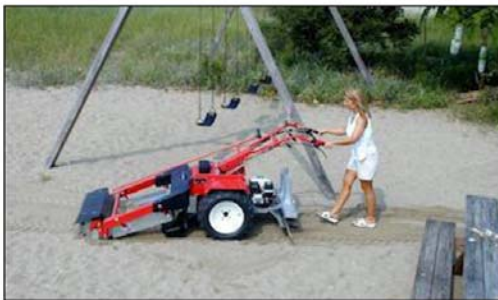
國外採用手推自動翻沙機具進行沙坑維護工作·能清除沙池內的異物·亦能將底部的沙翻動·達到曝曬陽光殺菌的效果。

事件(新聞連結)·所幸民眾發現得早·未釀意外。而國外採手推自動翻沙機具(連結 1、連結 2)·亦可考慮引進採用。而再緊密的防護·關鍵要項 衛教防護宣導不能少 。