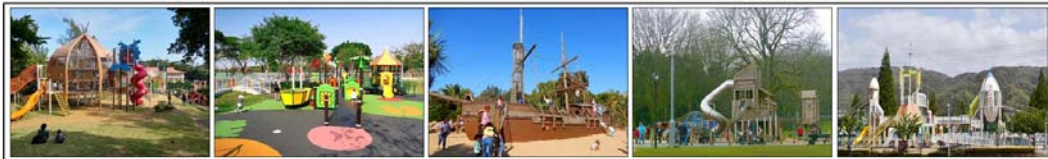
建盟從 4/26 起於 FB 進行「國際兒童夢幻公園大PK」問卷調查，讓網民票選最喜歡的特色公園，由左至右分別是沖繩奧武山公園、高雄衛武營都會公園、倫敦海德公園、英國威爾斯戰爭紀念公園、大阪花園中央公園。

在建盟深入討論沙池問題前，先報告建盟於 4/26 傍晚起 2 天於 FB 所做的趣味問卷調查。