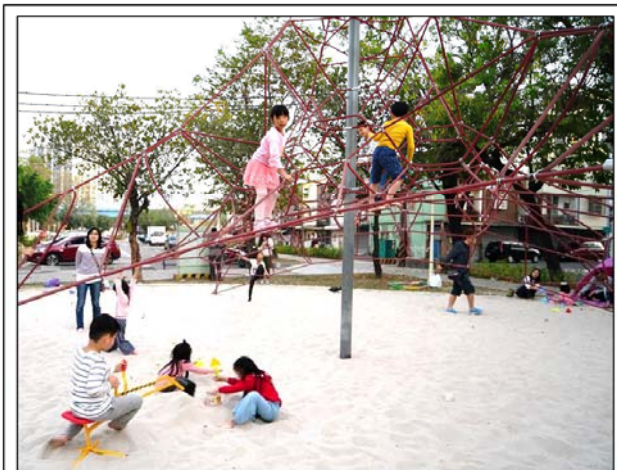
繩索攀爬架高達三米，倘若孩童不慎墜落，底下玩耍的小孩可能遭重壓受傷，建盟建議底層繩索加密，充當防護網。

台灣夏日除颱風外，暴雨也多，極易積水。積水退卻易匯聚異物，危及孩童安全，維護單位應訂颱風暴雨積水後封閉沙池的規定，及清潔維護措施。