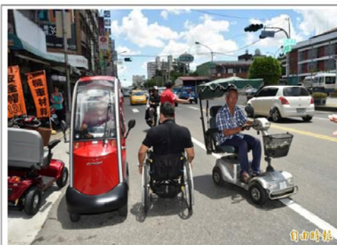
台灣人口結構愈加高齡化，路旁老人代步車隨處可見，惟「交通事故調查報告表」中卻不見此選項。影響事故分析結果。正本清源之道，建議將資訊更完整的「肇事調查筆錄」納入電子化項目，併入交通事故資訊大數據資料庫範圍。

目前，高市交大已完整將「事故調查報告表」及「事故碰撞圖」電子化，惟尚缺詳實記錄肇事過程的調查筆錄。為因應愈加複雜的車禍類型與研究需求，建議交通局、交大，應盡速開發能便利員警，以語音辨識輸入的程式，將車禍事故「肇事調查筆錄」、「交通事故談話紀錄表」電子化，併入肇事分析的大數據資料庫中。