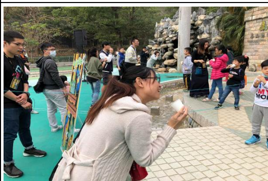
金剛鸚鵡－會飛的傳聲筒教育推廣活動