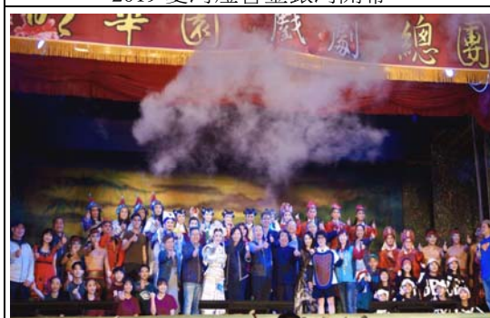
愛河燈會金銀河明華園戲劇總團精湛演出