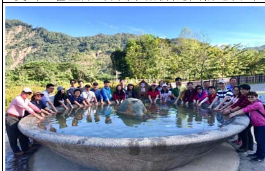
推薦特色旅遊行程踩線團