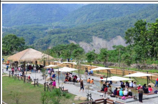
寶來花賞溫泉公園