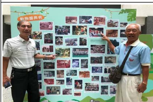
壽山動物園 40 週年老照片展活動