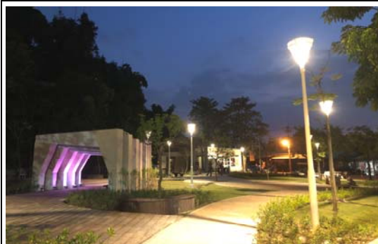
觀音山公廁及周邊環境新建工程