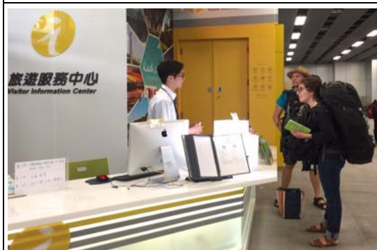
旅服中心榮獲評鑑全國特優