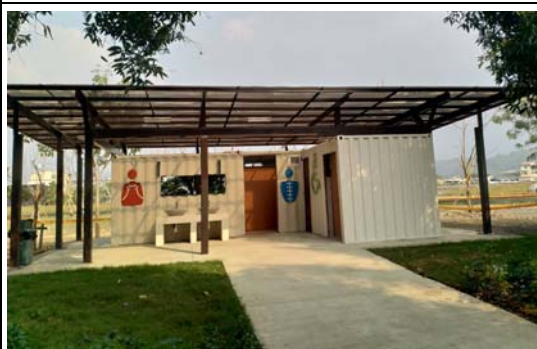
美濃湖環境空間品質改造工程