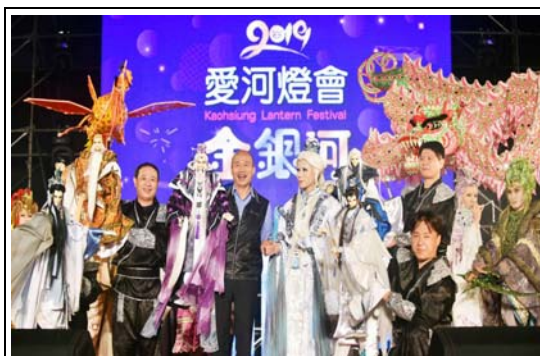
2019 愛河燈會金銀河開幕