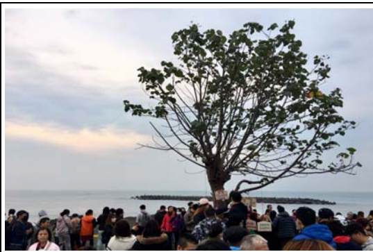
市境之南樹賞日出活動