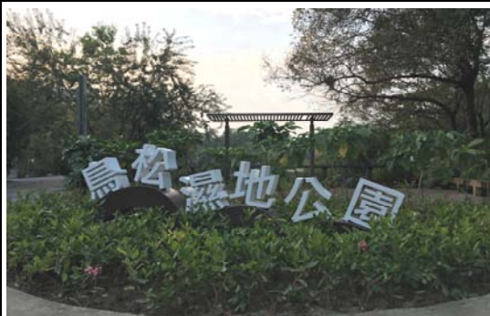
澄清湖及鳥松濕地周邊環境整建工程