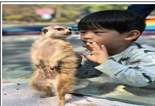
壽山動物園引入全新動物明星狐獴