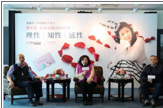
觀光代言人—陳文茜行銷高雄觀光活動

107年10月新增本市新興景點（棧貳庫、哈瑪星光任務、崗山之眼等），介紹4條灣靠遊客6-8小時之特色行程介紹；另針對Fly-Cruise方式乘坐飛機來高搭乘郵輪旅客，設計不同主題，分別提供當日來回及兩日遊的景點建議，讓旅客盡情探索高雄風光。