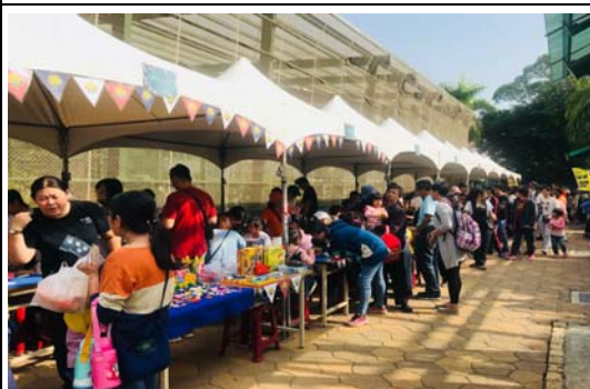
金獅湖「聖誕歡樂蝴蝶園」活動吸引民眾熱烈參與