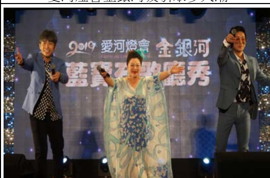
愛河燈會金銀河閉幕壓軸藍寶石歌廳秀