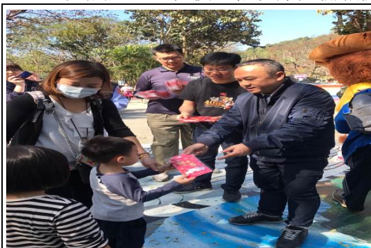
新春向民眾拜年暨發紅包活動

溫和動物區及熱帶雨林動物區等）、水岸休憩區（含水鳥生態景觀區等）及戶外體健區等區域，以擴大園區開發之觀光效益。本計畫目前已完成「農地變更使用說明書」、「水土保持規劃說明書」、「環境影響評估說明書」等審查作業，另開發計畫書經內政部區域計畫委員會大會審查，於 107 年 9 月 5 日獲內政部核發開發許可在案。本案主要聯外道路預定於 110 年 4 月完工通車，園區土地異動登記地預定於 110 年 8 月底完成，規劃於 3 年內完成道路工程後，依程序完備相關土地設定及建設開發作業。