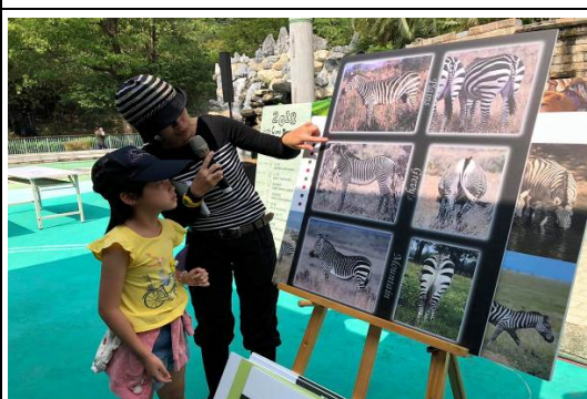
查普曼斑馬主題月活動