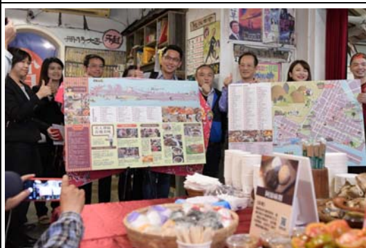
行銷旗鼓鹽美食之旅