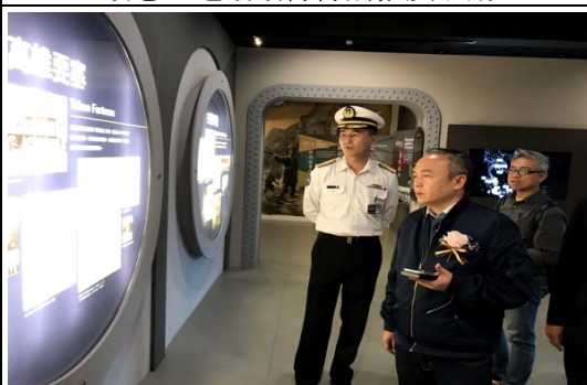
與海軍官校協商推動軍事觀光