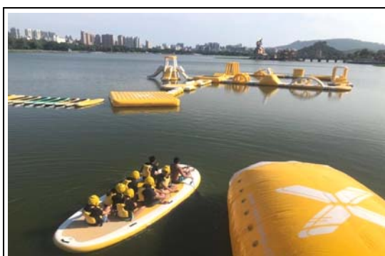
蓮池潭水上彈跳活動