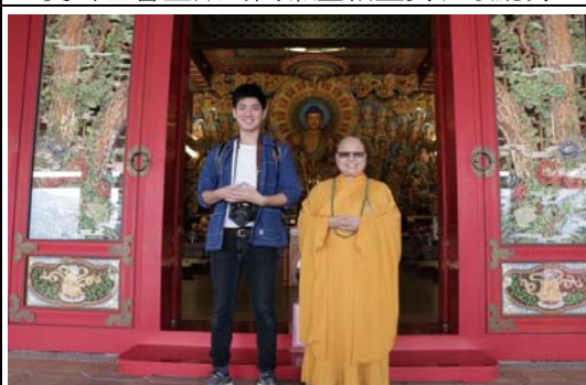
暖心六龜緩緩行行銷推廣活動