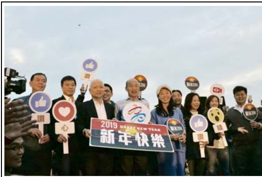
西子灣送夕陽活動