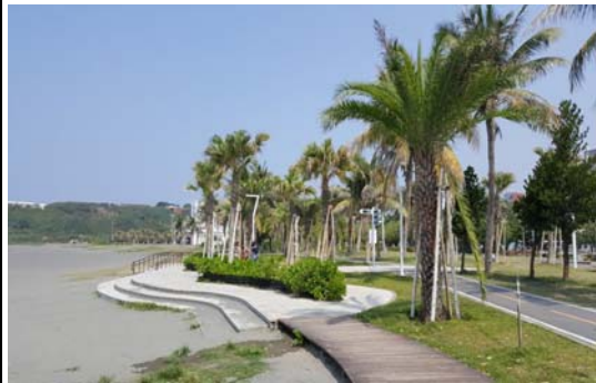
旗津沙灘遊憩區周邊環境改善工程