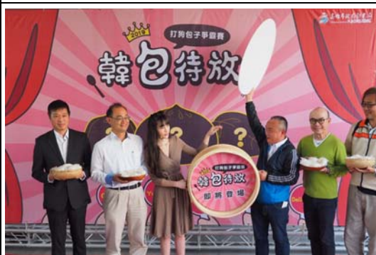
打狗包子爭霸戰行銷記者會