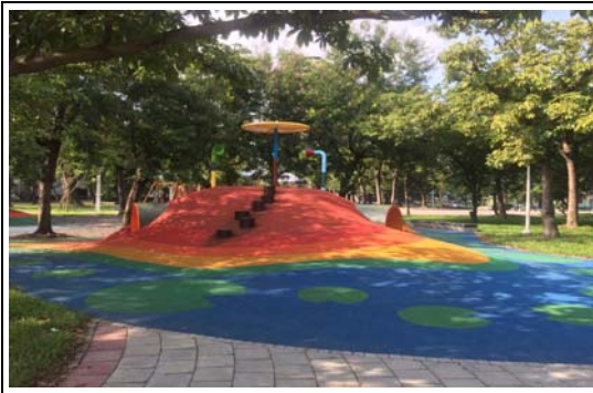
蓮池潭風景區整建工程