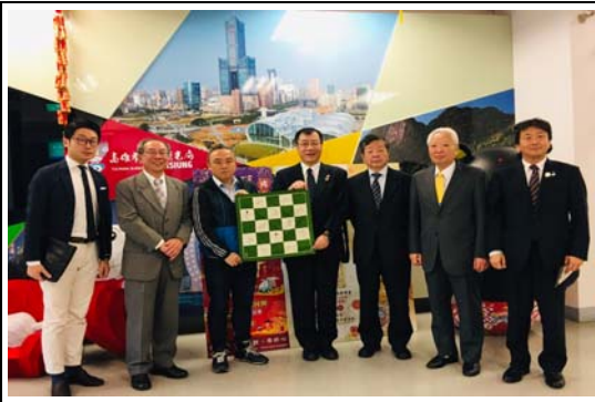
日本京都右京區區長等一行人拜會本局