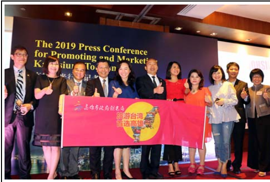
2019 年新加坡地區高雄觀光推廣活動