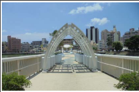
金獅湖風景區整建工程