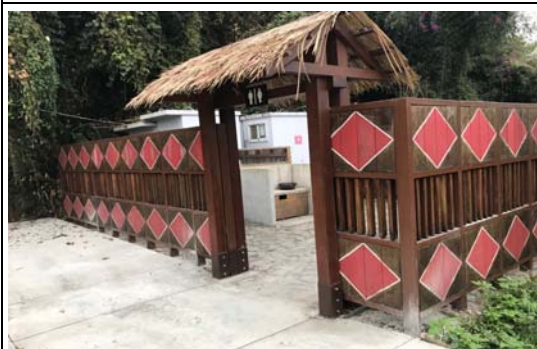
那瑪夏區觀光遊憩設施整建工程