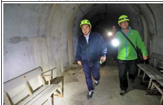
軍事觀光景點勘查