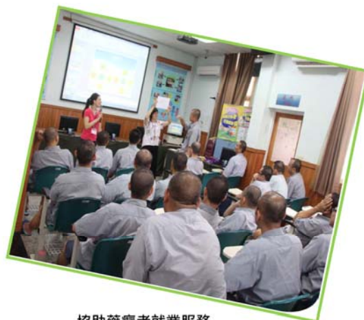
協助藥癮者就業服務