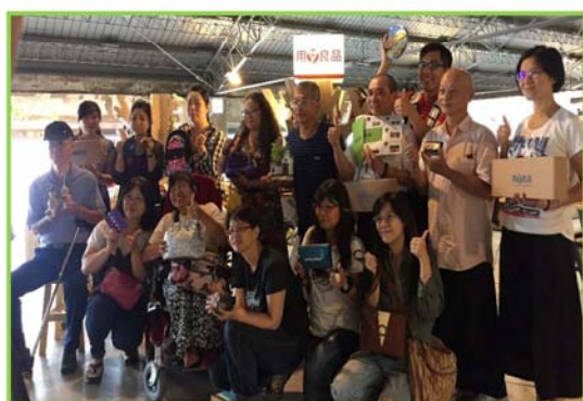
「用心良品」進駐新興景點「棧貳庫」