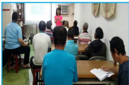
街友參與職前團體課程