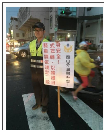
照相逕行舉發效率高無教育意義，攔停開單教育效果好耗費警力效率低。「2 剛 1 柔」1 站崗嚇阻 2 攝影機違規全都錄 3 勸導開罰 2 比 1。 圖：聯合新聞網截圖