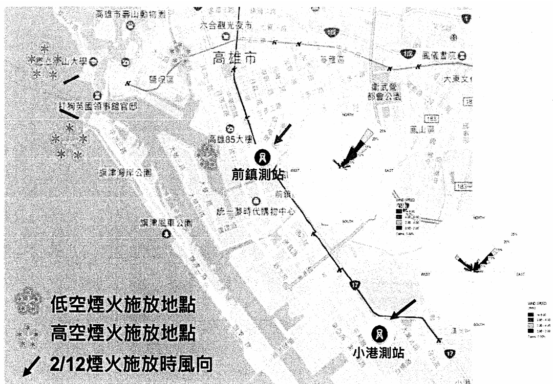
圖 1、煙火施放及測站地點