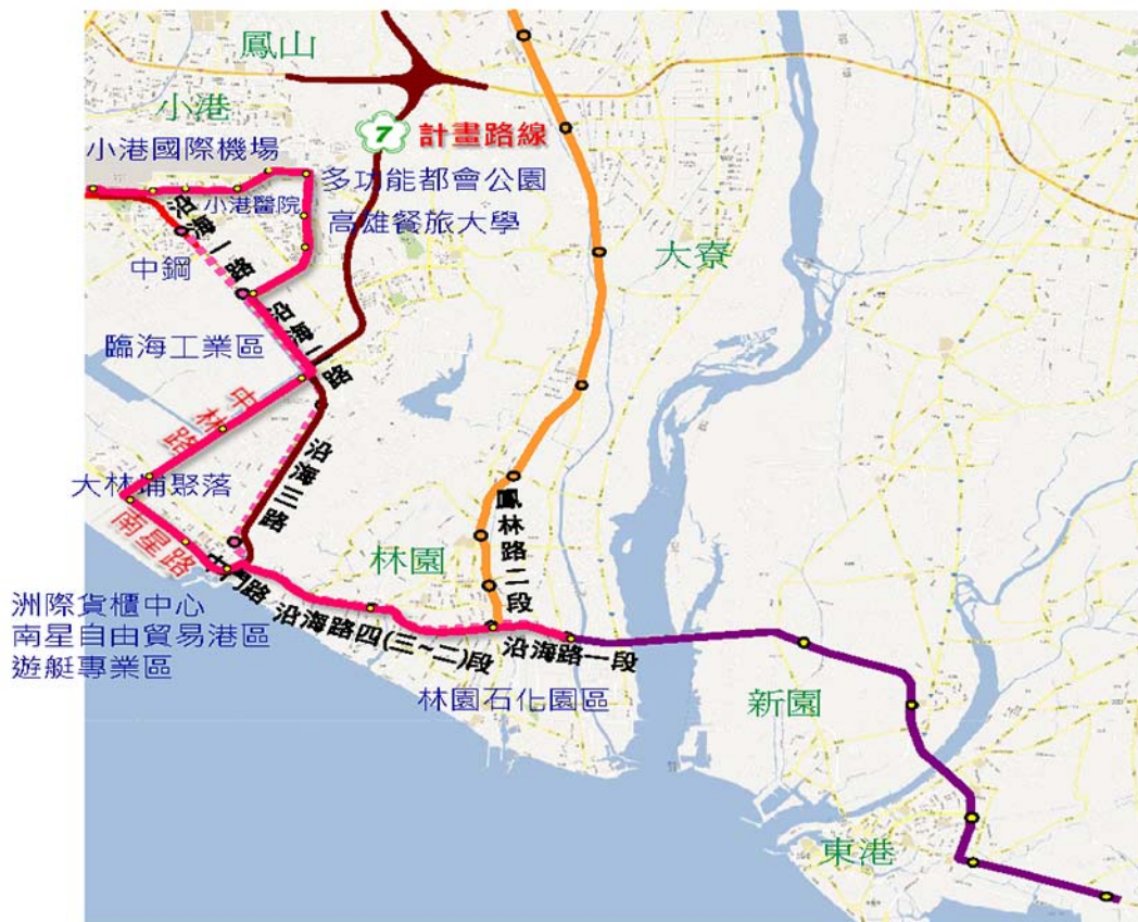
小港鳳鼻頭林園線路線方案示意圖

高雄捷運紅線小港延伸至鳳鼻頭林園線路線規劃案所需經費 1,000 萬元，交通部已於 105 年 7 月 19 日同意補助 840 萬元，不足經費 160 萬元由市府自籌。本局已依交通部核復意見，於 12 月 27 日委託顧問公司辦理規劃評估作業，106 年 1 月 26 日提出工作計畫書，正進行審查作業中。