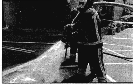
105/7/22 新興區開封路沼氣濃度瀕中毒標準

個月內，高雄接連發生四起下水道沼氣濃度攀升封路警戒的案件。其中7月22日發生在新興區開封路的案件，沼氣硫化氫濃度達18ppm(濃度100萬分之1)，已逼近會造成中毒的20ppm危險標準，且居民表示，狀況並非偶發「這已是住戶最近第三次聞到很濃的瓦斯味」。