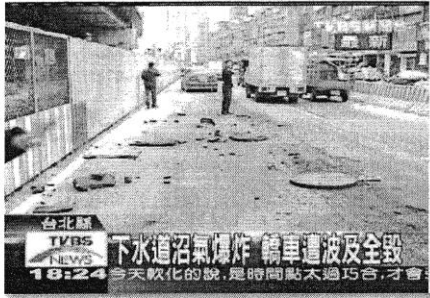
97/1/22 新北市板橋下水道沼氣濃度過高，人孔蓋炸飛。