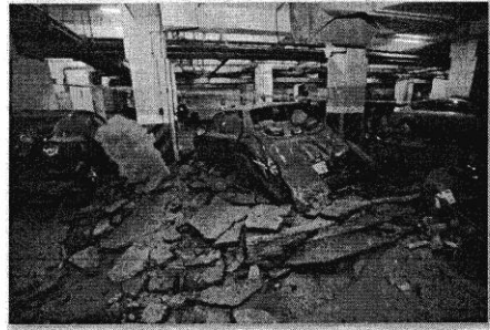
105/6/30 高雄市前鎮區獅甲國宅地下停車場，因管線沼氣濃度高引發爆炸，威力驚人。

大規模的慘痛災難也多次發生，1992年墨西哥瓜達拉哈市發生下水道沼氣腐蝕地下油管，讓油料散佈下水道爆炸，造成252人死亡，五百多人受傷，1.5萬人無家可歸；2年前的高雄81氣爆，也正是李長榮丙烯管漏洩入下水道爆炸造成32死悲劇。一樁樁血淚教訓，高市府當局不得輕忽。