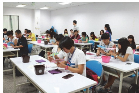
圖 28. 民衆體驗彩繪客家紙傘