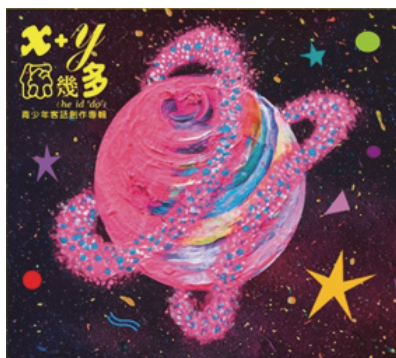
圖 11. 《x+y 係幾多》專輯

104 年 11 月出版青少年客語創作專輯《x+y 係幾多》，以其中一首青少年創作歌曲作為專輯名稱，歌詞均由美濃在地青少年合力撰寫，樂曲則由客籍音樂人聯手創作，可說是結合兩個世代同心協力完成的作品，集合搖滾、流行、嘻哈、民謠、龐克、後搖等多元曲風，搭上青少年的純真心情寫照及日常生活點滴，打破以往傳統的客家樂曲框架，帶來創新的感受，深獲民衆喜愛與好評。(如圖 11)