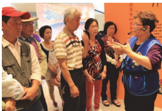
圖 10. 志工導覽情形