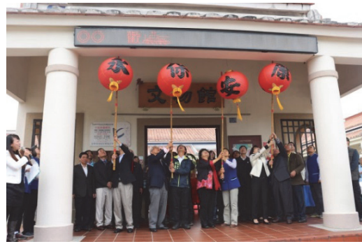
圖 16. 市長與議長等貴賓上燈祈福