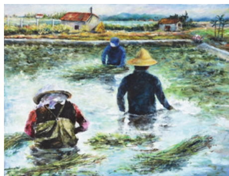
圖 26. 張美蓮油畫藝術展