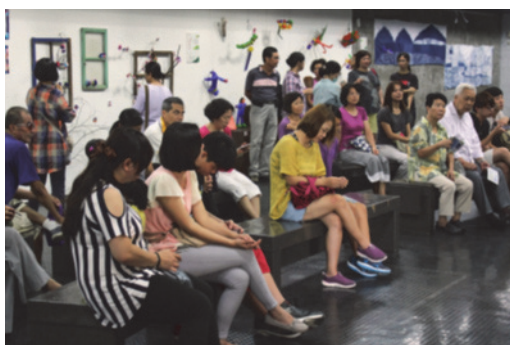
圖 29.環境藝術創作展成果發表