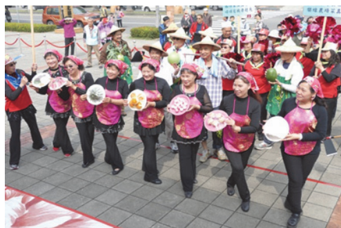
圖 20.環保創意踩街遊行