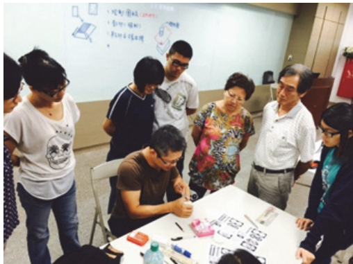
圖 7. 客家學苑-客家文創設計