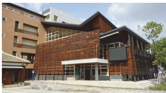
圖 32.美濃文創中心-教育藝文館

1.「美濃文創中心」104年11月6日正式開幕，慶祝系列活動自6日起至8日盛大舉辦，共邀請十多組藝文、音樂團體參與，同時舉辦「戀戀美濃河展」、「創意市集」以及「文創工作坊」等活動，吸引1萬1,000人次參觀，有效達成宣傳行銷效益，並帶動在地觀光產業發展。(如圖32~圖35)