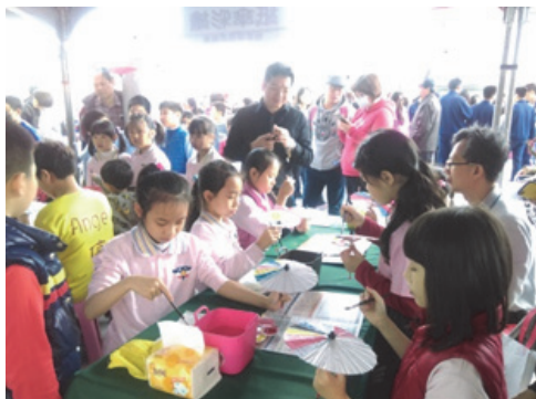
圖 17. 世界母語日-紙傘彩繪 DIY

105 年 2 月 20 日與教育局、原民會假鳳山行政中心共同辦理，以客家、原住民、新住民及閩南等四族群文化為主軸，規劃歌舞動態演出及靜態展示，展現各族群的精采多元文化，並提供多種闖關遊戲，讓參與者藉由闖關活動，體驗和認識不同族群的文化，鼓勵孩子多說母語，落實語言扎根政策。(如圖 17、圖 18)