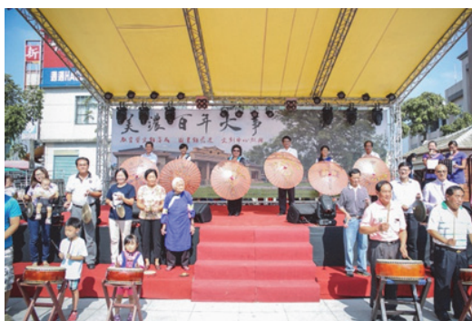
圖 34. 美濃文創中心開幕