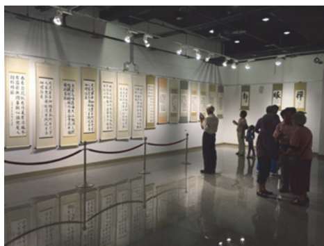
圖 25. 客家諺語書法班師生成果展