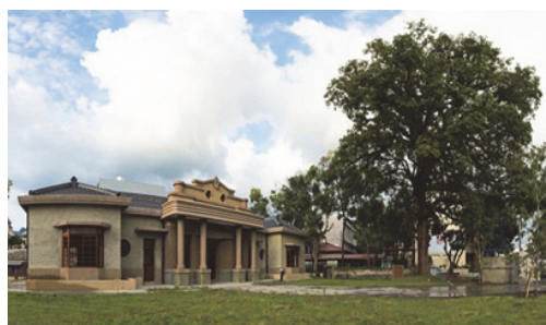
圖 33.美濃文創中心-舊警察分駐所