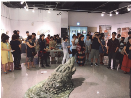
圖 23. 「跨限與連結」聯展