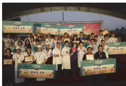
圖 37. 南區客家美食料理比賽

104 年 11 月 28 日與客家委員會假高雄蓮池潭物產館廣場合辦，以南區六縣市在地客庄食材進行競賽，計有 16 隊料理好手參與競賽、25 攤客家特色商品參與展售，現場並有客家藝文表演，吸引 4,230 名民衆到場觀摩。（如圖 37）