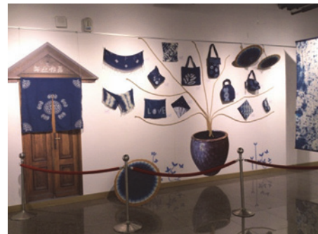
圖 24. 客家藍染創藝展