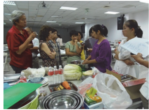
圖 8. 客家學苑-客家醃漬美食