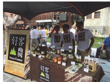
圖 36.「好客山農」設攤行銷

延續 103 年「高雄市客家文化重點發展區特色產品遴選、設計包裝及通路發展計畫」型塑「好客山農」品牌成效，持續協助美濃、杉林、甲仙、六龜區農特手工、