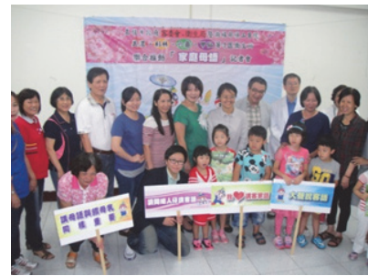
圖 4. 家庭母語記者會

與旗山醫院及美濃、杉林、六龜、甲仙等 4 區衛生所聯合推廣「家庭母語」，104 年 9 月 1 日辦理宣傳記者會，廣邀各區母語家庭共襄盛舉，鼓勵父母跟孩子多以母語交談，並提供本會製作的客語童謠專輯、出版品及嬰兒用品，落實母語扎根政策。(如圖 4)