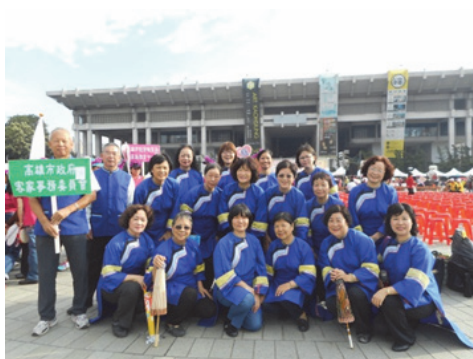
圖 9. 本會志工參加國際志工日