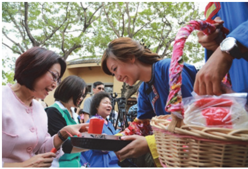
圖 15. 客家傳統婚禮習俗-食新娘茶