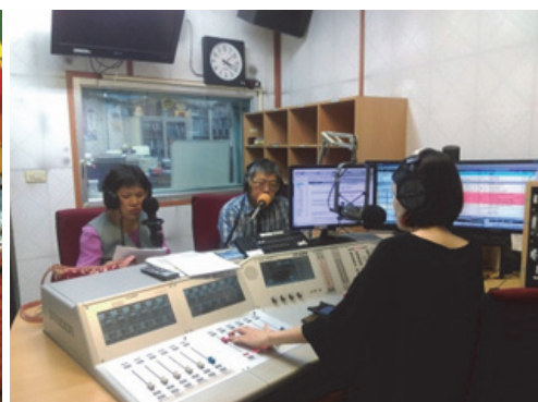
圖 22.「最佳時客」廣播節目