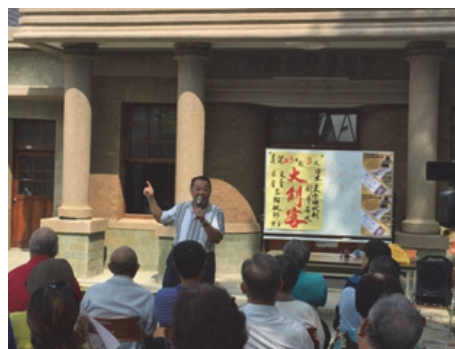
圖 12. 美濃地區戲院風華座談