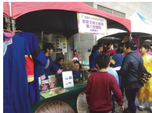
圖 18. 客家文物展示及出版品展售