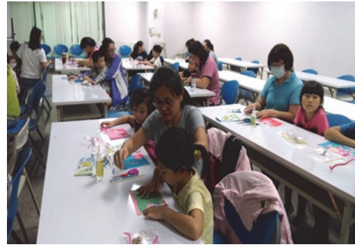
圖 3. 客語家庭學苑-手作坊