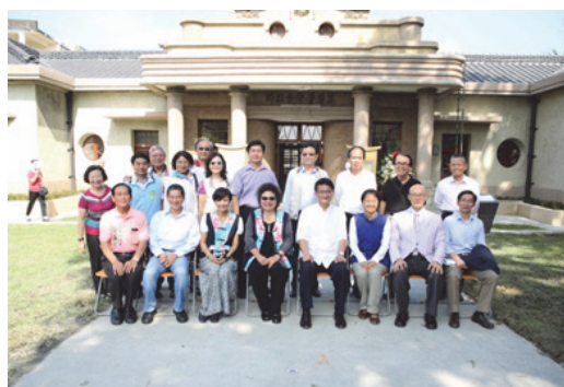
圖 35. 美濃文創中心開幕留影