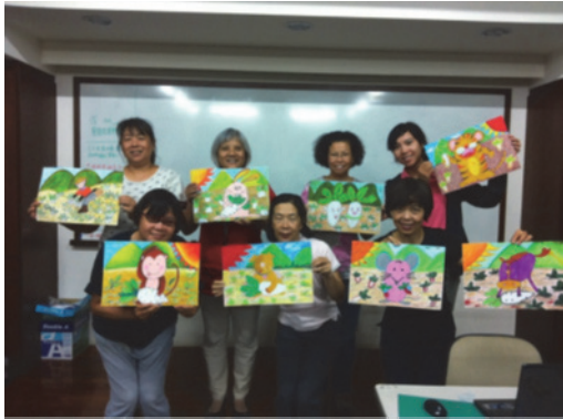
圖 5. 客庄繪本故事創作班