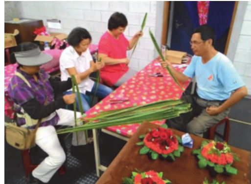
圖 6. 從植物看客家人的智慧進階班