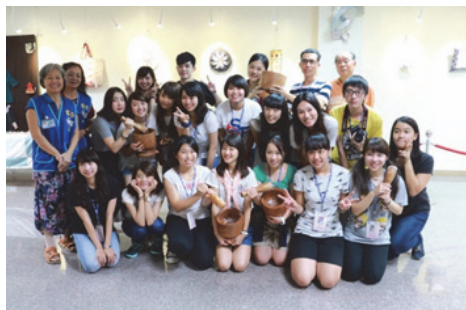
圖 27. 日本遊客體驗搗麻糬