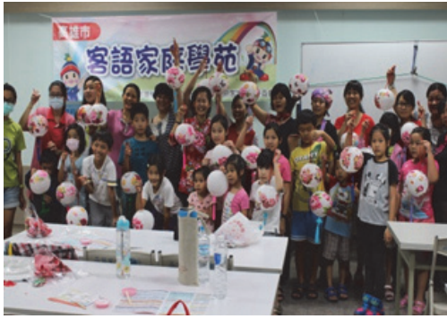
圖 2. 客語家庭學苑-花布燈籠班