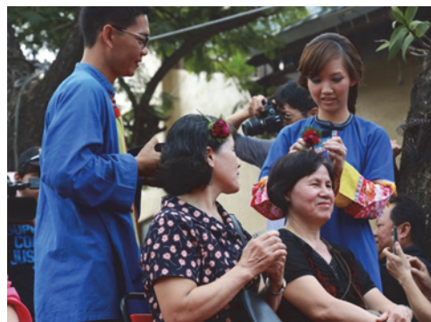
圖 14.客家傳統婚禮習俗-插頭花