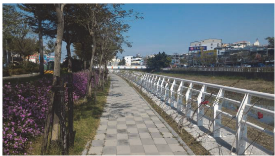
阿公店溪河岸綠地維護