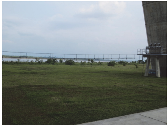
大樹斜張橋綠地維護