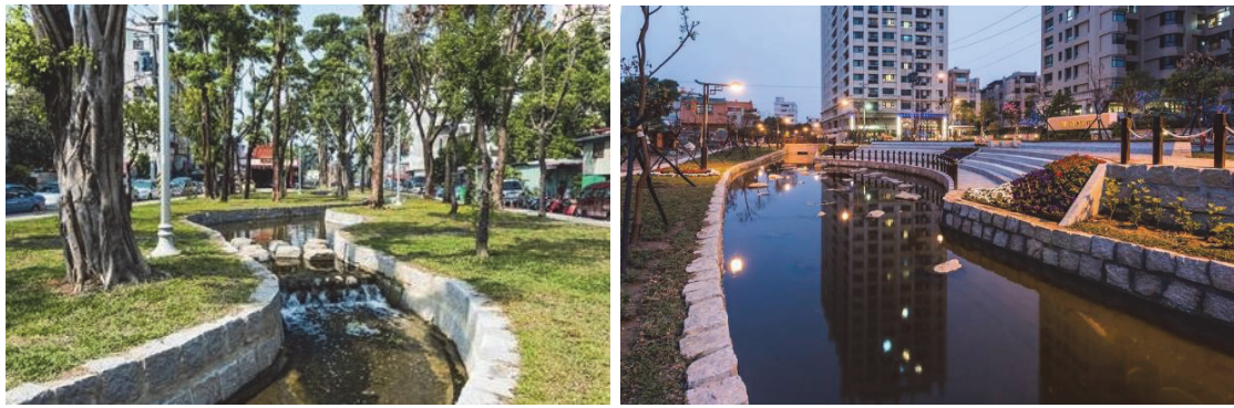
鳳山區曹公圳第五期水岸營造計畫