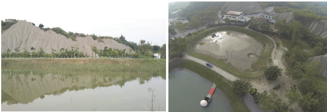
月世界滯洪池維護