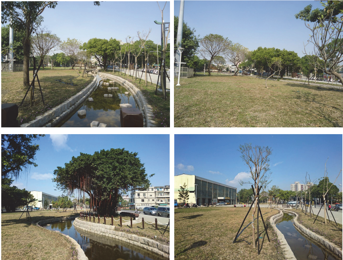
曹公圳六期（安寧街至復興街）工程