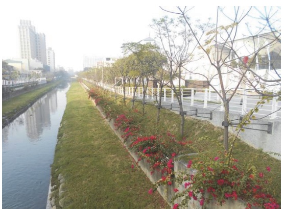
鳳山溪大東橋一帶綠地維護