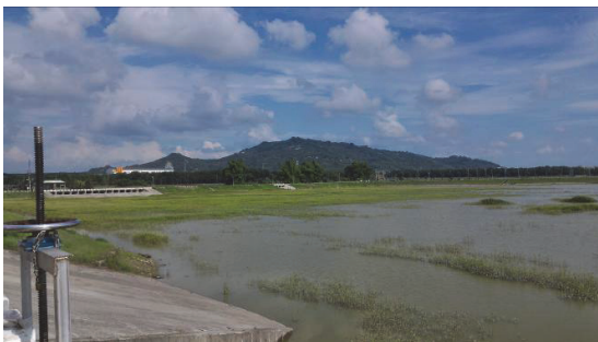
前峰子滯洪池維護