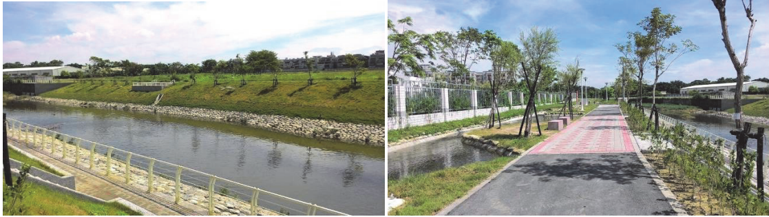
鳳山溪都市水環境營造計畫