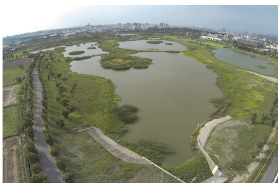
典寶溪 A 區滯洪池維護