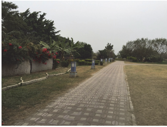
大樹舊鐵橋綠地維護