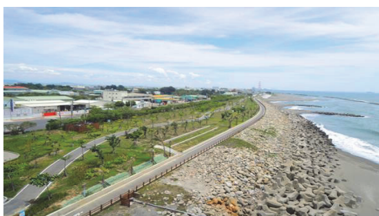
茄萣海岸公園維護