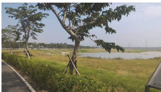
典寶溪 B 區滯洪池維護