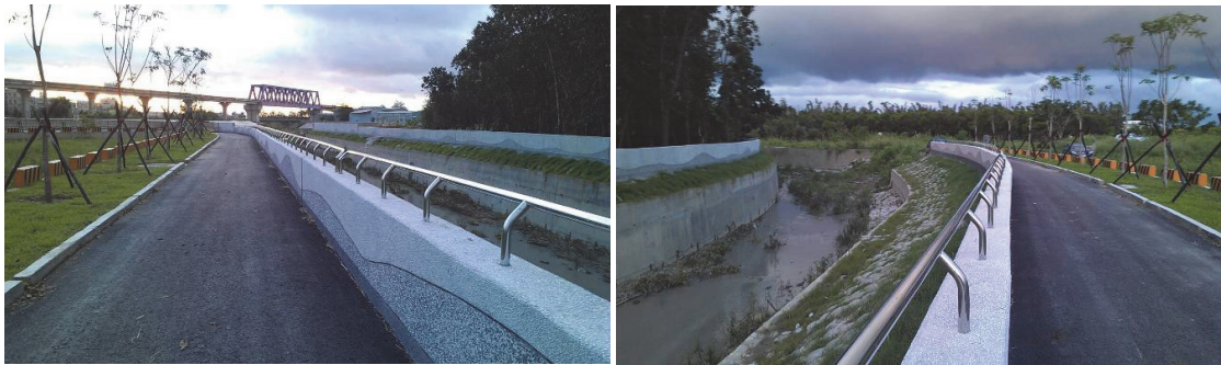
典寶溪排水系統-筆秀排水（出流口至海城橋段）整治計畫（第一期）