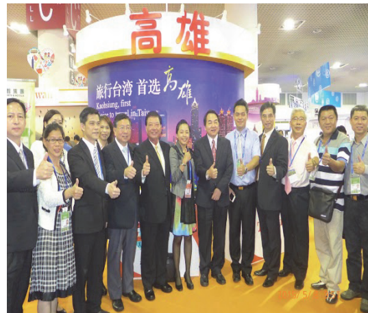
廈門「2015 第十一屆海峽旅遊博覽會