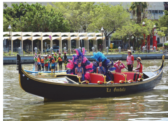
水漾高雄嘉年華活動熱鬧開幕