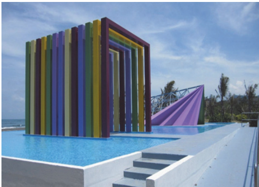
旗津特色裝置藝術新亮點

繼與港務公司合作建置巨大貝殼造型之「黃金海韻」公共藝術，旗津管理站室內空間已委託婚紗業者建置婚紗攝影場景，作為新人婚紗取景之用，戶外場地則建置特色造型裝置藝術，其中「彩虹教堂」已成為遊客拍照新亮點，成功地藉由新元素的注入，活絡週邊場域，增添旗津旅遊豐富性。