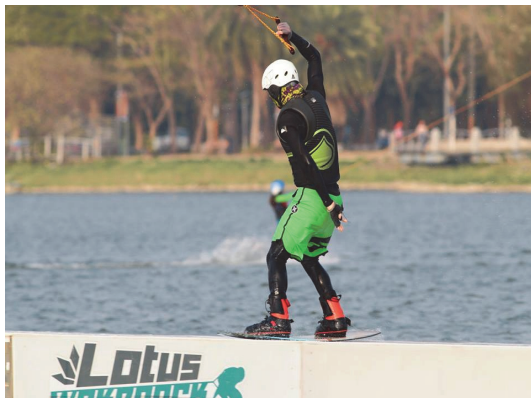
蓮池潭纜繩滑水體驗活動

於 2 月 3、4 日及 10、11 日分二梯次舉辦「2015 蓮潭滑水主題樂園冬令滑水挑戰營」；7 月 7、8、20、21 日及 8 月 4、5 日配合暑假舉辦「2015 蓮潭滑水主題樂園夏季纜繩滑水挑戰營」，讓參與者體驗纜繩滑水的樂趣，進而推廣纜繩滑水零污染、滑水過程活化水源含氧量兼具環保效能的理念。