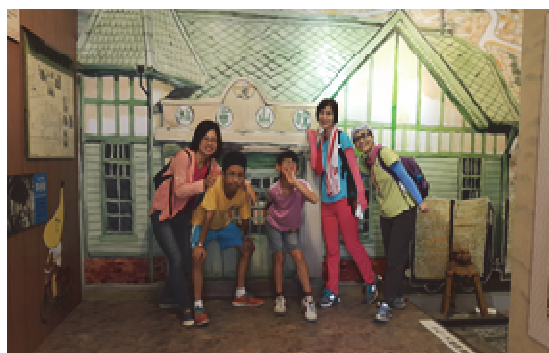
探索農村漫遊-手作稻草編織樂