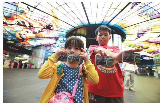
民眾體驗高屏澎好玩卡智慧旅遊