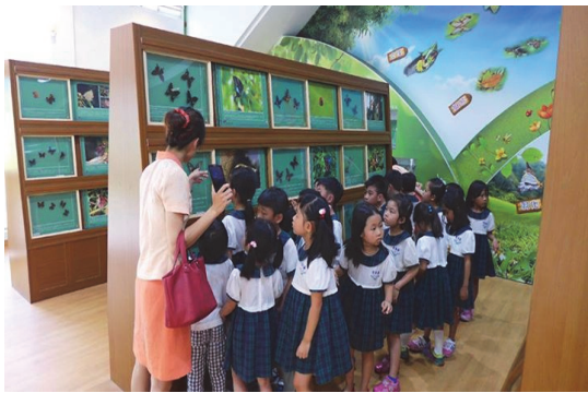
金獅湖蝴蝶園已成為校外教學熱門景點