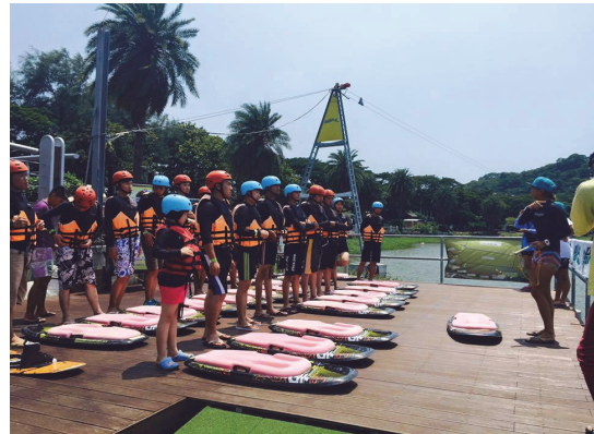
蓮潭夏季纜繩滑水挑戰營