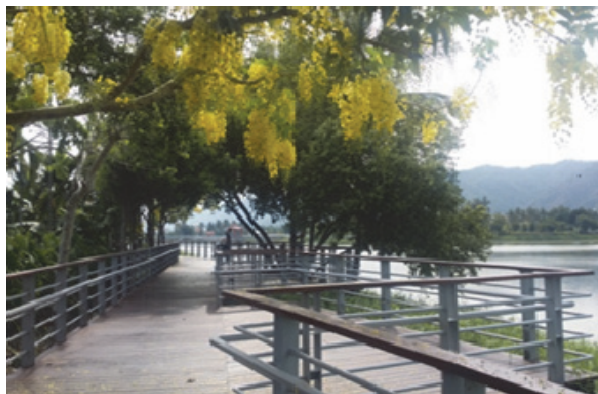
美濃區親水步道設施改善工程

由客委會補助 410 萬元及本府配合款 78 萬元，共計 488 萬元，辦理美濃中正湖步道、照明設施等改善工程，已於 104 年 4 月 21 日完工，有效優化中正湖整體休憩環境。