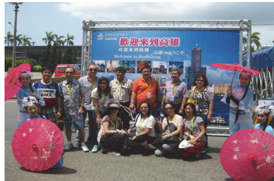
熱情接待國際郵輪