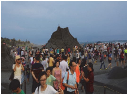
旗津黑沙玩藝節吸引眾多遊客