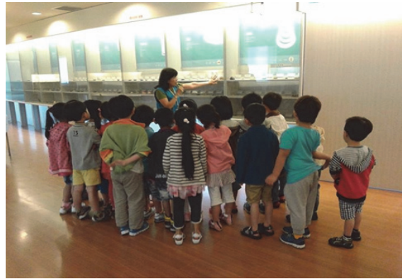
旗津貝殼館志工為參觀學童親切解說