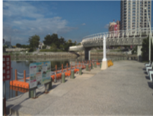
愛河水岸璀璨星帶整建工程