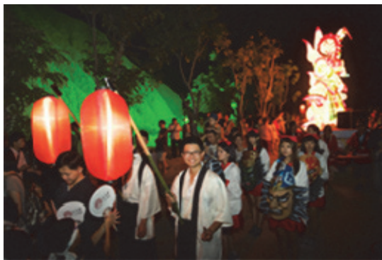
田寮月世界活動民衆參與熱烈