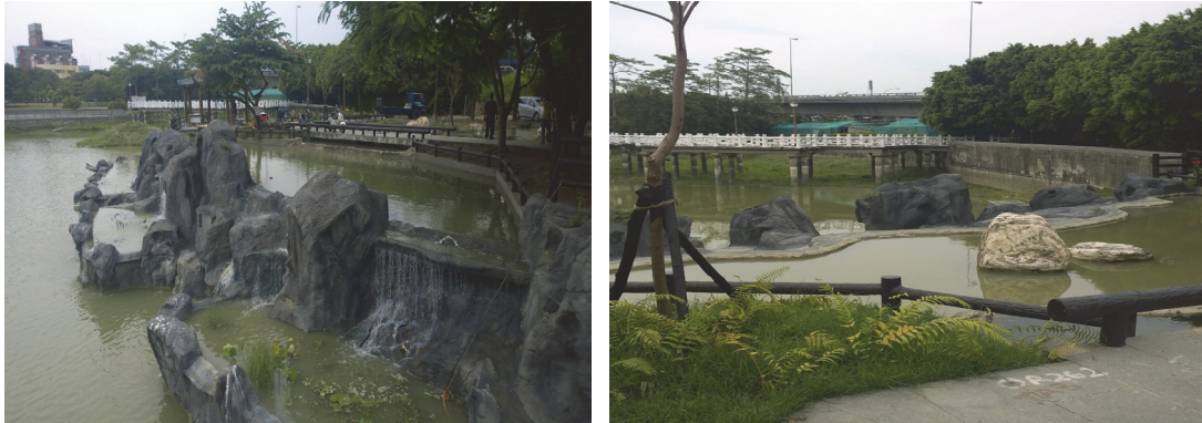
金獅湖園區邊坡護欄修復

動支本府災害準備金 973 萬元，辦理金獅湖園區邊坡護欄坍塌修復，提升安全休憩功能，104 年 8 月 17 日完工。