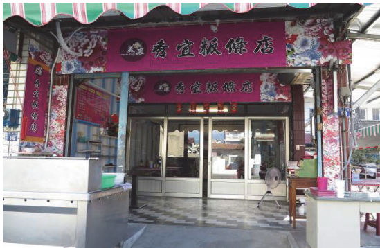
餐飲店家門面景觀之改善

為促進區域觀光及產業發展，輔導本市都會區及美濃區之特色餐飲業者提升觀光景點之餐飲品質，已於 104 年 6 月完成美濃地區 5 家店面之餐飲輔導及環境改造工作；另擇定本市 36 家具故事性之餐飲店家，於 104 年 8 月設計編印 14,000 本宣傳手冊，廣為行銷宣傳。