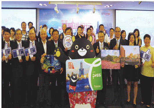
香港觀光推介會，行銷「高澎屏好玩卡」