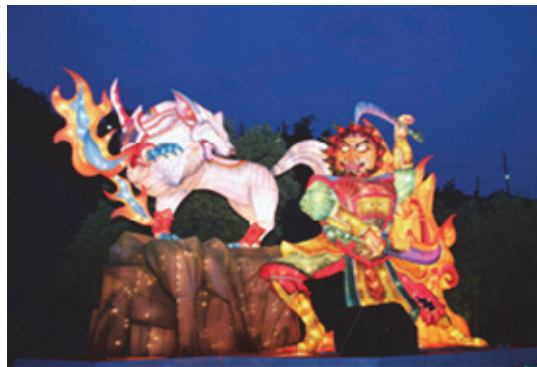
田寮月世界主題活動裝置