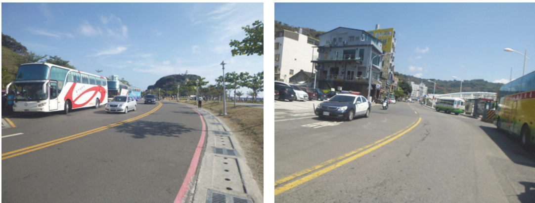
西子灣交通壅塞情形已獲得大幅改善

西子灣夕陽美景每日均吸引大量遊客前往觀賞，大量遊覽車亦集中在尖峰時段湧入，造成周邊道路交通壅塞。為改善西子灣地區交通秩序，本局建置「西子灣大客車總量管制系統」，並公告自今（104）年 5 月 18 日起實施大客車總量管制，每日 15 時至 19 時，每小時僅開放 45 輛持證遊覽車進入西子灣。本局除負責該管制系統建置，另負責現場管制及稽查工作，實施以來成效良好，大客車平均每日進入 120 輛，減少約 33%，大幅改善西子灣交通壅塞問題。