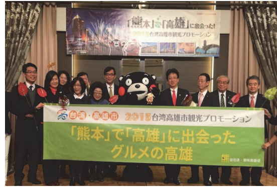
日本熊本高雄觀光推介會