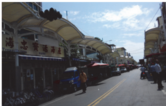
旗津海岸公園修復工程

交通部觀光局補助 1,000 萬元、本府配合款 3,000 萬元，共計 4,000 萬元，辦理貝殼館至環保局清潔隊間，植栽工程、自行車道串聯、步道修繕及既有建物修繕工程，提供旗津風景區更優質休憩空間，已於 104 年 5 月 11 日完工。