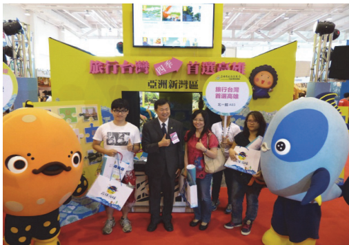
高雄國際旅展高雄館