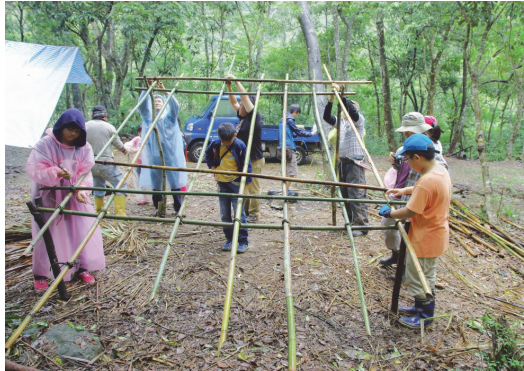
茂林魯凱獵人學校夏令營

104 年 7 至 8 月結合在地資源，規劃「茂林魯凱獵人學校」、「戀戀蚵仔寮『漁村夏令營』親子體驗」、「創遊大社」、「富樂夢魔法 3D 列印觀光工廠夏令營」、「實踐大學宋江陣文化兒童體驗夏令營」、「滑水主題雙語夏令營」、「《火車大富翁》特別企劃－高雄篇」等 9 項以觀光、文化與產業的主題式夏令營活動，獲得熱烈迴響，多數營隊開放報名旋即額滿，總計約 2,000 人次參與。