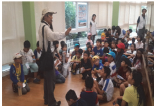
志工服務隊提供專業導覽解說