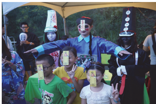
月世界現場遊客爭相與活動鬼怪合照