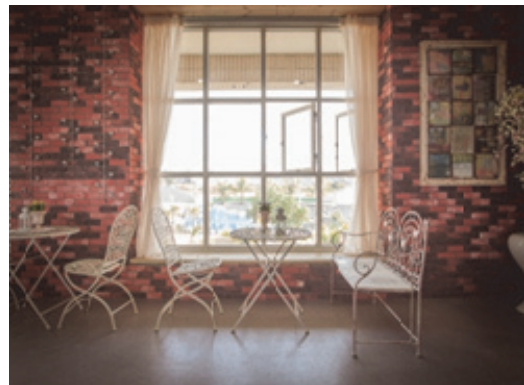
旗津婚紗攝影場景