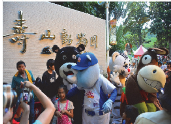
動物園延長夜間開放成爲夜間觀光之特色景點