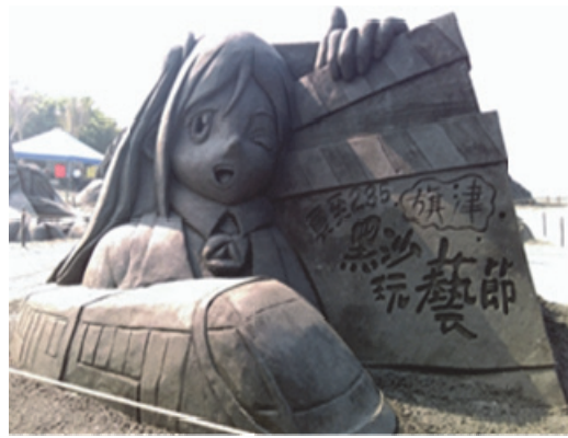
旗津黑沙玩藝節創意沙雕