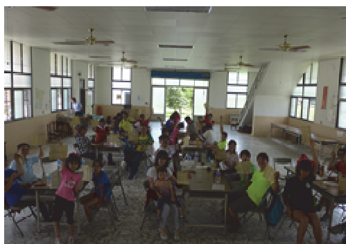
旗美蕉遊趣-走訪走訪旗山文化園區

104 年 7 月至 9 月底於美濃、旗山、六龜及甲仙等地區，共計辦理 7 條路線 11 梯次遊程，帶領遊客騎單車探訪地區特色景點（例如旗山生活園區，旗山老街、中正湖、美濃客家文物館、雙溪母樹林、永安老街、美濃橋、敬字亭、獅山大圳…等），更安排地方特色文化體驗活動，讓遊客於飽覽自然風光外，對當地文化有更深度的認識，除可提升旗美區的觀光知名度，更可以活絡地方觀光產業活動，預計吸引遊客體驗人數近千人次。