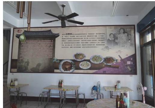
餐飲店家內廳設計故事牆