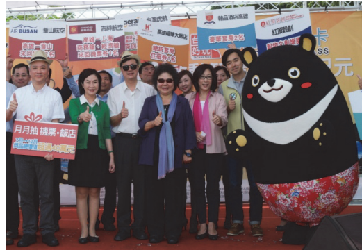
好玩卡首周破萬記者會