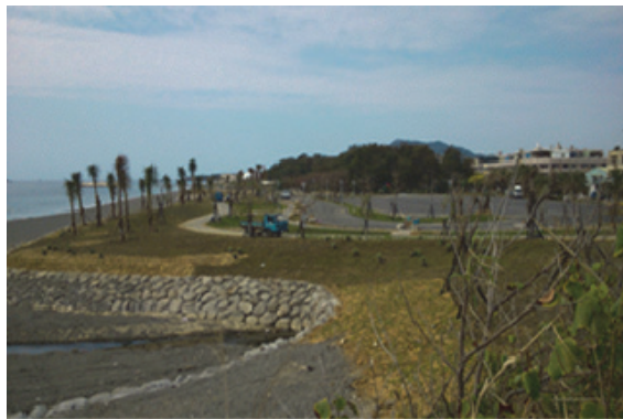
旗津廟前路觀光環境改善工程