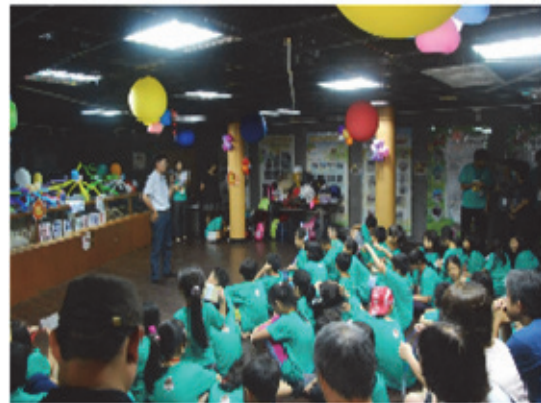
動物園夜宿營活動廣受好評