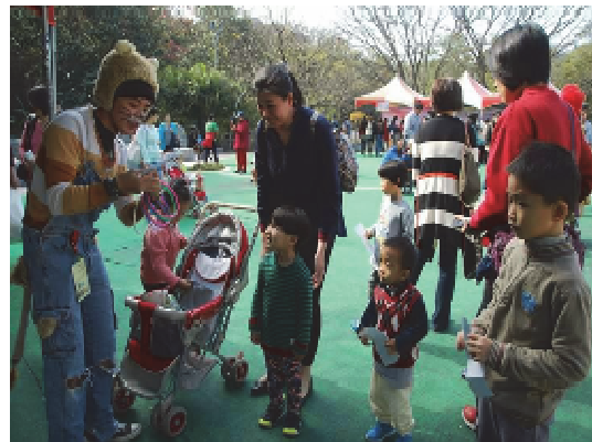
多元化教育行銷推廣活動