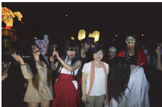
月世界鬼月系列活動