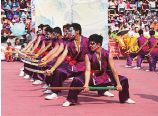
內門宋江陣活動開幕

「2015 高雄內門宋江陣」活動於 104 年 3 月 28 日至 4 月 6 日在內門南海紫竹寺舉辦，除文武陣頭大匯演、總鋪師美食饗宴及遶境祈福活動外，首度開放高中職與大專院校共同角逐創意宋江陣頭大賽百萬獎金；另亦首次舉辦結合宋江招式與瘦身有氧健身操的「全民功夫操－宋江很操」大賽，創意表演讓全場民衆耳目一新。活動期間參觀人次約 22 萬人次，創造約 2.2 億元經濟效益。