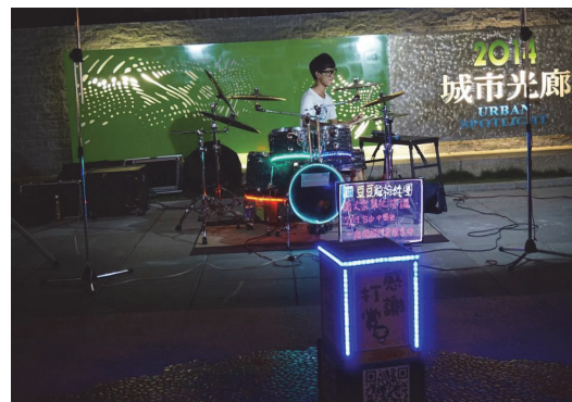
夜間觀光活動街頭藝人表演