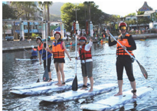
民衆歡喜參與「舟遊愛河」獨木舟及立式划槳體驗