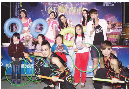
夜間觀光活動現場與民衆互動合照