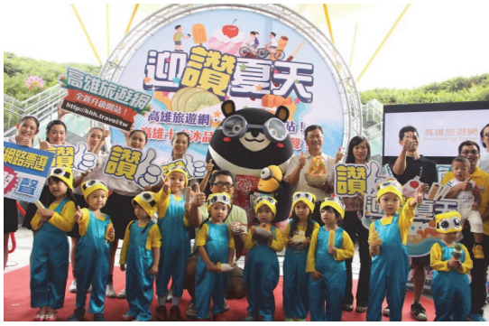
冰品網路票選活動記者會