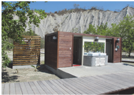
自然地景風景點整體建設工程