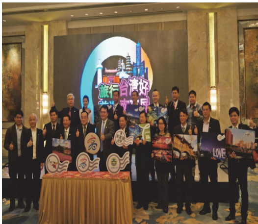
大陸東北三省推介會及參訪