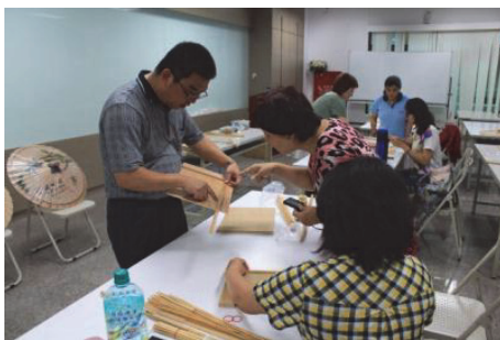
圖 3.客家學苑-紙傘創作班

於「客家學苑」、「美濃客家學堂」、「鳳山客家傳習教室」開辦「客語初級班」、「輕鬆說客語班」、「我等來講客家話」、「客語廣播人才培訓」、「客家紙傘創作」、「客家生活彩繪」、「客庄繪本故事創作班」、「客家古禮進階研習」、「從植物看客家人的智慧進階班」、「小小解說員培訓班」、「美濃里山藝術創作班」等34門客語學習及文化技藝培訓班，計2,124人次參與，透過不同主題，讓民衆以寓教於樂的方式學習客語，展現客家多元豐富的文化藝術。(如圖3、4)