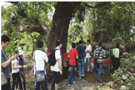
圖 14.客庄文化產業套裝旅遊

配合第 50 屆六堆運動會在本市六龜區舉辦，行銷本市客庄豐富地景、文化及產業，於 104 年 3 月 21 日至 4 月 7 日辦理高雄客庄文化產業套裝旅遊活動，計 18 輛遊覽車一日遊帶領 646 人到本市客庄體驗客家文化及農事生活，另於 3 月 14、15、21、22 日於屏東六堆客家文化園區，27、28、29 日於六龜寶來商街設攤行銷本市客庄品牌-「好客山農」及「微笑市集」農特產品。(如圖 14、15)