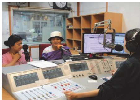
圖 7.「最佳時客」廣播節目

爲落實客家語言文化推廣，讓其他族群更認識客家，與高雄廣播電臺合作，每週一下午 4 時 5 分至 40 分，於 FM94.3 播出「最佳時客」現場直播節目，深受市民朋友好評。(如圖 7)