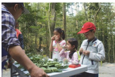
圖 5.「全國客家日」闖關遊戲

104 年 6 月 24 日以新創的「十全十美」送祝福入囍門儀式強力宣傳，招募「客家有囍婚禮」新人及寶寶家長踴躍報名參加，並廣邀鄉親、市民朋友及第 1、2 屆新人帶著孩子回娘家，分享婚後生活與育兒辛勞，計 100 人次參加。(如圖 6)