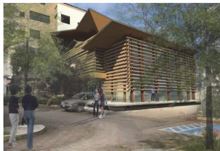
圖 12.美濃學園教育藝文館模擬圖

以美濃中庄歷史地景門戶意象，兼顧地方四十餘年來的圖書、藝文空間實質需求，新建一座集教育、圖書、文化、藝術複合式功能之「教育藝文館」，並充實室內展示軟體及營運規劃，總經費 1 億 3,233 萬元，預計 104 年 11 月完工。