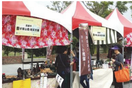
圖 15.六堆客家文化園區設攤行銷