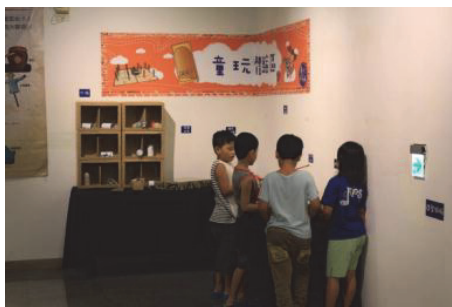
圖 9.童玩 Fun 暑假特展