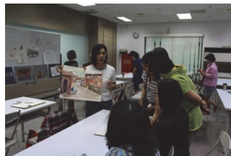
圖 4.客家學苑-生活彩繪班