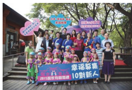
圖 6.「客家有囍婚禮」新人招募記者會