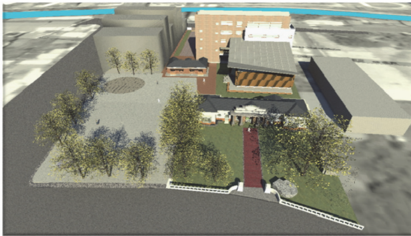
圖 11.美濃文創中心示意圖

透過現代角度及文創手法重新賦予新的活力及生命，並結合地方產業文化資源，成為文創開發、產業展售平台及觀光資源中心。（如圖 11）