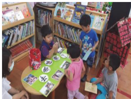
圖 1. 福安國小附幼客語闖關遊戲

輔導美濃、旗山、杉林等區 14 所幼兒園及美濃區龍肚、龍山、中壇及美濃 4 所國小實施「全客語沉浸教學」，並辦理師資培訓計畫，提升教師專業知能，以客語做為授課的主要語言，於授課過程中營造生活化的全客語學習環境，使學童自然而然學會客語。(如圖 1)