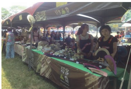
圖 13. 於原住民聯合豐年祭設攤行銷

延續 103 年「高雄市客家文化重點發展區特色產品遴選、設計包裝及通路發展計畫」型塑「好客山農」品牌成效，持續協助美濃、杉林、甲仙、六龜區農特手工、加工品、手工藝品商家辦理包裝設計及設攤設櫃拓展行銷通路，另預訂於 104 年 9 月至 11 月間辦理創業知能研習及座談會，協助在地青年創業準