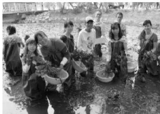
蓮池潭採菱角體驗活動