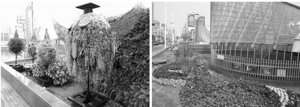
美麗島捷運站出口植栽景觀創作

為營造聖誕節、農曆春節等節慶歡樂氣氛，特別於美麗島捷運站設置「愛心天鵝」、「快樂頌」等大型藝術造景，運用立體綠雕創作及燈飾設計，結合色彩鮮豔之四季草花，呈現色彩繽紛的視覺饗宴，成功勾勒出幸福城市的氛圍，成為婚紗攝影及城市旅遊拍照新亮點。