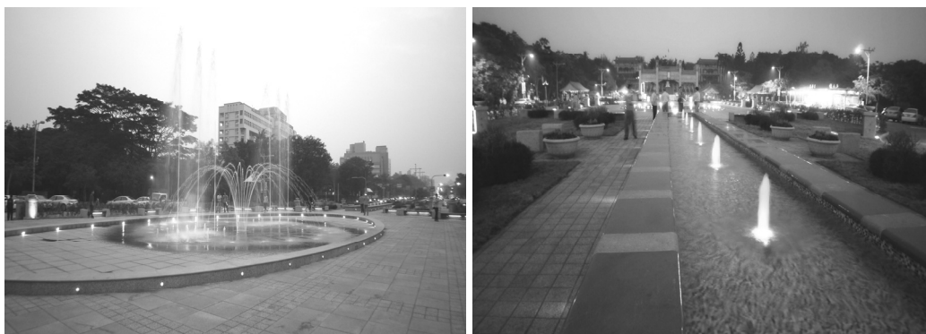
澄清湖風景區入口景觀意象重塑

交通部觀光局補助 800 萬元，本府編列 800 萬元，進行入口區地坪、中央廣場景觀設施、停車場改善、環境綠美化等整建工程，重塑澄清湖入口整體景觀，再造澄清湖觀光美名。