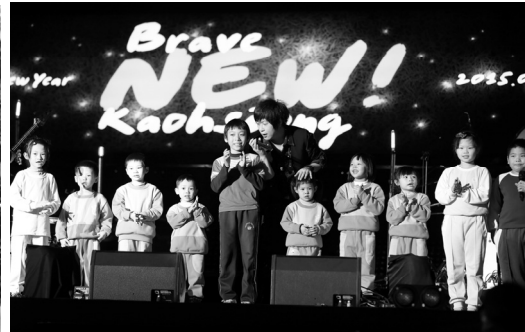
2015 高雄「New! 再創新高」活動