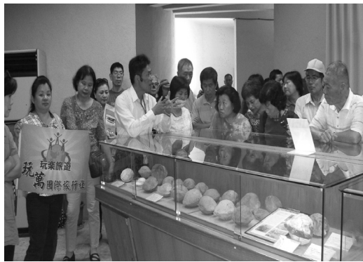
遊客至甲仙化石館參觀