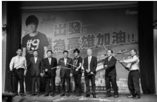
「高雄遊·高雄加油」振興觀光產業行銷活動