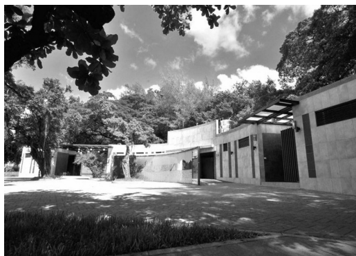
蓮池潭優質觀光公廁