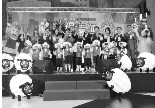
2015 高雄燈會藝術節開幕煙火活動盛況