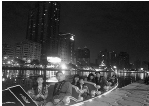
遊客搭乘貢多拉船浪漫遊河