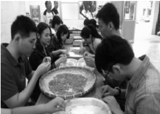
甲仙工作假期旅人挑選辨識仙豆咖啡