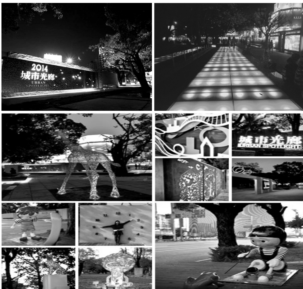
城市光廊整建暨景觀藝術創作

爭取交通部觀光局補助 2,000 萬元，配合本府編列 2,450 萬元，於 103 年 12 月完成城市光廊全段，緊臨中華路、五福路及中山路之間的帶狀空間環境改善，包括人行動線、服務中心改善、活動廣場、照明設備、街道家具及植栽綠美化等工程及主題景觀藝術創作，重塑港都河港新風情，增加夜間魅力景點，提升水岸城市之觀光吸引力，帶動五福商圈觀光經濟。