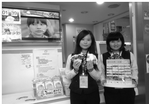
親切友善的旅遊服務