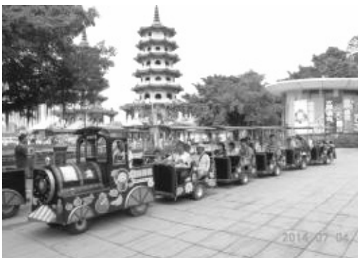
遊客搭乘小火車環遊蓮池潭

為重現左營蓮池潭地區早年遍植菱角的盛況，並促進蓮池潭周邊的環境生物與景觀的多樣性，特於蓮池潭畔闢設菱角生態池，成功復育菱角，並與旅行社合作規劃蓮池潭一日採菱體驗趣遊程，自 103 年 11 月 16 日至 12 月 11 日每週日出團，計約 200 人次參與體驗，另搭配專業導遊之帶領，以騎自行車方式慢遊深入探訪孔廟、舊城古蹟、春秋閣、龍虎塔、洲仔濕地等景點，活動內容頗受好評，104 年將賡續擴大辦理。