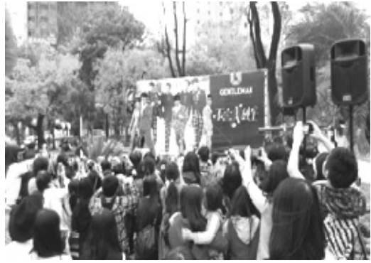
城市光廊委外營運吸引人潮