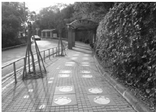
壽山風景區觀景人行步道改善