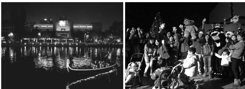
璀璨愛河光雕藝術展演活動