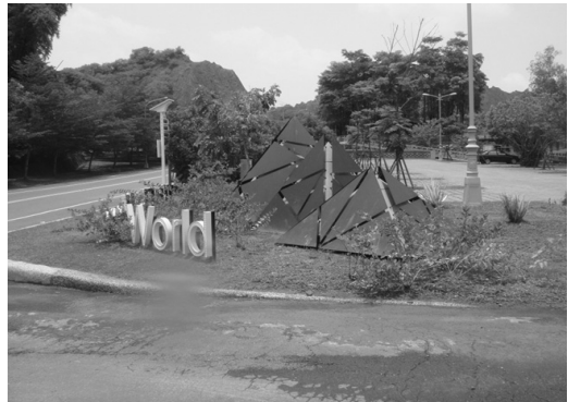
自然地景風景點整體建設