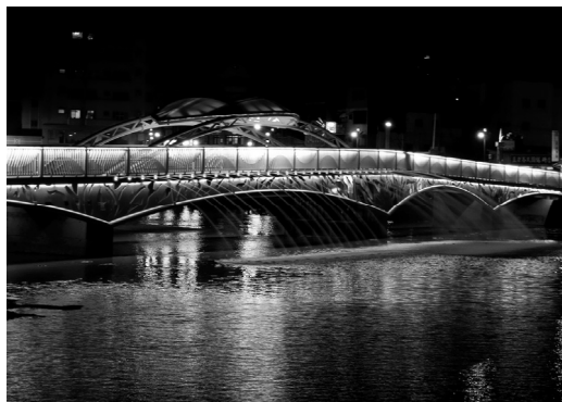
金獅湖風景區觀光亮點整建

區金獅橋新建、木棧橋整建及環境綠美化，於 103 年 11 月完工，拆除危橋，新建美輪美奐之金獅橋，強化設施安全性，提升金獅湖風景區整體景觀。