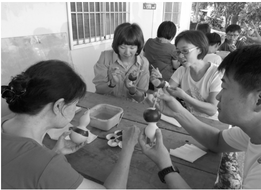
遊客 DIY 親自體驗畫葫趣

為促進高雄市重建區觀光產業迅速復甦，觀光局自 101 年 4 月即開始推動「獎勵旅行社開發本市重建區套裝行程計劃」，本計畫是鼓勵合法旅行業者組團至重建區一如甲仙、杉林、茂林、桃源、六龜、那瑪夏等區觀光旅遊，補助每位團員餐費新台幣 150 元，至今（103）年 12 月為止，全國北、中、南 50 餘家旅行社共組 434 團，超過 29,177 人次參與體驗並力挺風災後的高雄市重建區觀光旅遊，已為當地帶來近 2 千 4 百餘萬元的觀光產值。