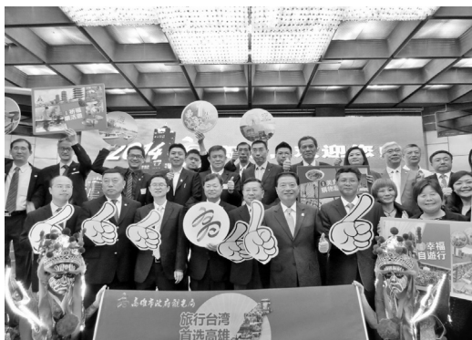
於北京辦理高雄觀光推廣會 2.參與國內旅展

103年8月結合本市觀光業者參加馬來西亞國際旅遊展，行銷高雄觀光資源，開拓東南亞市場。