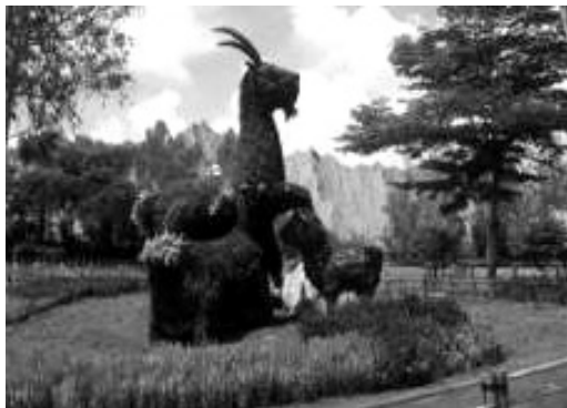
田寮月世界立體主題植栽

花卉營造「喜氣洋洋」之熱鬧、活潑氛圍形塑旅遊景點主題意象，使前來遊憩之遊客感染喜悅心情。