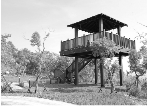
小崗山觀光遊憩設施改善

亭觀景台等工程，於 103 年 11 月完工，配合市府「阿公店水庫及阿公店溪未來發展」計畫，整體提升該區整體遊憩環境。