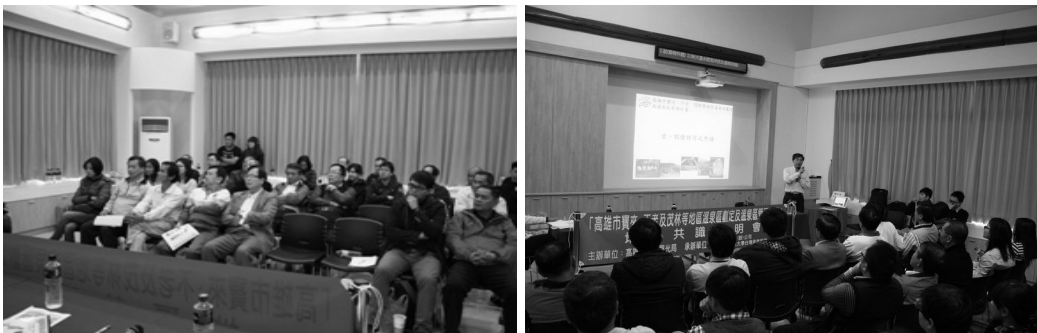
溫泉區管理計畫地方說明會

莫拉克風災後，為評估受災區環境影響及協助輔導寶來、不老溫泉地區旅館及民宿合法化，由本府、中央及專家學者，共同組成專案小組，辦理環境評估及合法化審查作業，目前本專案進度計有 12 家業者通過聯審會議。