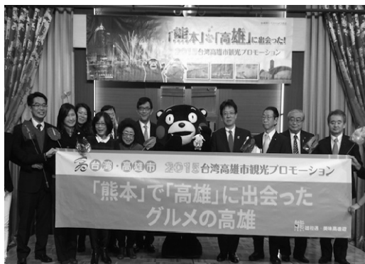
於日本熊本辦理高雄觀光推廣活動