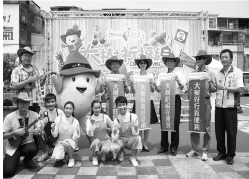
台灣好行大樹祈福線宣傳記者會