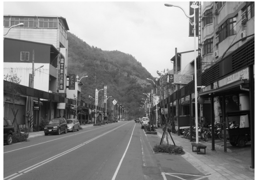
寶來大街新增造型門架