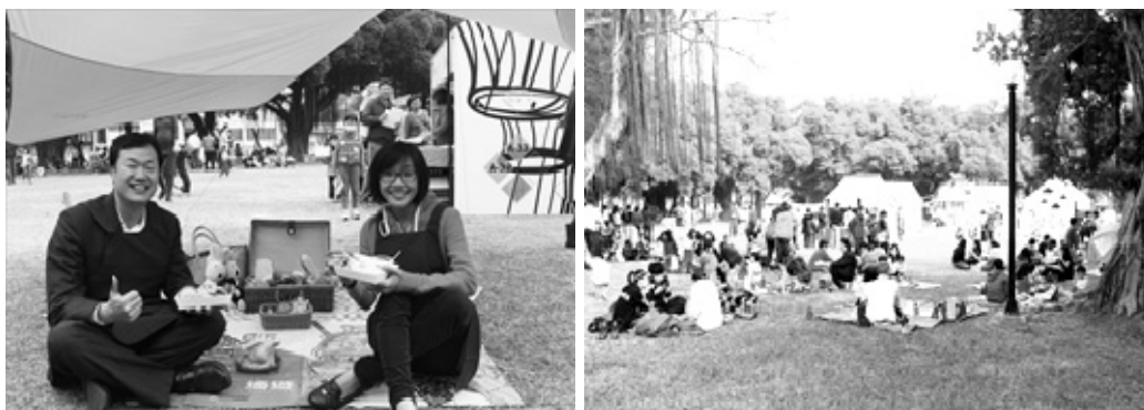
「高雄四季逍遙遊－鳳山野餐趣」活動