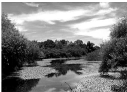
鳥松濕地生態公園

鳥松濕地是臺灣第一座濕地公園，園區生物種類相當豐富，提供鳥類極佳度冬與過境棲息之場所，今年更發現珍貴稀有保育鳥類－「水雉」。本府補助由社團法人高雄市野鳥學會認養，除園區管理維護外，更致力於生態復育及環境教育推廣，並提供免費導覽解說服務。103年11月19日經由高雄高商師生協助將園區內上百種生物種類建置PC版、手機版網站及QR Code連結，提供民眾即時導覽功能。