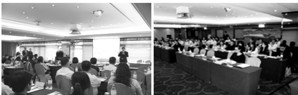
招商說明會吸引眾多業者參加