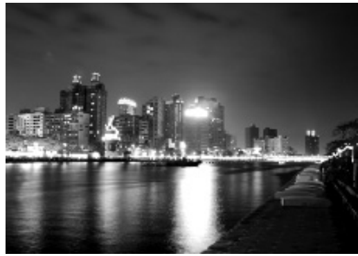
愛河沿岸景觀改造