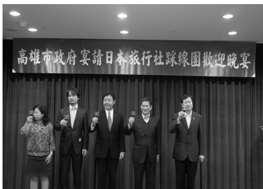
接待日本旅行社百人至高雄踩線

103年10月協助交通部觀光局於高雄展覽館水岸廣場舉辦吳尊「傳遞幸福 高雄港灣浪漫之旅」，吸引眾多粉絲及民衆，有效行銷本市旅遊。