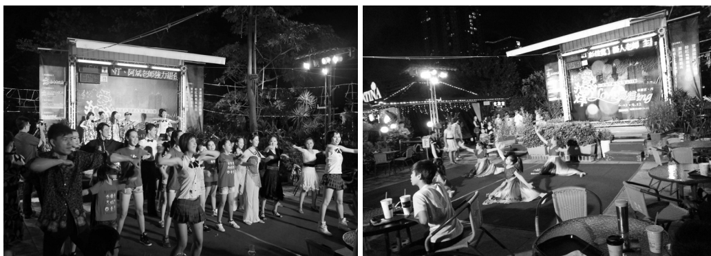
夜間觀光精彩表演活動

輔導業者辦理 103 年度高雄夜間觀光活動，自 103 年 6 月 13 日至 9 月 12 日起每週五、六晚間假黃金愛河名歌廣場，售票演出夜間定目劇「LOVE 高雄 ing」，由專業舞團結合磅礴原民樂舞、客家浪漫傘及台客夜市文化，展演「愛在高雄」系列風情。周邊結合近 20 位街頭藝人表演，整合超過 45 家之餐飲、遊樂、住宿等業者，推出「憑摺頁即贈送」超值優惠，有效吸引遊客參與。