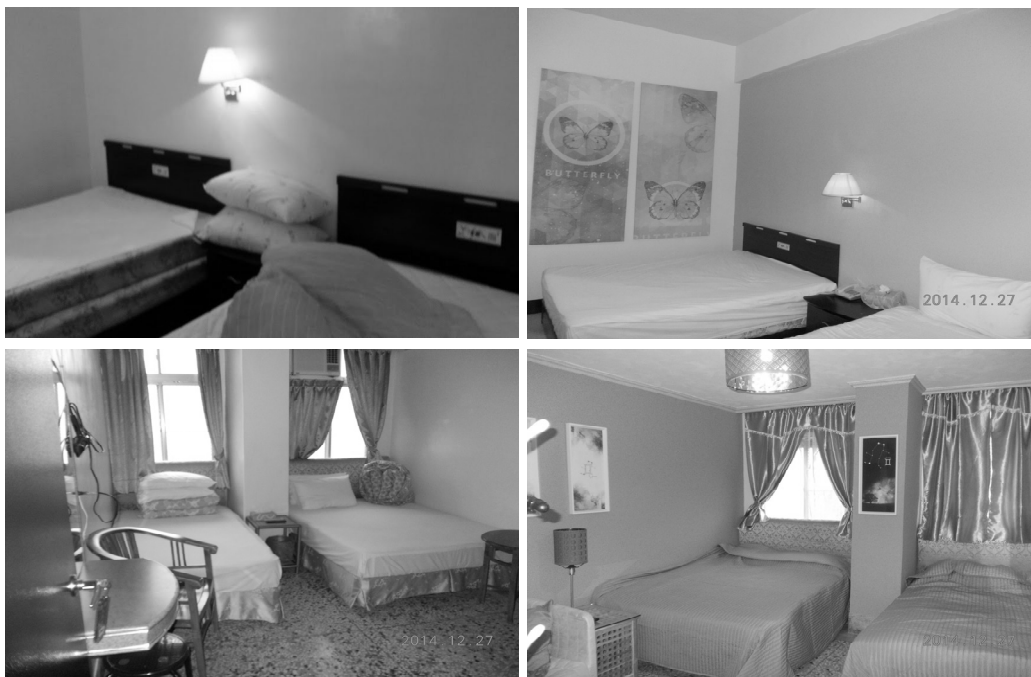
旅館改造前、後成果照片