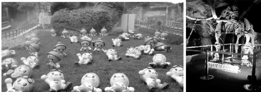
動物園內亮點裝置藝術