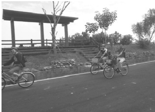
旗美自行車道系統改善