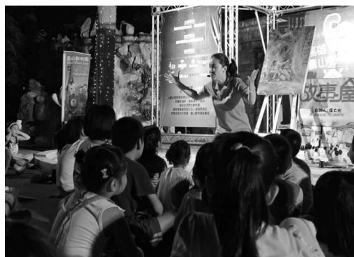
動物園延長夜間開放成爲夜間觀光之特色景點