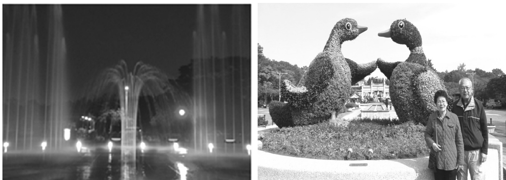
澄清湖風景區入口環境藝術營造