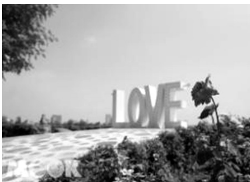
壽山情人觀景台整修綠化

情人觀景台位於壽山絕佳觀景位置，可飽覽本市市區及港灣海景，除建置「LOVE 傳聲筒」裝置藝術及象徵愛情中「追求」、「熱戀」、「連理」不同階段之獼猴造型石雕等設施外，重新鋪設石板步道，擴大行人動線，讓遊客更容易取景拍攝及賞景；另以特色球型七里香及福建茶作為綠籬，並種植具浪漫、濃情蜜意氛圍之玫瑰花，成功打造此地成為情侶約會及婚紗拍攝之首選地點。