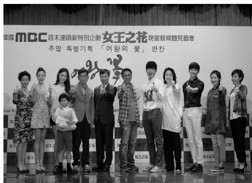
協助韓劇於高雄取景拍攝