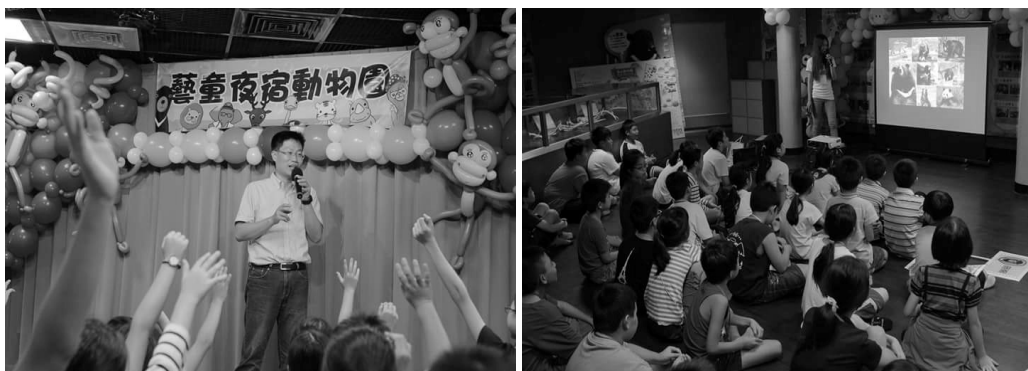
動物園夜宿營活動廣受好評