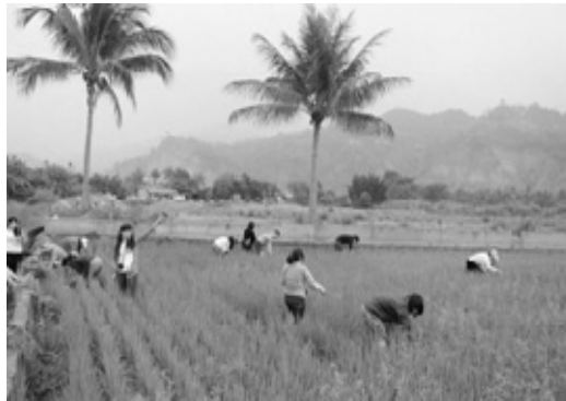
甲仙工作假期旅人參與農務