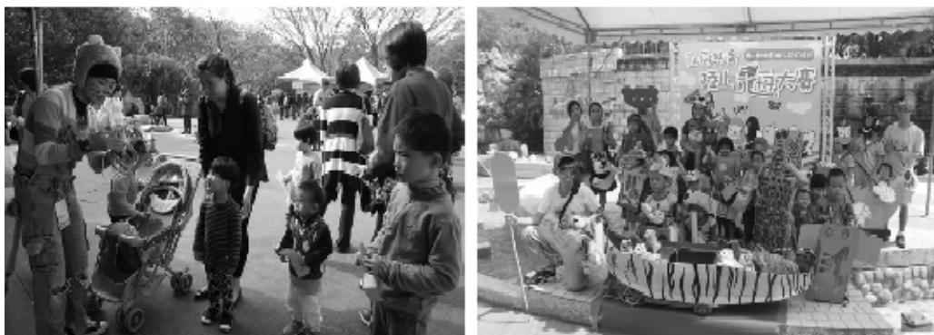
多元化教育行銷推廣活動

持續規劃辦理社教推廣活動，以多元化親子活動增進動物園與民衆互動，進而宣揚愛護動物及保育觀念，並積極行銷動物園。103 年辦理 3 場創意競賽、1 場主題表演活動、2 場童心保育夜宿活動、6 場動物教育宣導活動，共計 12 場，並規劃暑期動物園夜宿活動。