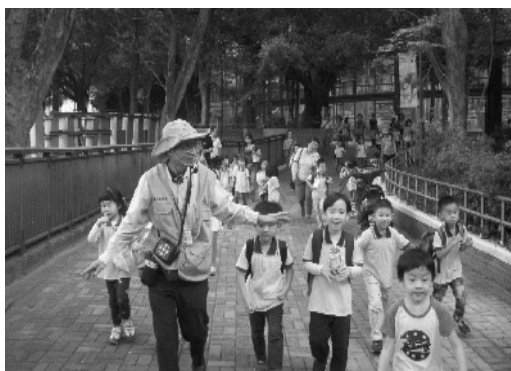
動物園志工帶領遊園小朋友生態解說導覽

動物園廣招志工協助園區導覽解說、廣播協尋、園區巡邏等工作，提升園區公共服務水準及效率。103 年度共計服勤 5,068 人次、15,203 小時，服務本市及外縣市各國民中小學、幼稚園導覽解說教學達 162 團次，導覽團體人數計 10,599 人次。