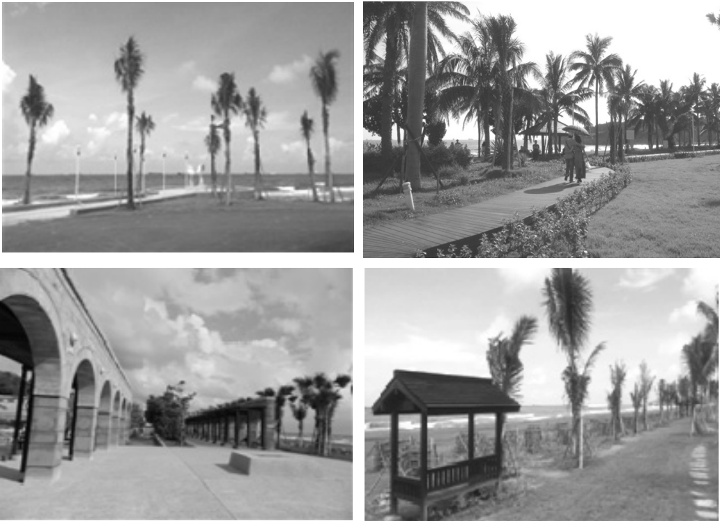
旗津海岸景觀修復整建

③第三期經費 2,000 萬元，延續第二期改造，規劃辦理自海岸林生態區（天聖宮前）—運動休閒區（風車公園）範圍之海岸林生態區新設公廁、觀海平台整建、風車公園設施修繕及濱海植物復育。