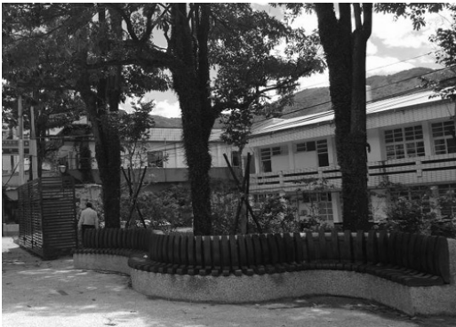
寶來溫泉大街環境改善

交通部觀光局補助 2,480 萬元，於 103 年 4 月完成改善寶來大街街道景觀、新設人行步道、造型門架、路燈及街道家俱等工程。另爭取交通部觀光局茂管處補助 540 萬元，增設寶來大街造型門架，於 103 年 11 月完工，以提升寶來溫泉觀光意象及整體遊憩環境。