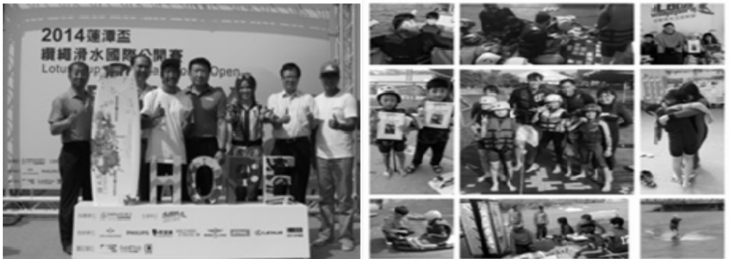
2014 蓮潭盃纜繩滑水國際公開賽