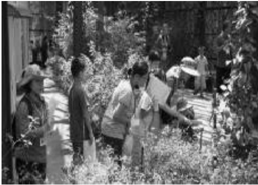
金獅湖蝴蝶園暑期夏令營