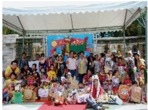
壽山動物園辦理園區教育推廣活動