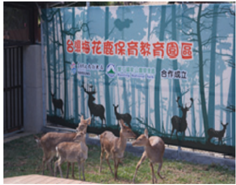
壽山動物園梅花鹿保育教育園區