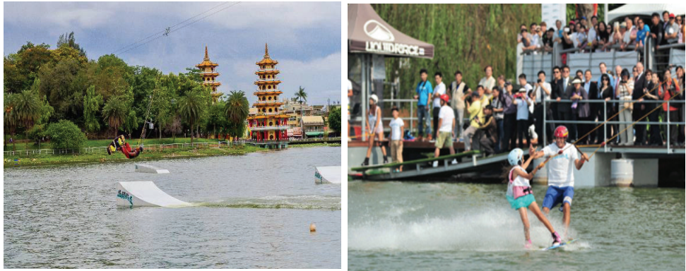
纜繩滑水新鮮刺激吸引遊客體驗