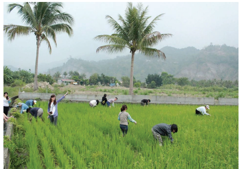
甲仙工作假期旅人參與農務