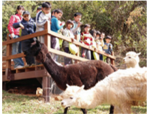
動物園設施關建－羊駝區