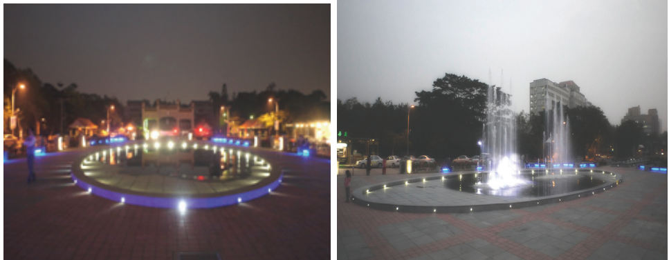
澄清湖風景區入口整建

為改善澄清湖入口景觀意象，本工程編列經費 1,600 萬元，辦理入口區地坪整建、中央廣場景觀設施改善、停車場改善、環境綠美化等，於 103 年 2 月完工。