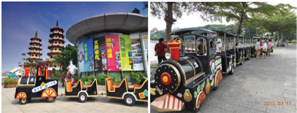
遊客搭乘小火車環繞蓮池潭欣賞美景

本市蓮池潭風景區池畔景色秀麗，除為本市市民休閒遊憩空間，亦是陸客及國內外遊客經常造訪之旅遊景點。本局引入特色遊潭觀光小火車載具，增加遊潭樂趣，吸引民衆同遊。103年1月至6月載客數計約5千人次。