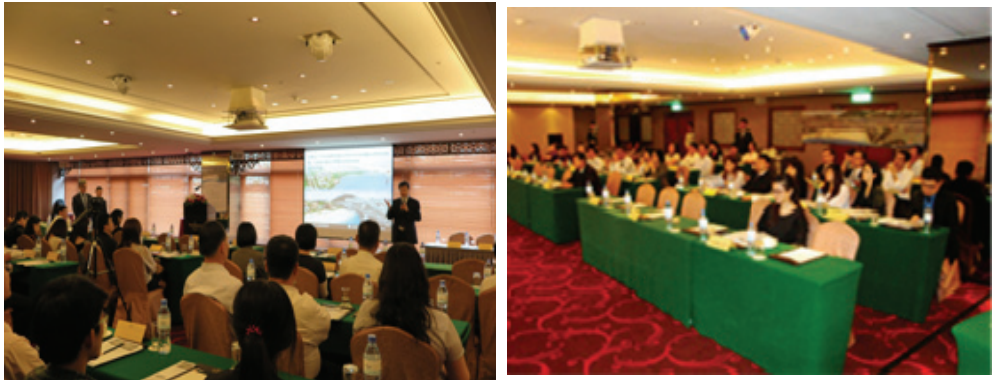
招商說明會吸引眾多業者參加