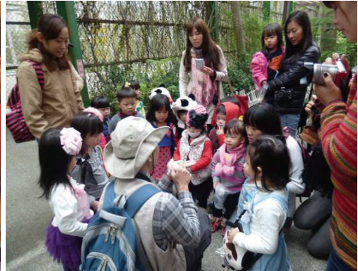
金獅湖蝴蝶園為戶外教學熱門場所