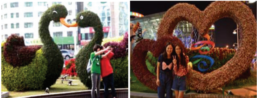
美麗島植栽景觀吸引遊客駐足拍照

為營造節慶歡熱氣氛，於美麗島捷運站及壽山動物園設置大型藝術造景「愛心天鵝」、「快樂頌」與「愛幸虎」。利用立體綠雕、植栽立體創作及燈飾的設計，結合美麗島祈禱與愛情意象，吸引媒體爭相報導及遊客拍照取景的最佳選擇。另動物園大型綠雕「愛幸虎」，巧妙地以生動表情及動作，呈現觀光客開心旅遊的心情，成功勾勒出高雄幸福城市的氛圍。