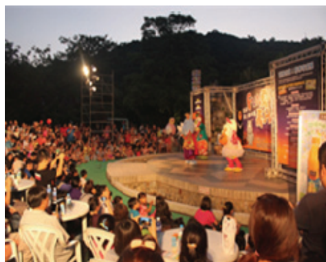
動物園暑期夜間展演活動