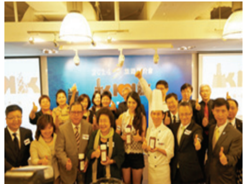
香港旅展高雄推介會