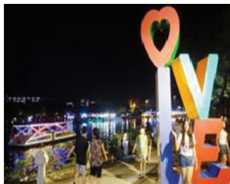
愛河沿岸景觀亮點