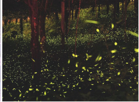
那瑪夏露營生態旅遊活動民衆熱烈參與