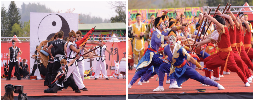
2014 高雄內門宋江陣活動

「2014 高雄內門宋江陣」活動已於 103 年 3 月 8 至 19 日於內門紫竹寺舉行，為期 12 天，活動內容包含全國大專院校創意宋江陣頭大賽、文武陣頭大匯演、總鋪師美食饗宴、遶境祈福等，其中全國大專院校創意宋江陣頭大賽活動，自民國 94 年起至 103 年已連續舉辦 10 年，深獲各界肯定與讚賞，12 天活動期間約吸引 22 萬人次之遊客參觀，創造約 2 億 2 仟萬元經濟效益。