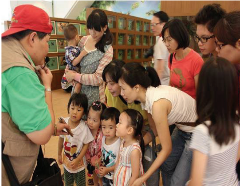
金獅湖蝴蝶園志工熱心導覽解說