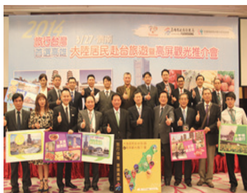
於山東濟南舉辦高屏聯合觀光推介會