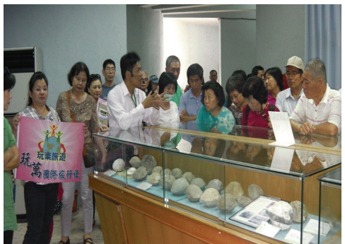
遊客至甲仙化石館參觀