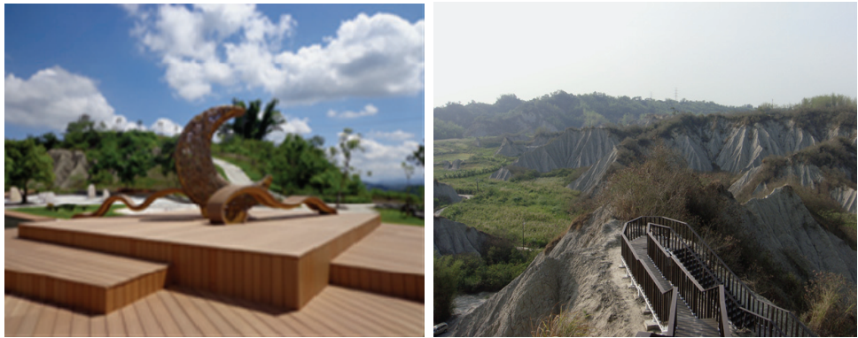
自然地景風景區整體建設