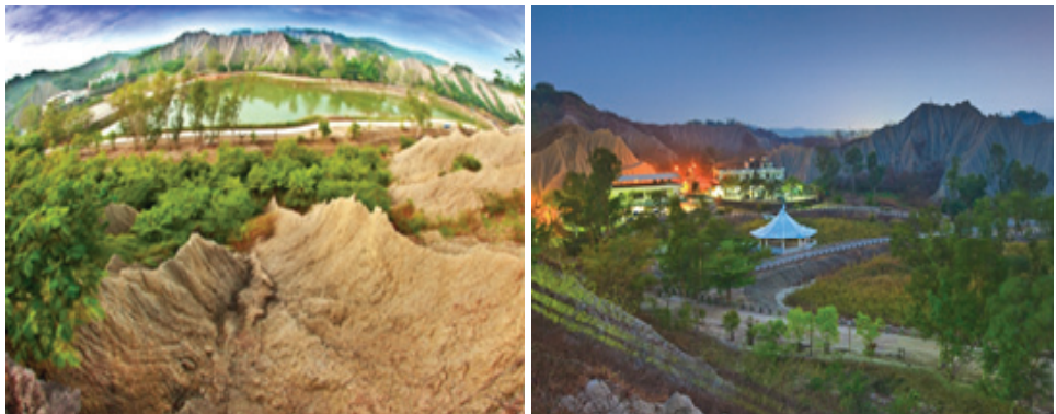
結合資源特色辦理田寮奇幻月世界活動

為凸顯月世界特殊地形地貌，創造地方觀光產業發展，特別設計台灣僅有的惡地光雕，讓遊客彷彿徜徉在月球表面、享受微風、多媒體、音樂、光影結合，營造奇幻美麗的夜間風情，感受闔家聚首的溫馨。活動於 103 年 8 月 9 日起至 103 年 9 月 8 日止為期一個月的假日晚上進行，共計有 4 場主題活動，4 場 3D 光雕投影，以行銷高雄特色觀光，並帶動地方觀光產業發展。