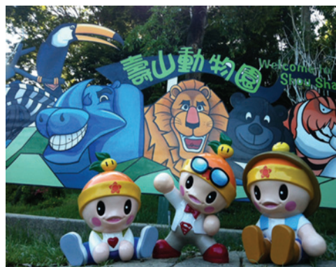
動物園吸睛亮點裝置