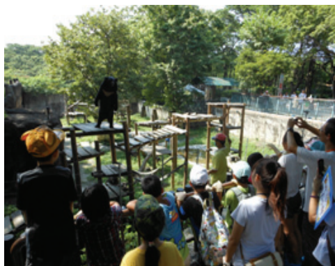
動物園暑期營隊課程活動