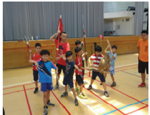
暑期夏令營系列活動民衆反應熱烈