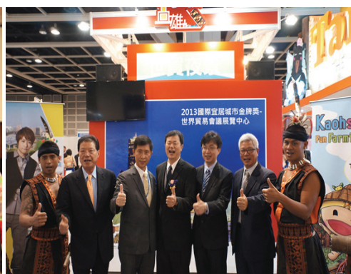
組團參加香港旅展