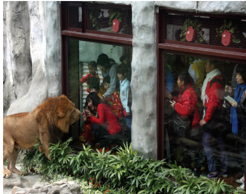
改造參觀介面增加園區設施新亮點