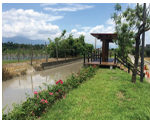
旗山美濃地區自行車道系統改善