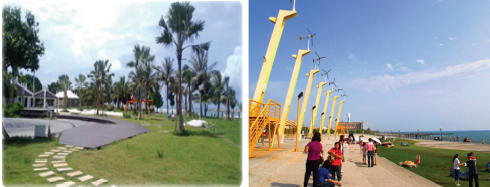
旗津海岸公園修復整建