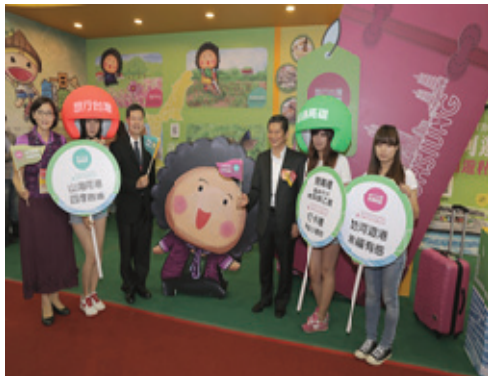
高雄旅展推廣活動

103年5月參加「高雄市2014旅行公會國際旅展」，安排精彩表演及多樣宣傳活動，積極行銷推展本市觀光。