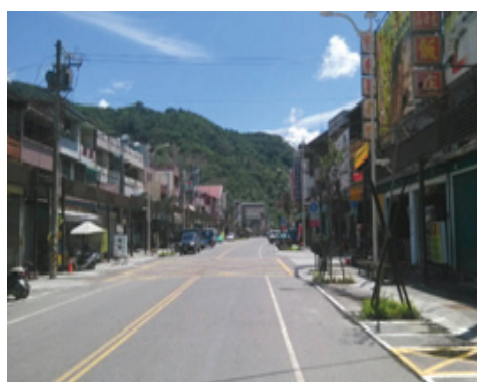
寶來大街環境改善