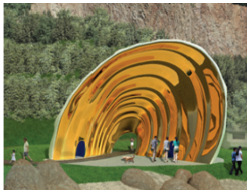
旗津觀光新亮點－「黃金海韻」公共藝術

與港務公司合作建置巨大貝殼造型之「黃金海韻」公共藝術，與旗津貝殼館及海洋相呼應，並透過 6 處聆聽點傾聽浪花聲，期成為旗津旅遊新亮點。