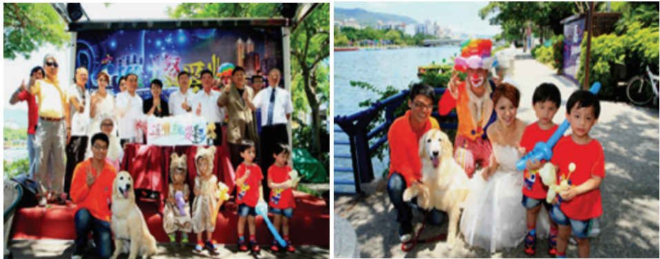
「璀璨愛河」系列活動熱烈開跑

為豐富愛河特色空間氛圍，今年自 7 月開始，為期 5 個月，每月分別以親子才藝、寵物飼主交流、極限活動、創意婚紗、動漫造型等為主題，於愛河邊（國賓飯店旁）舉辦「『幸福童遊趣』雙胞胎造型才藝大賽」、「『幸福毛小孩』寵物奧運會」、「『動能量』3D 極限跑酷賽」、「『LOVE RIVER』華麗創意婚紗秀」及「『萌動漫』親子 COSPLAY 造型賽」等 5 場不同主題活動，提供遊客多樣化的優質休閒活動選擇。