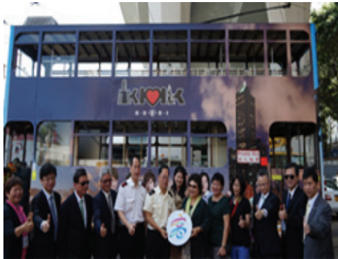
香港叮叮車「高雄車」通車啓用行銷活動