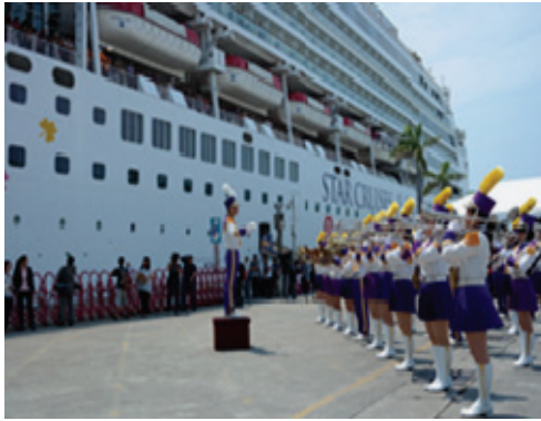
麗星郵輪處女星號首航高雄迎賓活動