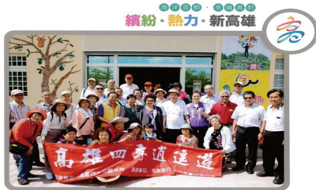
「高雄四季逍遙遊」套裝旅遊活動

條，以遊覽車於交通節點接駁方式頗受樂齡族好評，出團趟次數達 430 趟、遊客人數 15,839 人。