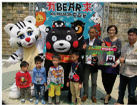
壽山動物園推行動物認養活動

於 103 年 6 月 28 日至 8 月 31 日，每周六、日推出夜間遊園服務，園區延長開放時間至晚上 9 點，規劃辦理多元類型之夜間展演，搭配主題性之特色表演；並安排志工進行導覽解說，帶領民衆於夏季夜間欣賞動物的生態之美。103 年暑期夜間遊園人數截至 7 月底計達 11,388 人次。