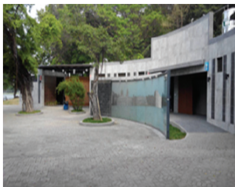
蓮池潭風景區優質觀光公廁