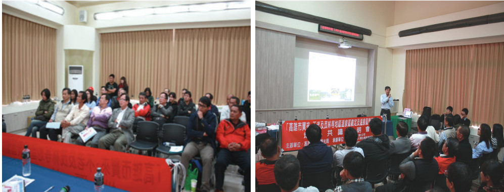
溫泉區管理計畫地方說明會