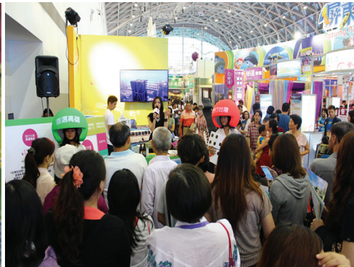
高雄旅展本局展攤參觀人潮熱絡