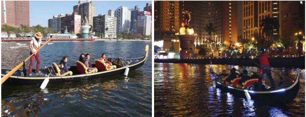
遊客搭乘貢多拉船浪漫遊愛河