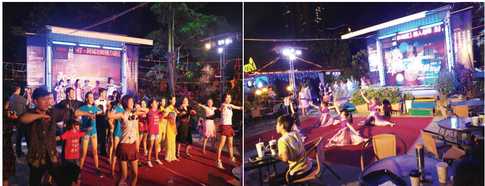
夜間觀光精彩表演活動

辦理 103 年度高雄夜間觀光活動，自本年 6 月 13 日至 9 月 12 日起每週五、六晚間 8 時至 9 時假黃金愛河名歌廣場售票演出夜間定目劇「LOVE 高雄 ing」活動，由祖韻文化樂舞團、蔓鈴國際藝術、京湛國標藝術舞集、粉紅角專業舞團全新編舞，結合磅礴原民樂舞、客家浪漫紙傘及台客夜市文化，展現出「愛在高雄」的一系列表演。周邊亦有近 20 位街頭藝人設攤表演，配合活動整合 45 間以上餐飲、遊樂、住宿等業者，推出「憑摺頁即贈送」超值優惠。