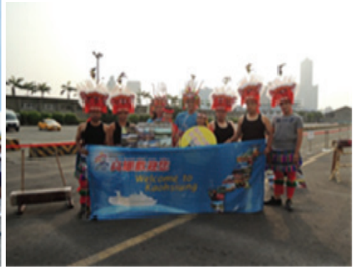
迎接鑽石公主號在地文化表演活動