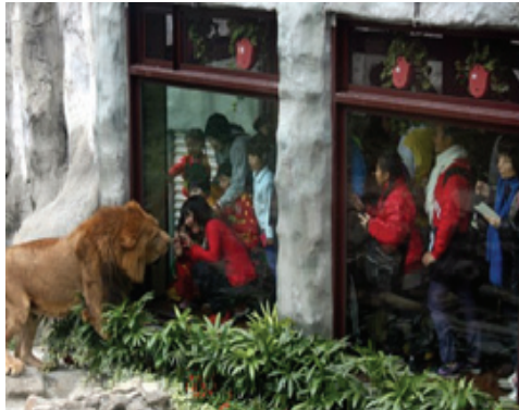
壽山動物園設施整建－獅園

為擴充壽山動物園服務設施，建立以生物多樣性為主之環境教育場域，本工程編列經費 2,000 萬元，辦理新關鹿園及羊駝展示區、現有展示區（獅園、兒童牧場、鳥園及猩猩區）整建等，已於 103 年 1 月 3 日完工。