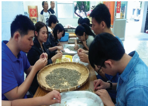
甲仙工作假期旅人挑選辨識仙豆咖啡

本局與甲仙愛鄉協會、商圈組織，辦理社區產業觀光輔導團，約有 11 家甲仙在地商家、社區發展協會受惠，共同投入學習經營及規劃小旅行操作；另推動 6 天 5 夜的青年工作假期，經篩選出 10 位具有設計、社造與行銷專業的年輕人（包含 1 名香港藝術家）付費參與，活絡甲仙高齡化、人口外流的平埔族聚落，建立未來年輕人參與的運作模式；並以甲仙為核心，串起那瑪夏、寶來推出 4 梯次兩天一夜的「甲仙南橫小旅行」，帶動甲仙的深度旅遊。