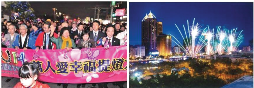
2014 高雄燈會藝術節活動

高雄燈會為本市重要的指標性觀光節慶活動，每年均吸引大批參觀人潮。「2014 高雄燈會藝術節」活動於 103 年 1 月 28 日至 2 月 23 日舉行，為期 27 天，以不同的風貌展現出炫麗、現代、時尚、科技，充滿繽紛亮麗的燈飾於高雄市鬧區街道上，使參與者享受高雄的便利交通、品嚐高雄的地方美食。今年燈會煙火重返愛河水岸施放，吸引國內外遊客前來觀賞，另元宵節適逢西洋情人節，本府特別舉辦萬人提燈大遊行，以及多項創意活動，讓遊客及市民參與，共享歡樂時光，共創美好記憶。