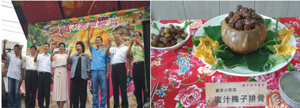
寶來饗宴暨餐飲輔導成果發表

輔導在地餐飲業者作為示範輔導目標，組成顧問團實地造訪店家，協助店家改善經營管理模式與空間改造等，並分攤店家空間改造費用，以提升觀光地區餐飲服務品質。並以宴席方式辦理寶來饗宴，吸引逾 200 位民眾前往寶來共享美食。