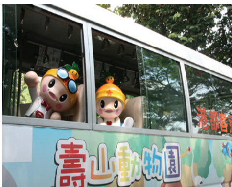
動物園結合大眾運具創意行銷