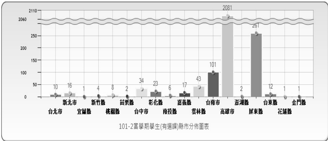
圖二：101-2 學期學生居住地（含新生與舊生）分佈圖