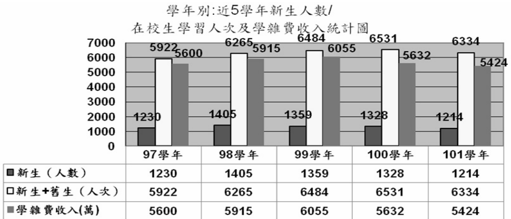
圖四：本校近 5 學年（新生人數/在校學習人次/收入）統計圖

面臨國內教育環境變化，大學擴增、高等教育普及，加上少子化影響，各大學院校確實面臨學生來源逐年減少壓力。根據近 3 年本校新生人數、在校學生學習人次、總選課學分數、學雜費收入等面向檢討（如圖四），本校在校學習人次（含新生和舊生）仍維持每年有 6,300 人次在校修讀課程，但新生註冊人數有減少情形，顯然登記入學本校學生，不再以取得大學學位為主，僅為體現終身學習或具備第二專長、專業技能、興趣使然，而至本校報名者已有漸增趨勢。