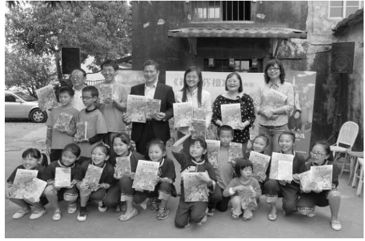
圖 6. 繪本與客語童詩歌謠專輯發表會