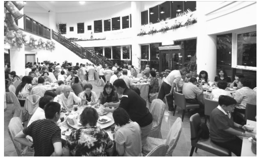
圖 13. 圓樓餐廳現貌