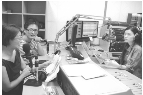
圖 32、「最佳時客」現場直播節目

(二)自 94 年起發行「南方客觀」雙月刊，傳達中央及高高屏客家相關政策與活動訊息，每期發行量為 1 萬 6,500 份，截至 102 年 8 月底止已發行 45 期，有效宣揚高雄在地客家精神。(如圖 33)