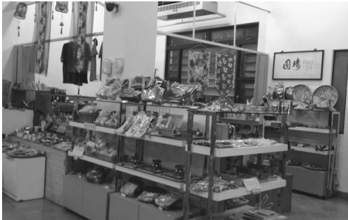
圖 12. 園區手工藝品展售中心