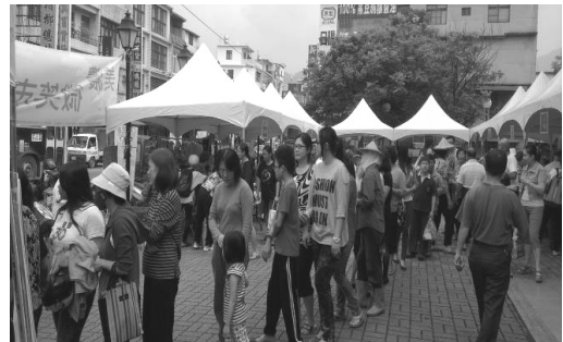
圖 19.故事館前廣場舉辦「美濃微笑市集」