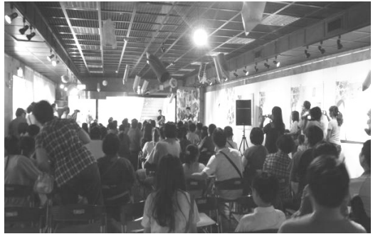
圖 15.「書房想像」開幕茶會暨座談會