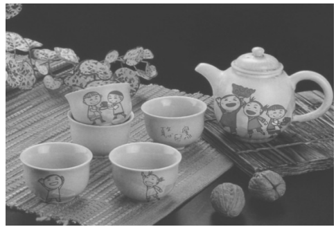
圖 30.陶窯杯組藝術商品