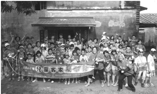
圖 7. 兒童客家夏令營

102年7月20、21日及7月23、24日於美濃及高雄都會區各辦1場次，計119位學生參加，透過教學、參訪、體驗等互動交流方式，引導兒童探索客家的自然與人文環境，領略客家文化之美，進而提升客家認同感，落實客語文化傳承精神。（如圖7、8）