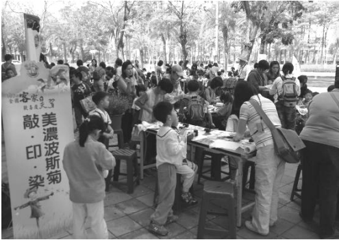
圖 5. 全國客家日—美濃波斯菊敲印染活動