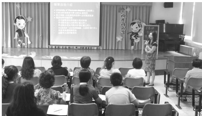
圖 2. 幼教全客語沉浸教學師培課程

分別自 102 年 5 月下旬及 6 月下旬起，針對實施客家雙語教學之國小及幼兒園宣導「全客語沉浸教學」之師資培訓課程。幼教（幼兒園至國小二年級）師資培訓課程於 7 月 20 日開課、初教（國小三至五年級）於 9 月開課，透過每月一次培訓課程，提升教師專業知能，鼓勵老師於授課過程中營造生活化的全客語學習環境，使學童自然而然學會客語。幼教部分計有 18 所國小、幼兒園參加，初教則有 6 所國小參加。（如圖 2）