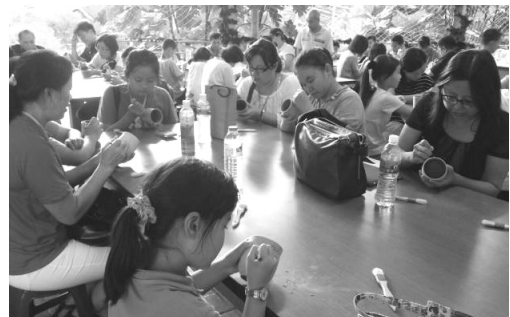
圖 8. 兒童客家夏令營—陶藝製作