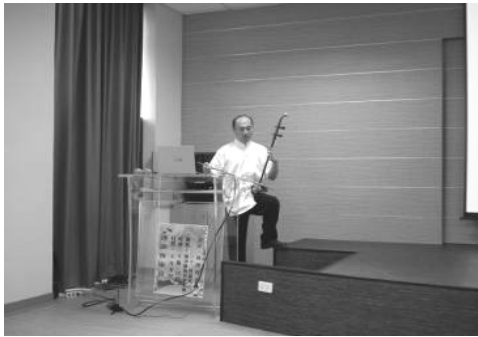
圖 3. 高雄市客家學苑—淺談客家音樂