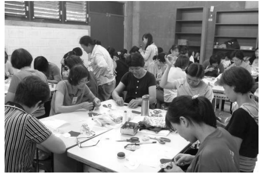
圖 4. 美濃客家學堂—花布創意班