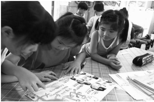
圖 16.窩在故事裡，創作手工書