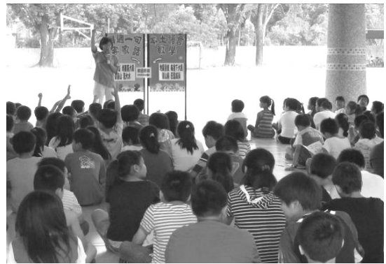
圖 1.國小客語教學上課情形