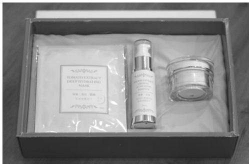
圖 29.美濃蘊玉保養品禮盒