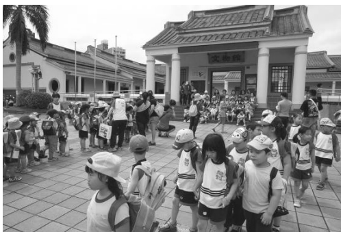
圖 10. 園區文物館已是學校戶外教學平台