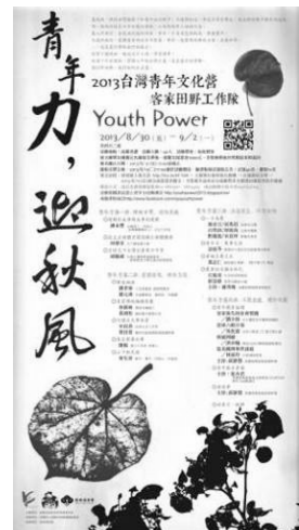
圖 9. 臺灣青年文化營活動海報

102年8月30日至9月2日引領40位來自全台大專院校青年，以農業、生態、文化及青年參與社區營造為主題，規劃一系列生態保育、聚落文化、農村發展、勞動實作等課程，挖掘青年朋友對客庄歷史的記憶並開拓社會視野，建立城鄉良性互動的社會關係。（如圖9）