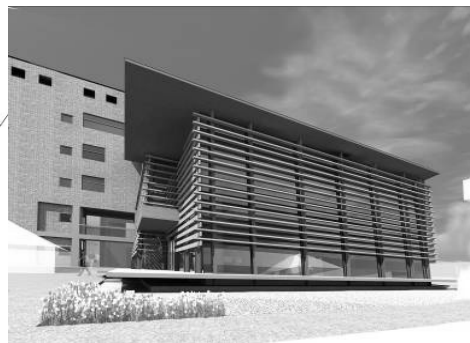
圖 24. 美濃學園-教育藝文館立面圖