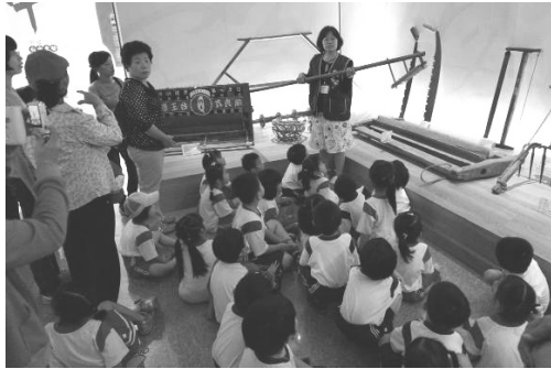
圖 31、志工解說客家文物館之文物

(一)為推廣客家語言文化，讓其他族群更認識客家，與高雄廣播電台合作，每週一下午 4 時 5 分至 40 分，於 FM94.3 播出「最佳時客」現場直播節目，邀請客家優秀年輕一代主持製播，深受民眾好評。(如圖 32)