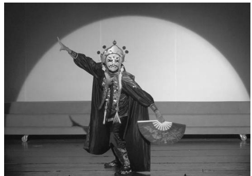
圖 11. 演藝廳節目表演