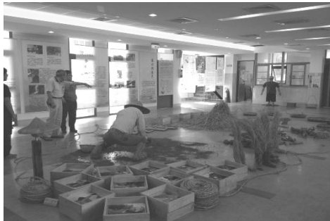
圖 18.情境展示—筆耕笠山下

積極活絡場地使用，1 樓作為遊客服務中心，提供美濃旅遊諮詢服務；2 樓作為展覽場地，開放機關團體申請使用，3-8 月計有「美濃春之頌」攝影比賽展、「農業、農村與農民」寫生比賽展、及情境展示著名作家鍾理和之「筆耕笠山下」展出。4-6 月每周日於故事館前廣場舉辦「美濃微笑市集」，匯集當地特色小吃及有機農特產品，吸引遊客前往選購，增加觀光收益。102 年 1-8 月，約 8,422 人次到訪。(如圖 18-19)