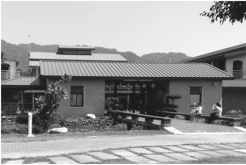
圖 14.美濃客家文物館