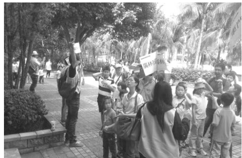
圖 26.「美濃尋寶趣」活動