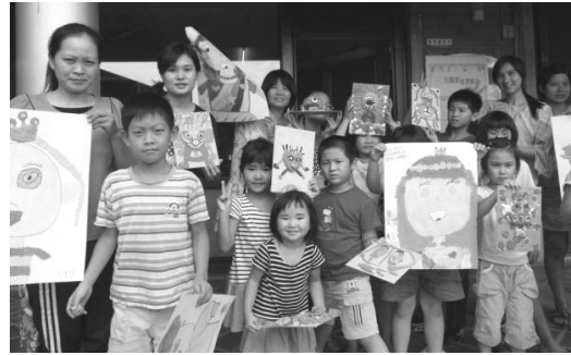
圖 17.親子活動-圖畫書之後美味親子關係