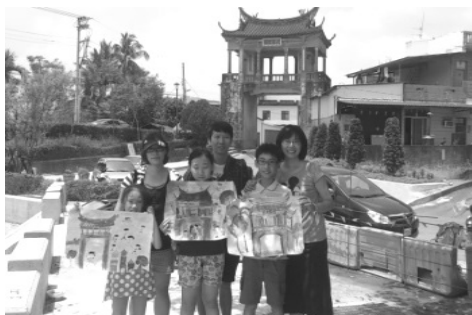
圖 25.「農業、農村與農民」寫生比賽