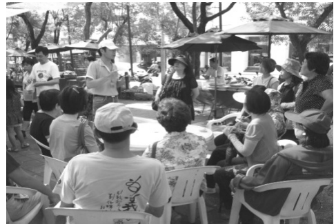
圖 28.微風市集現場觀摩