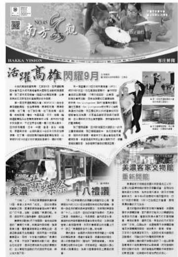
圖 33、第 45 期南方客觀

(二)自 94 年起發行「南方客觀」雙月刊，傳達中央及高高屏客家相關政策與活動訊息，每期發行量為 1 萬 6,500 份，截至 102 年 8 月底止已發行 45 期，有效宣揚高雄在地客家精神。(如圖 33)