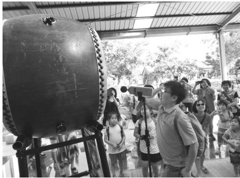
配合父親節舉辦「海克力斯擊鼓分貝賽」