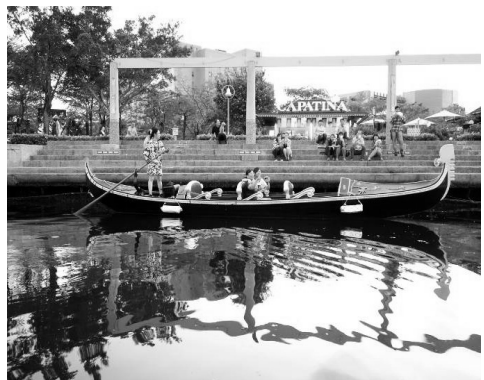
貢多拉船悠游愛河