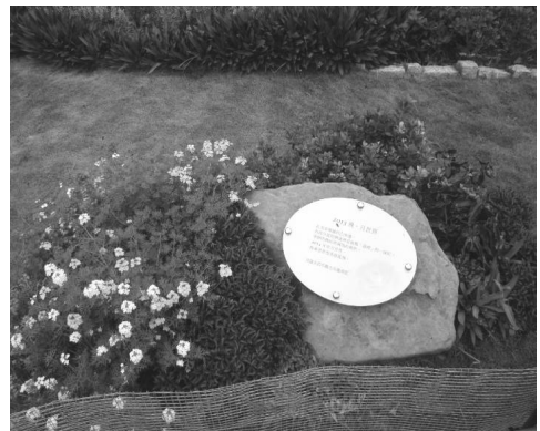
月世界風景區新春花藝造景