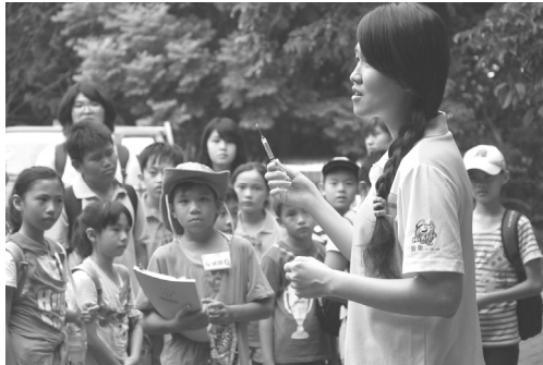
壽山動物園辦理黑熊保育生態講座研習活動