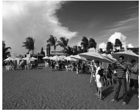
津彩一夏～旗津海灘活動