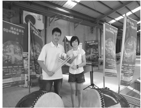
配合情人節舉辦「港都情人篤篤鼓」