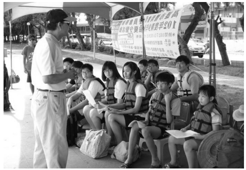
蓮池潭纜繩滑水活動