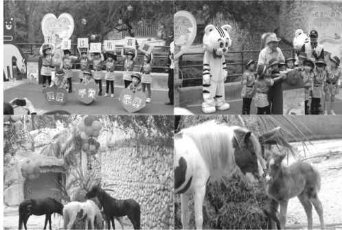
壽山動物園舉辦「媽咪童樂會」母親節慶祝活動

內、茂林、內門等區公所提出建議地點，以及規劃單位自提之建議地點整體評估中，並增列民間投資可行性評估及招商規劃等項目，預定於 102 年年底完成期末報告核定。