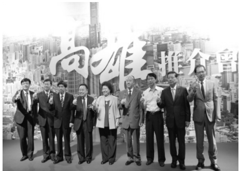
市長親赴天津、廈門及深圳辦理高雄推介會