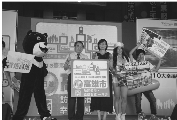
交通部觀光局頒發本市「訪河遊港·幸福有感一日遊」1日遊獎項