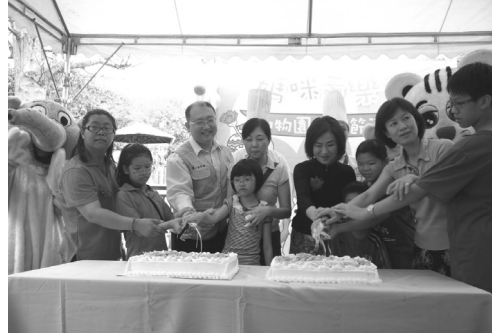
壽山動物園辦理迷你馬寶寶滿月慶祝活動