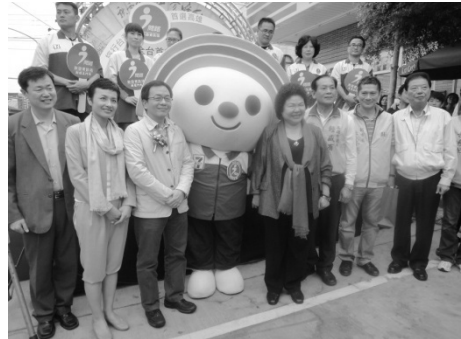
類 I-center 啓用記者會