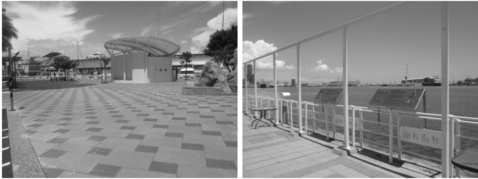
西子灣風景區整建工程