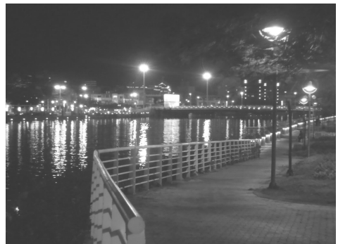
愛河水岸珠璣整建工程