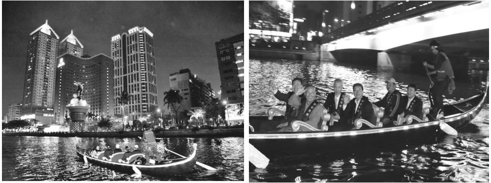
貢多拉船夜間遊愛河