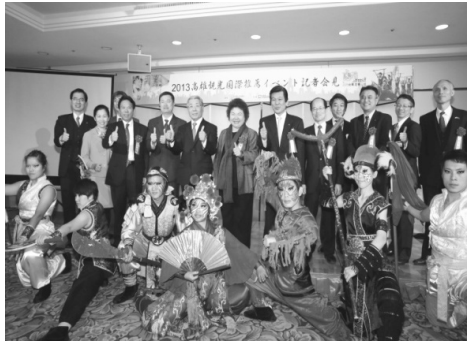
市長帶隊參加日本演演推介會