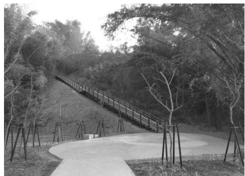
月世界風景區整建工程