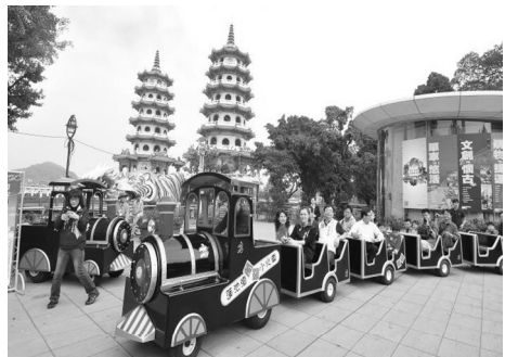
蓮池潭遊潭觀光小火車