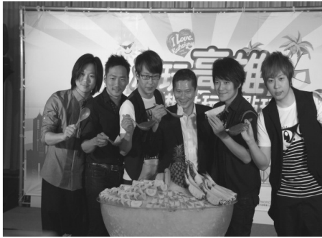
李副市長與城市代言人五月天至香港旅展行銷