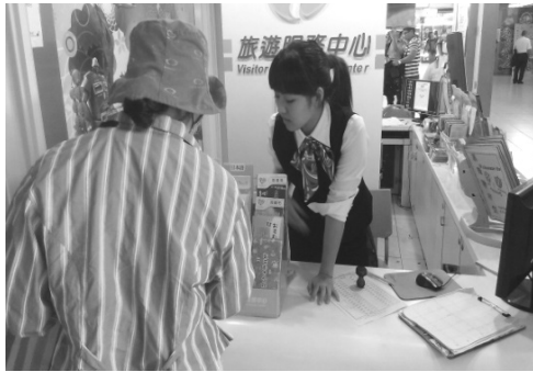
旅服中心提供友善的諮詢服務