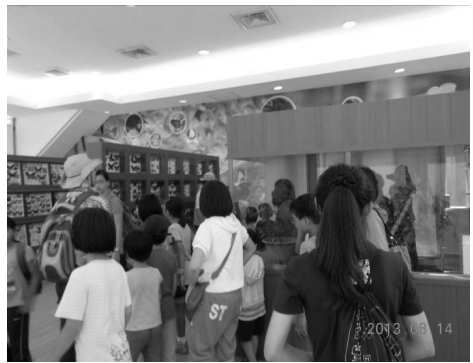
金獅湖蝴蝶園夏令營活動