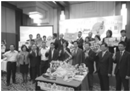
結合觀光業者組團至北京舉辦高雄推介會