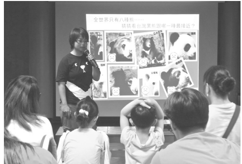
壽山動物園辦理「小小保育員夏令營」活動