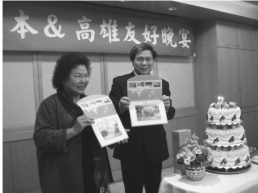
熊本與高雄友好晚宴