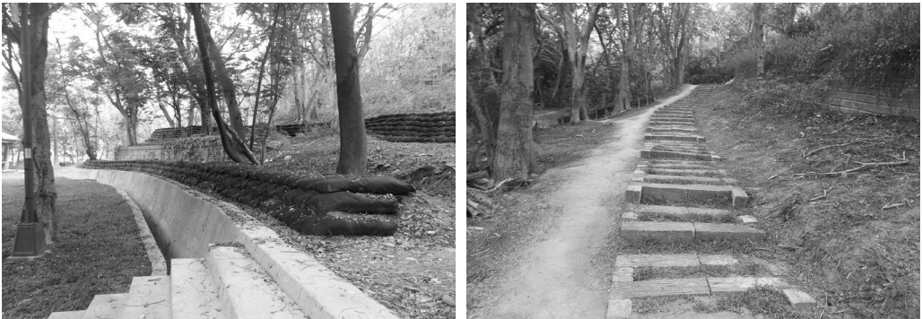
金獅湖滯洪池周邊地景環境改造工程

由內政部營建署補助本局辦理獅山登山步道改善、前山公園整修及改造與環境景觀綠美化等，已於 101 年 12 月 3 日完工，提供民衆便利舒適休憩空間及維護自然生態環境。