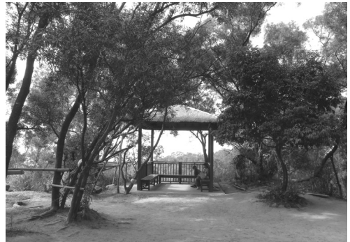
觀音山設施整建工程