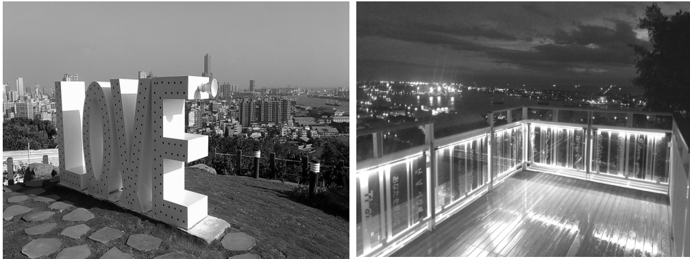
壽山情人觀景台工程