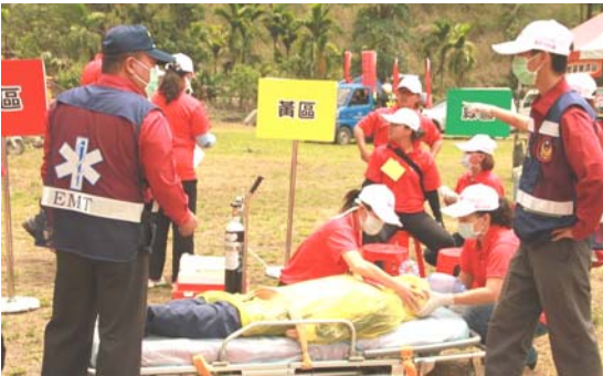
圖九、高雄市茂林區辦理緊急災難事故預防專案計畫—土石流防災演練。