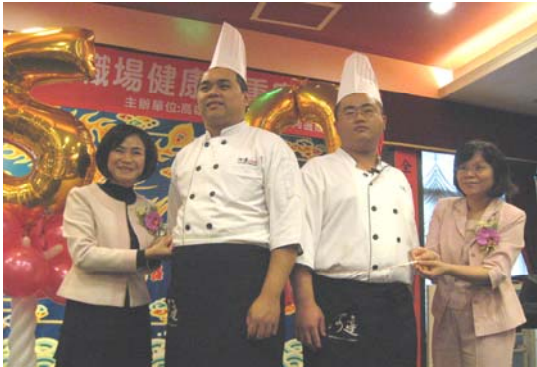
圖十九、推廣健康促進與體重控制