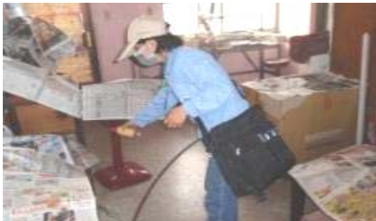
圖三、圖四、登革熱防治—緊急噴藥

透過病媒蚊調查、疫情監測、加強醫師通報、孳生源普查及清除、校園容器減量、衛生教育、緊急噴藥等措施防治本市登革熱疫情。