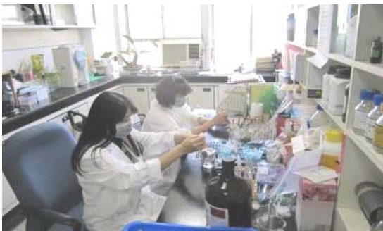
圖二十三、圖二十四、建置優良實驗室