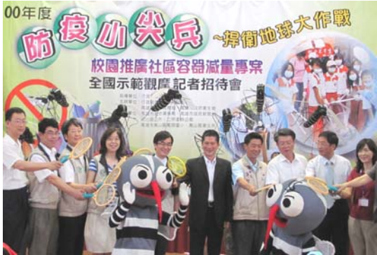
圖一、圖二、登革熱防治—家戶孳生源普查