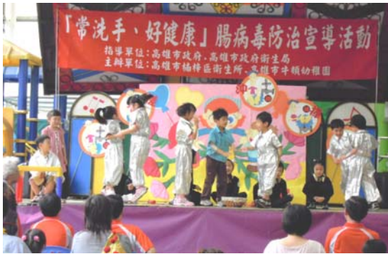
圖七、辦理校園腸病毒衛生教育活動。