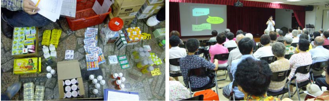
圖十三、圖十四、藥政管理

不定期查緝偽、禁、劣藥物及監錄電視、電台等媒體廣告，並於社區辦理長輩用藥安全講座，以保障市民用藥安全。