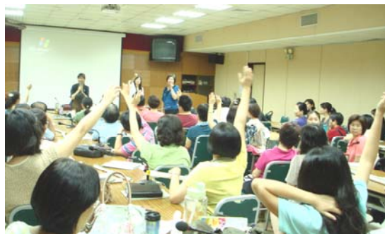
圖十八、衛生保健志工訓練

圖十八、100年至8月辦理衛生保健志工基礎訓練及專業訓練共計6場次，合計約700人參加。