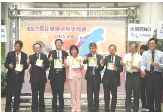
圖二十一、圖二十二、癌症防治

圖二十、辦理「老人健康 100 動起來」競賽活動共 94 組，約 2,589 位長者參加。