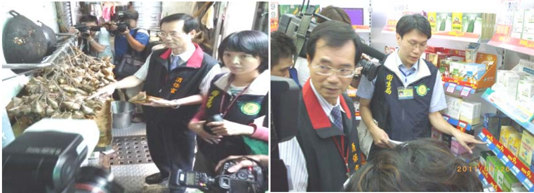
圖十五、圖十六、食品衛生安全管理

不定期查緝偽、禁、劣藥物及監錄電視、電台等媒體廣告，並於社區辦理長輩用藥安全講座，以保障市民用藥安全。