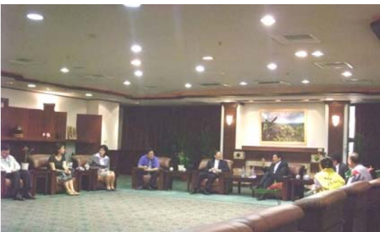
圖十一、圖十二、本府毒品危害防制業務