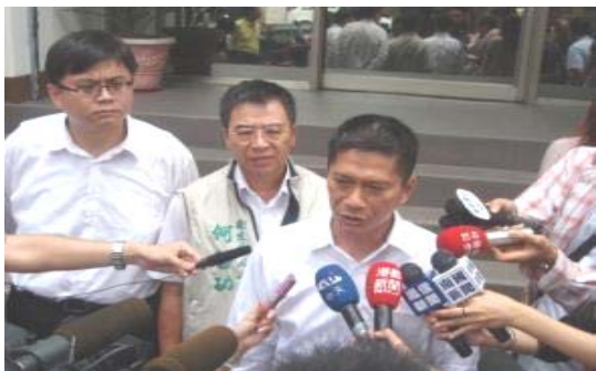
圖五、圖六、登革熱防治—疫情調查及擴大抽血