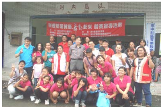
圖十、高雄市桃園區辦理山地地區醫療保健促進計畫及山地地區醫療服務相關工作計畫—部落健康舞動起來活動。