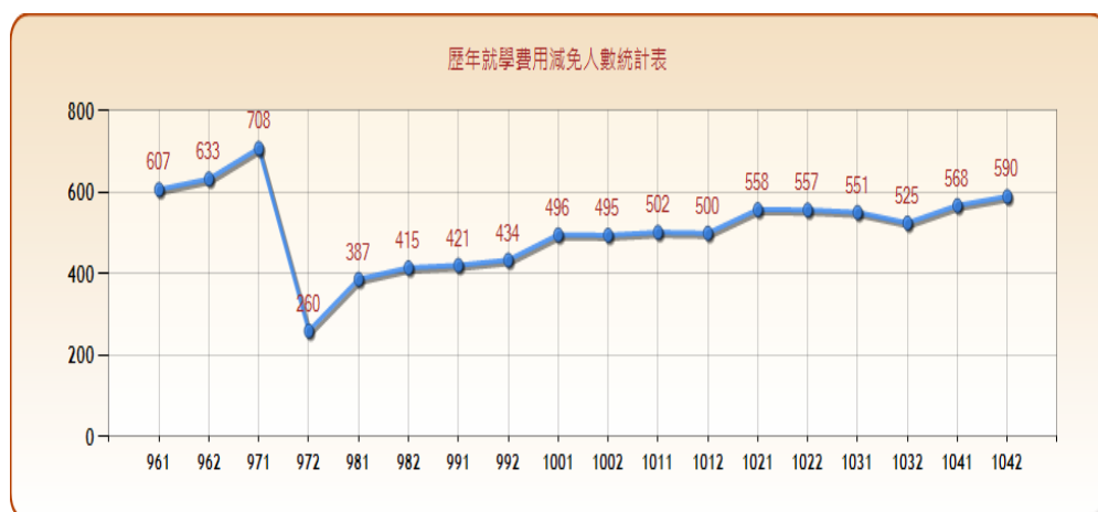
圖一：歷年就學費用減免人數統計表