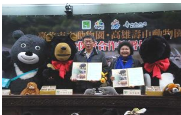
與臺北市立動物園簽署保育合作協議