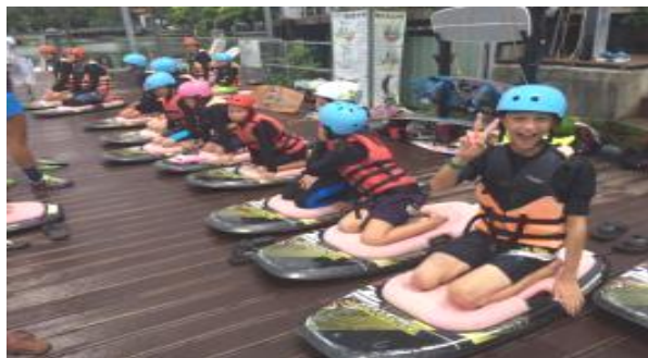
蓮池潭纜繩滑水夏令營