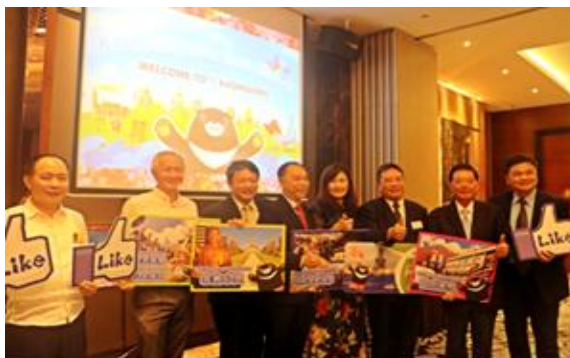
馬來西亞-高雄觀光交流會