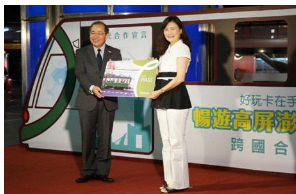
好玩卡與日本江之島電鐵合作記者會