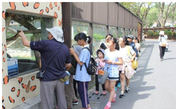
動物園志工導覽解說