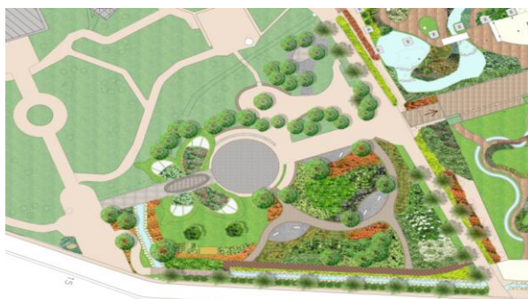
金獅湖風景區整建工程(模擬圖)