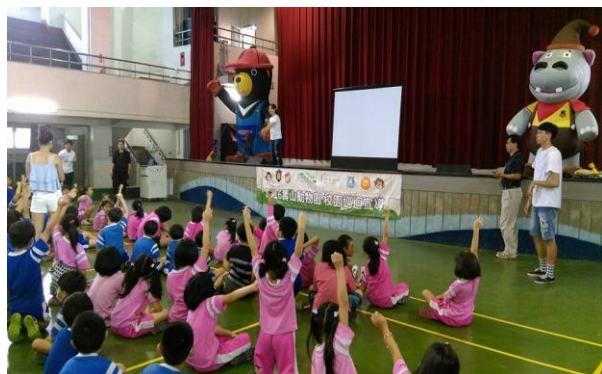
壽山動物園推出生態教育校園巡迴推廣服務