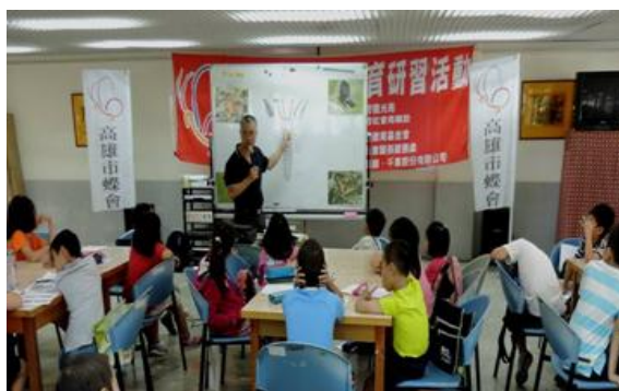
金獅湖蝴蝶園夏令營