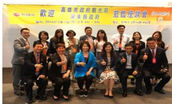
韓國 HANATOUR 旅展-高雄觀光座談會