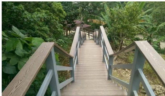
燕巢雞冠山改善工程