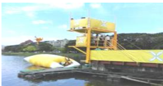
蓮池潭水上彈跳活動