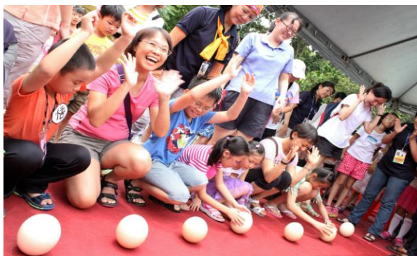
壽山動物園端午節立駝鳥蛋活動