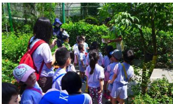
金獅湖蝴蝶園志工提供專業導覽服務