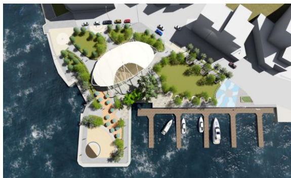
西子灣旅客服務中心新建及周邊環境工程(模擬圖)