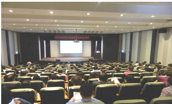
穆斯林友善餐旅認證輔導說明會

因應新南向政策，為開拓穆斯林客源，本市目前已通過認證餐旅有國賓大飯店、翰品酒店及君鴻國際酒店等 3 家旅館，為輔導更多旅館、民宿及餐廳業者建置友善接待環境，本局於本（105）年 8 月 26 日假翰品酒店辦理「高雄市穆斯林友善餐旅認證輔導說明會」，計超過 200 人參加，目前有 8 家業者表示有參與建置意願，將積極協助後續申請認證事宜。