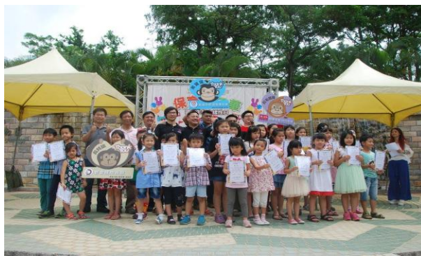
壽山動物園「動物保育嘉年華」活動