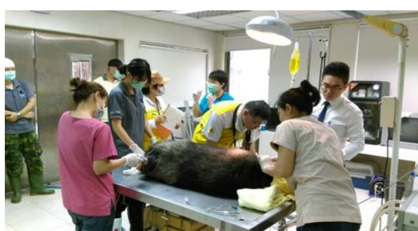
泰國國家動物園派專業獸醫至壽山動物園進行醫療技術交流