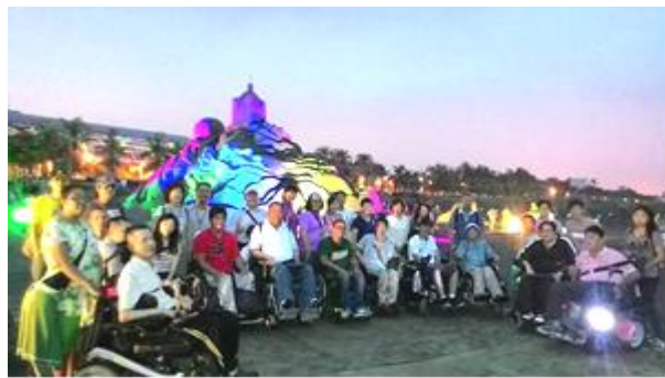
旗津夜間沙雕光雕秀參觀無障礙