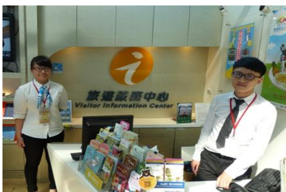
高鐵左營站旅遊服務中心