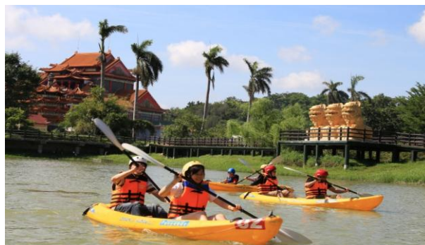
民眾參與體驗水域遊憩活動