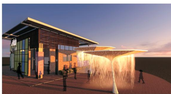
蓮池潭艇庫碼頭公廁整修(模擬圖)