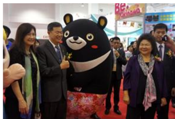
高雄旅行公會高雄國際旅展