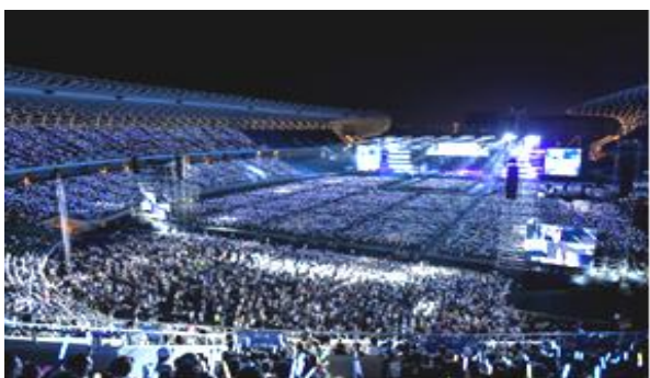
五月天高雄演唱會吸引大量人潮