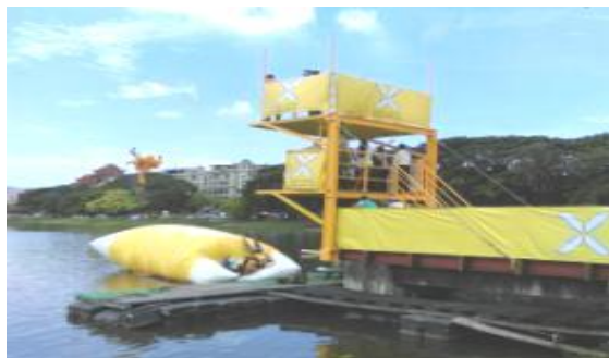
蓮池潭水上彈跳活動