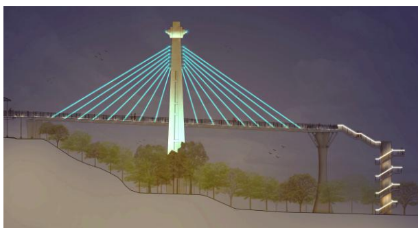
崗山之眼園區整建工程(模擬圖)