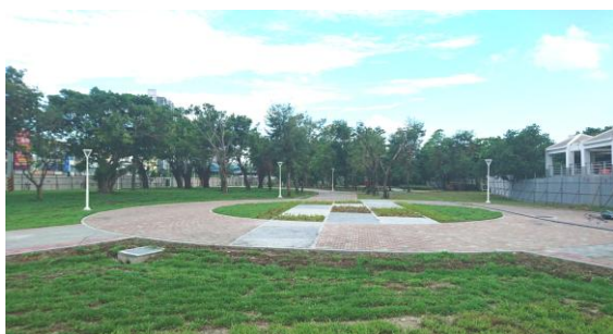
蓮池潭兒童公園改造完成

交通部觀光局補助 1,710 萬元、自償款 150 萬元及本府配合款 1,140 萬元，共計 3,000 萬元，於寶來國中後方台地種植開花喬木，現辦理規劃設計作業中，預定 105 年 12 月完成工程發包。