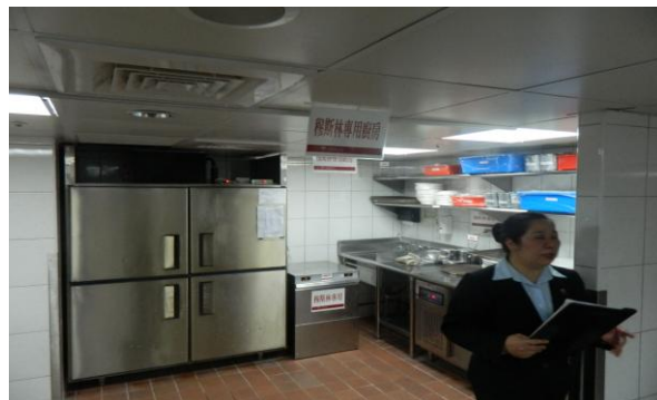
觀摩穆斯林友善餐旅廚房