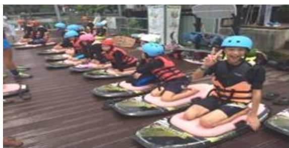
蓮池潭纜繩滑水夏令營