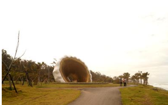
貝殼館周邊新景點-黃金海韻