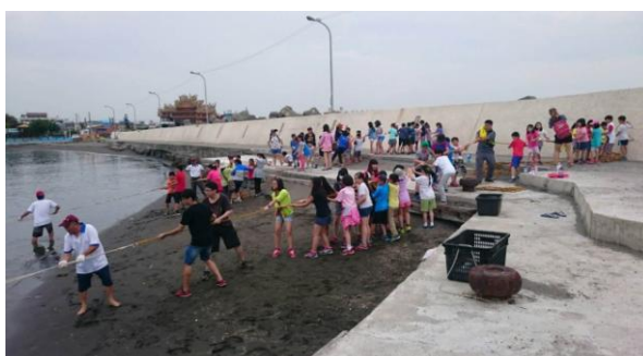
四季逍遙遊-漁村文化之旅