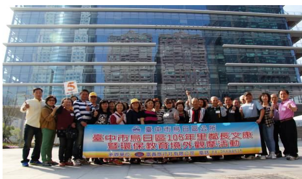
勵旅行業推廣本市旅遊