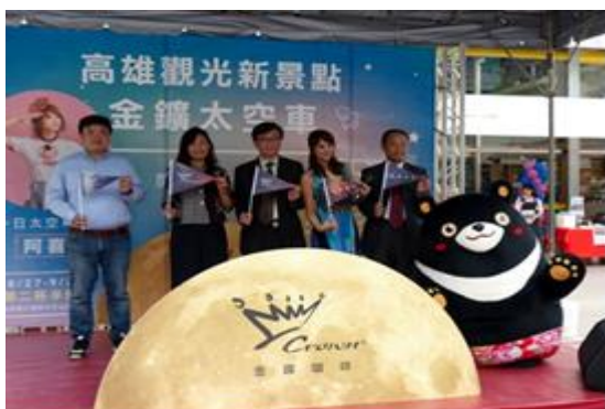
高雄熊積極與授權商品合作結盟