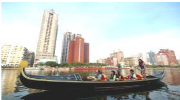
民眾搭乘貢多拉船遊愛河