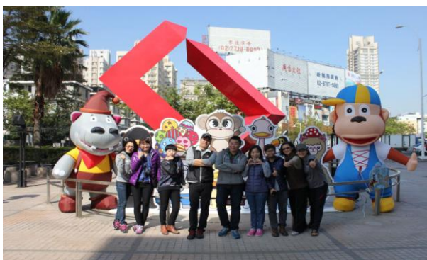
「壽Q家族」裝置藝術展出及參與燈會遊行