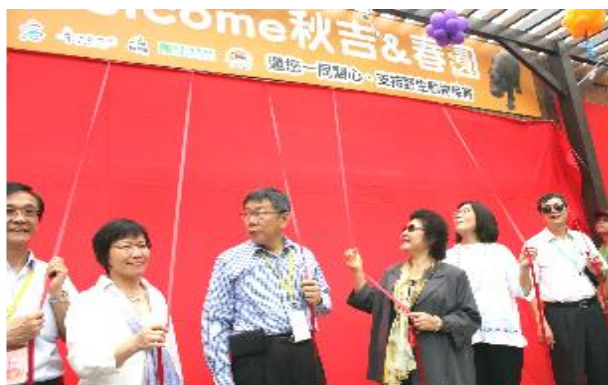
侏儒河馬館揭幕儀式