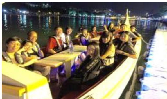
民眾搭乘大型貢多拉船賞遊愛河夜景