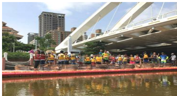
暑期夏令營-自力造舟遊愛河