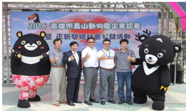
與企業合作辦理動物認養推廣活動