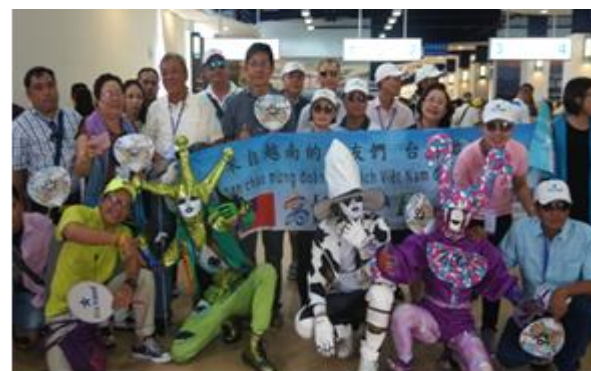
越南郵輪來高迎賓活動