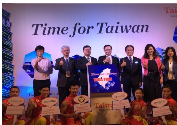
於泰國聯合行銷臺灣觀光記者會