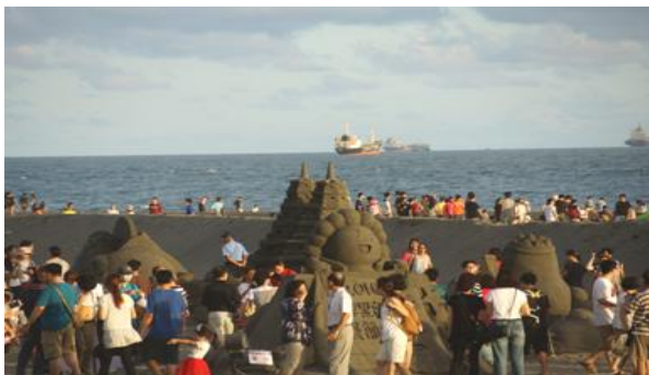
旗津黑沙玩藝節沙雕展