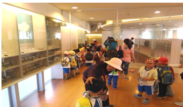
旗津貝殼館志工提供專業導覽服務