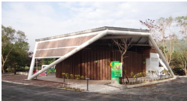
燕巢泥火山多功能服務中心