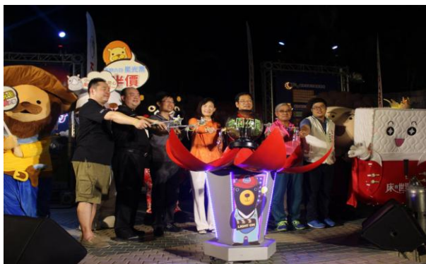
動物園暑期夜間開放