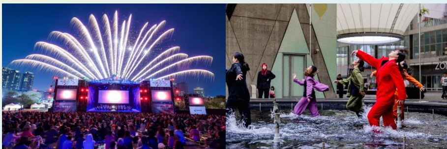
01 高雄春天藝術節 113.2.25-7.14