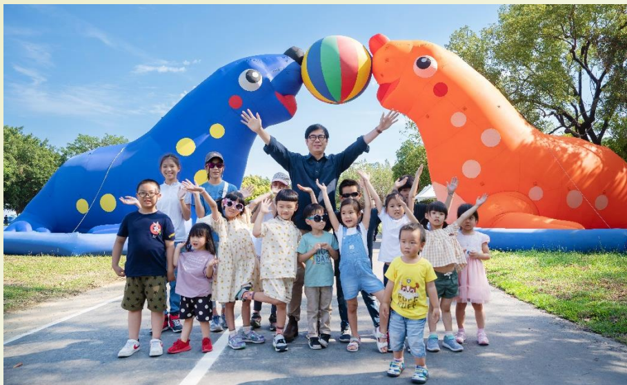
海洋狂想曲 歡樂大冒險 113.4.4-4.7