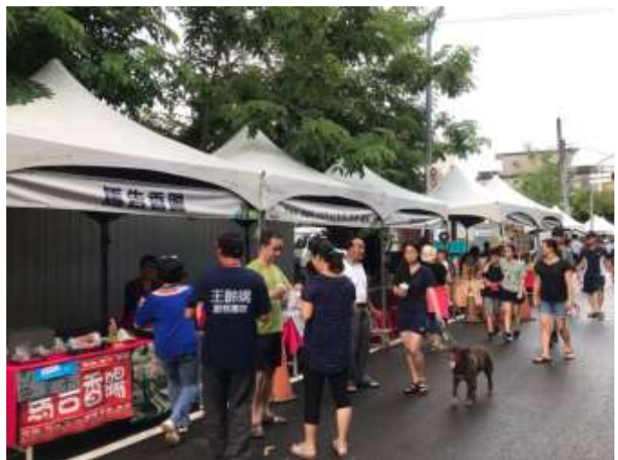
[圖 28] 好客市集

配合 108 年 1 月 1 日「浪漫客庄·富庶美濃」音樂會，及 7 月 27、28 日「田園音樂會」活動，於美濃文創中心及永安路辦理，集結美濃、杉林、六龜、甲仙和原住民特色商品與風味小吃，以及高雄品質優良的農特產品，吸引遊客採買。後續將配合客庄區各項節慶活動如「美濃白玉蘿蔔季」、「杉林瓜果節」、「六龜梅子節」、「甲仙芋筍節」展售特色商品，促進客庄經濟，落實「貨出去、人進來」政策理念。（如圖 28）