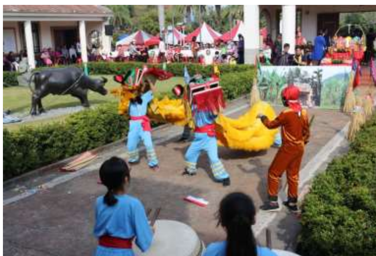
[圖 8] 新春祈福-東門國小客家獅表演

108年2月16日於新客家文化園區文物館辦理「新春祈福暨同樂會」，在傳統客家八音的樂曲中，由市長率客家鄉親以三獻禮儀式，向土地伯公祈求新的一年風調雨順，祭祀完成後並發放開運紅包及客家版食給現場民眾，還有客家小提燈、葉拓團扇、檳榔葉貓頭鷹等多樣親子DIY活動，吸引700位家長跟小朋友參與。(如圖8、9)