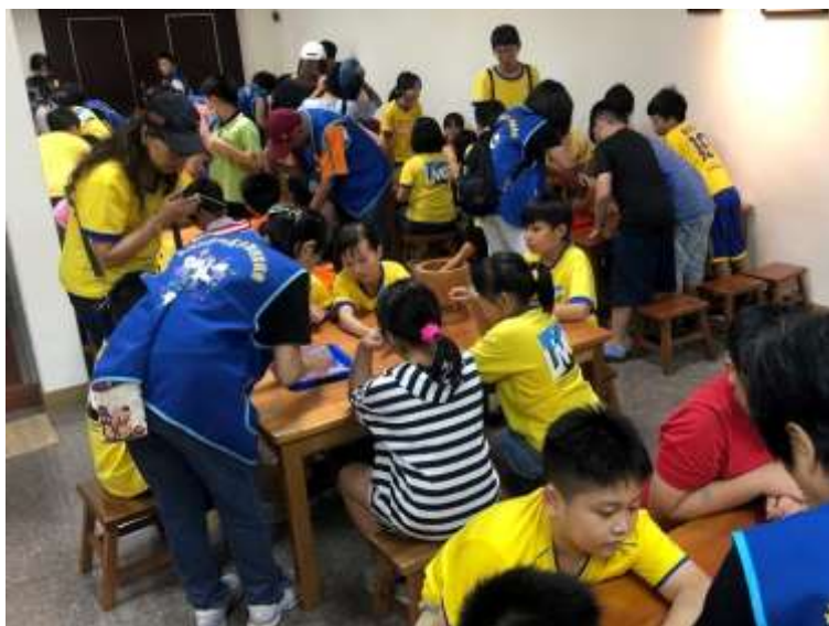
[圖 22] 搗麻糬體驗