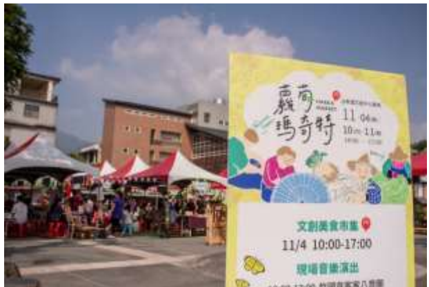
[圖 25] 開庄廣場舉辦蘿蔔瑪奇特市集

藝文活動，有效發揮資源共享場地多元使用功能，更藉由各項多元活動，建構美濃文創中心成為美濃地區的文化據點及核心。(如圖 25)