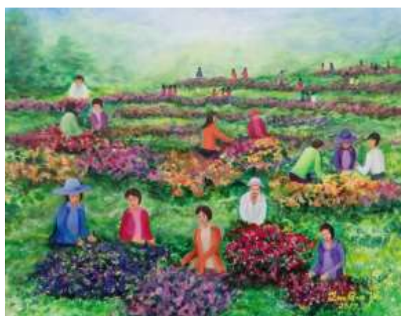
[圖 21] 圓夢畫會作品

108 年 4 月 2 日至 4 月 30 日展出 70 件油彩、水彩、油畫、壓克力等多元藝術創作，題材含括靜物描繪、高雄人文風情景觀，吸引逾 3,812 人次參觀。(如圖 21)