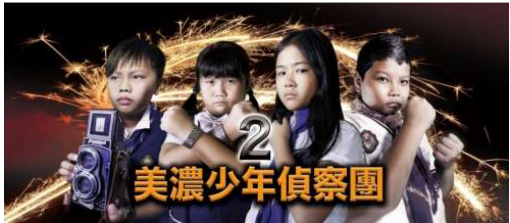
[圖 5] 美濃少年偵察團第 2 集劇照