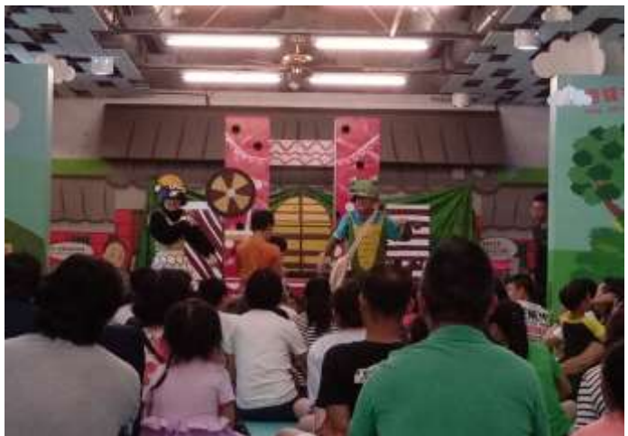
[圖 24] 兒童探索區安排豆子劇團表演