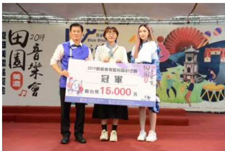
[圖 11] 創意藍衫競賽上衣組冠軍及作品

108 年 3 月 30 日至 6 月 3 日徵求以藍衫為基礎元素進行創意設計，鼓勵民眾及各大專院校學生發揮創意報名參與，計有 71 件作品參賽。初選結果計上衣組 9 件、背心組 8 件、潮 T 組 9 件作品入圍，7 月 27 日於「田園音樂會」活動中以走秀方式舉辦決賽及頒獎。(如圖 11、12)