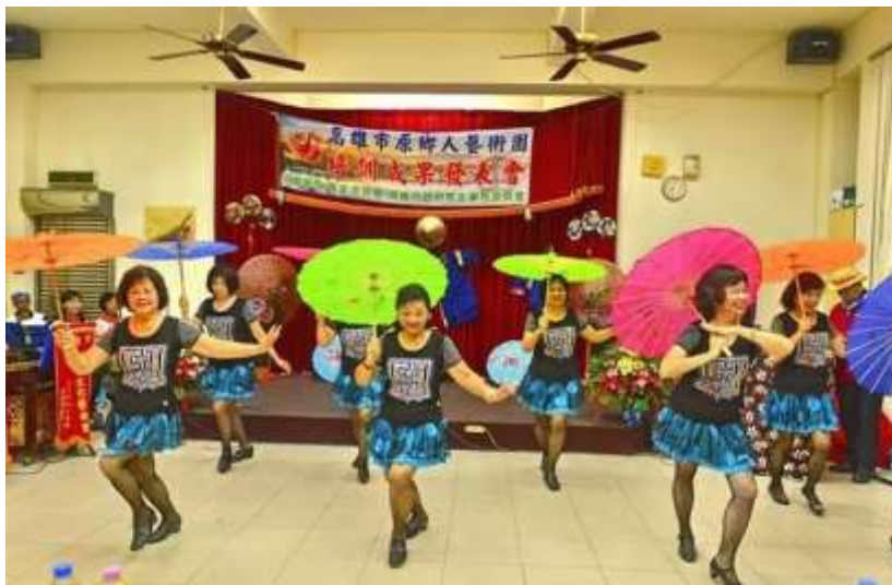
[圖 16] 社團成果發表會