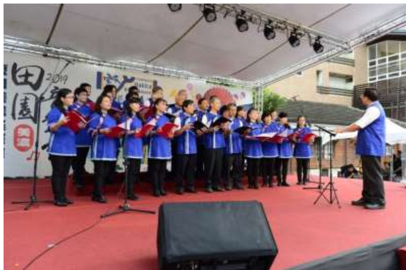
[圖 13] 高雄市田園合唱團演出

108 年 7 月 27、28 日在美濃文創中心舉辦，廣邀原住民、新住民、拉丁民族等國內外專業團體演出，呈現多元異文化的交融與美麗。另規劃創意藍衫競賽、客庄輕旅行、好客市集、多元服裝走秀等活動，藉以促進客庄經濟，帶動高雄觀光旅遊發展，約 5,600 人參加。(如圖 13、14)