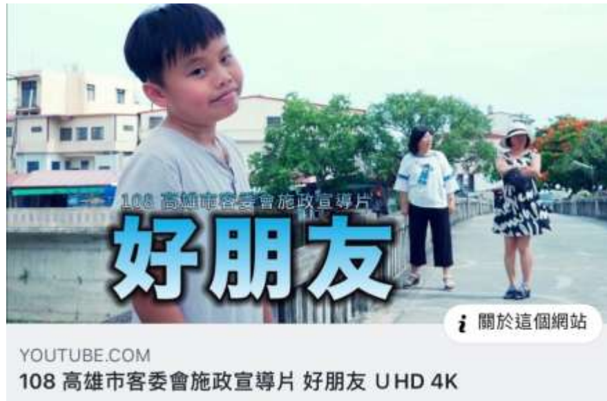
[圖 17] 客家市政宣導短片