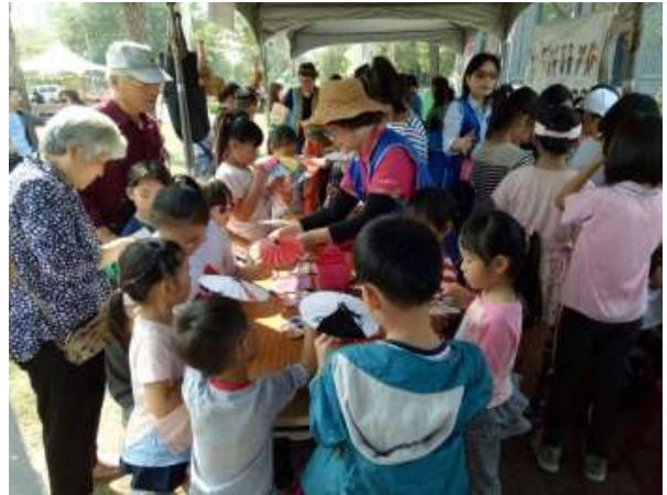
[圖 4] 世界母語日

108 年 2 月 23 日與教育局、原住民事務委員會假凹子底森林公園共同辦理，以客家、原住民、新住民及閩南等四族群文化為主軸，規劃歌舞動態演出及靜態展示，並提供闖關遊戲，鼓勵孩子多說母語，落實語言扎根政策。（如圖 4）