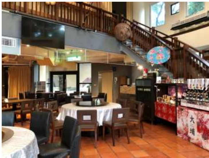
[圖 18] 圓窻驛棧