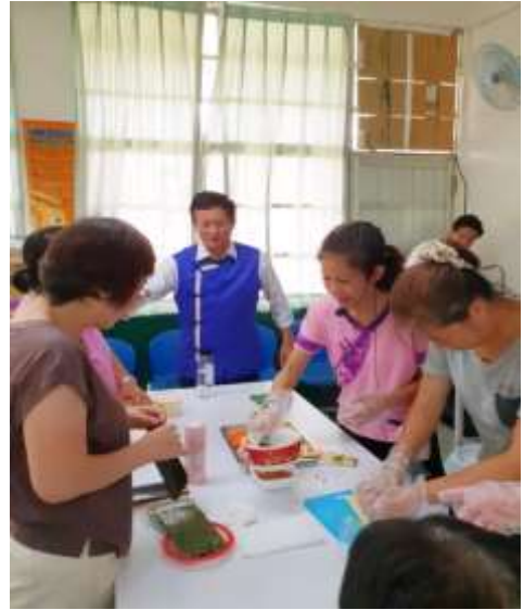
[圖 6] 鳳山區客家甜品播茶課程

等 14 門客語學習及文化技藝培訓班，透過不同主題，讓民眾以寓教於樂的方式學習客語，展現客家多元豐富的文化藝術，計 1,299 人次參加。（如圖 6）