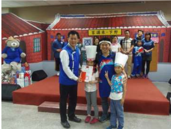
[圖 3] 親子客語說唱活動