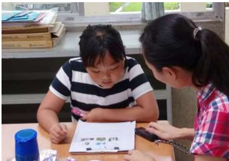
[圖 2] 國小客華雙語後測實施情形