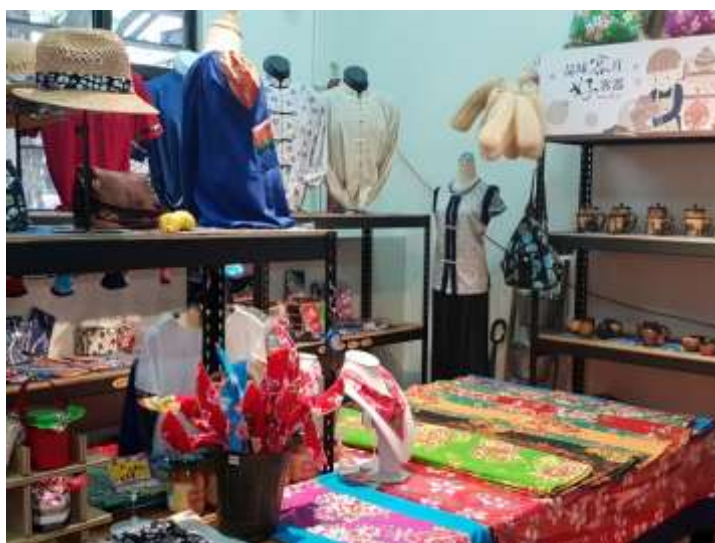
[圖 19] 好客來寮館豐富文創商品