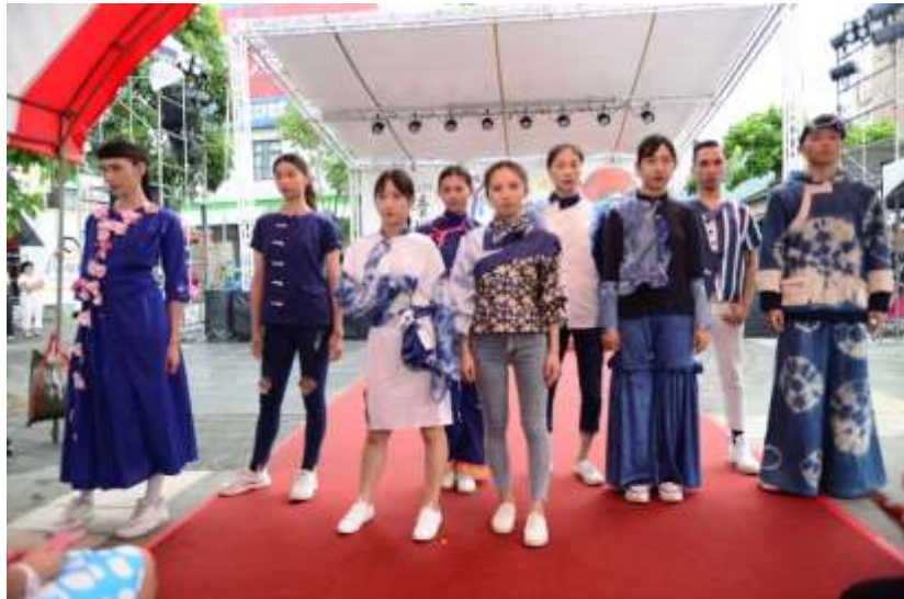
[圖 12] 創意藍衫競賽上衣組決賽走秀