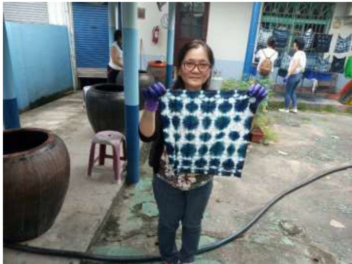
[圖 27] 客庄輕旅行-藍染體驗