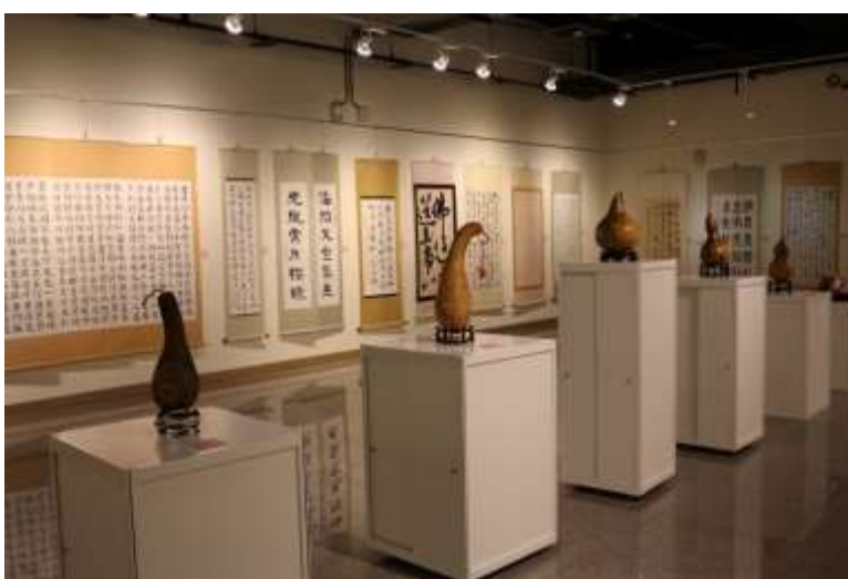
[圖 20] 濃情藝美墨畫香展覽

展期自 108 年 3 月 1 日至 3 月 31 日止，展出高雄市月光山藝術協會會員彩墨、油畫、水墨、國畫及書法等作品計 50 件，內容以推廣客家文化為主，用藝術結合鄉土，呈現客庄風情、客家諺語、鄉居生活之美，吸引 3,735 人次參觀。(如圖 20)