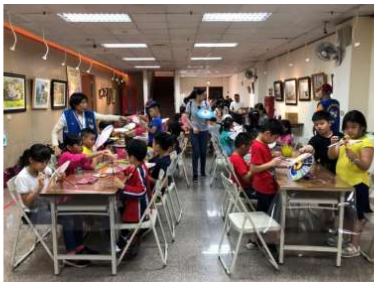
[圖 23] 彩繪客家紙傘