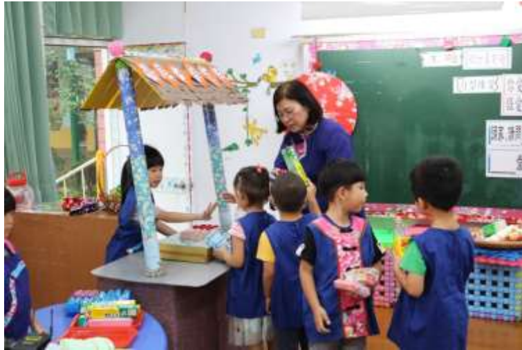
[圖 1] 幼教全客語教學

師資培訓計畫，提升教師專業知能，於授課過程中營造生活化的全客語學習環境，107 學年度計有美濃區 5 所公私立幼兒園及龍山、龍肚、福安、美濃、東門、吉東、廣興與六龜區新威等 8 所國小參與，深獲教師及家長肯定與支持。（如圖 1）