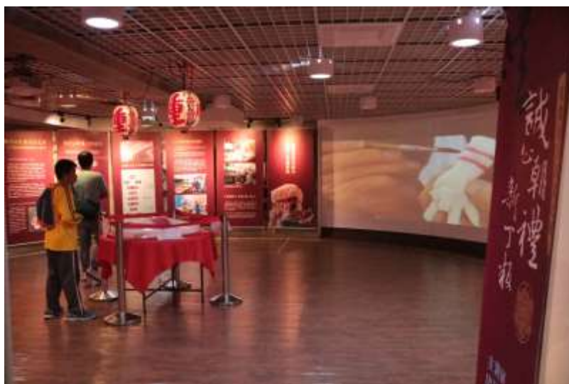
[圖 15] 誠心朝禮-新丁版特展