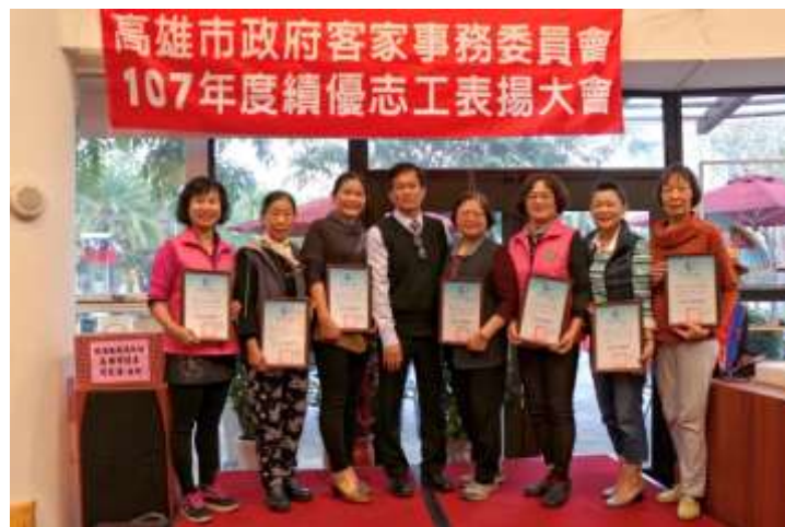
[圖 7] 107 年度績優志工表揚

為有效運用社會人力資源，型塑客語無障礙環境，於三民區公所、美濃客家文物館、新客家文化園區文物館等重要公共場所，設置「客語服務窗口」，提供客語之專業服務解說及導覽，108 年 1 月至 7 月計 93 名志工投入志願服務工作，總服務時數 7,935 小時、共服務 13 萬 2,687 人次。另為表揚 107 年度績優志工，108 年 1 月於三民區、美濃區分別舉辦志工表揚活動，計表彰 69 位志工。（如圖 7）