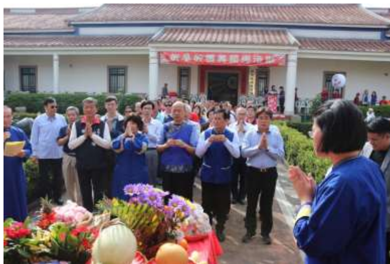
[圖 9] 韓市長率鄉親祭祀祈福