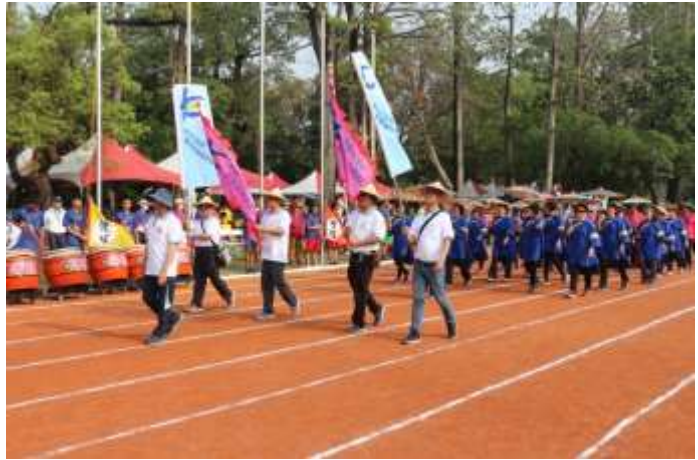
[圖 10] 六堆運動會開幕進場 (如圖 10)

108 年 3 月 16 日至 17 日第 54 屆六堆運動會由屏東縣內埔鄉主辦，本會同仁與志工組隊參與各項趣味競賽，開幕進場以藍衫與紙傘裝扮展露傳統客家文化特色，吸睛全場。