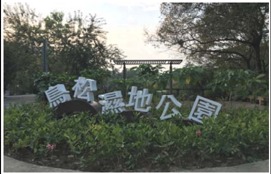
澄清湖及鳥松濕地周邊環境整建工程