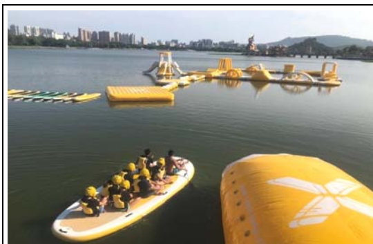
蓮池潭水上彈跳活動