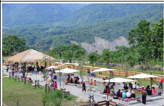
寶來花賞溫泉公園