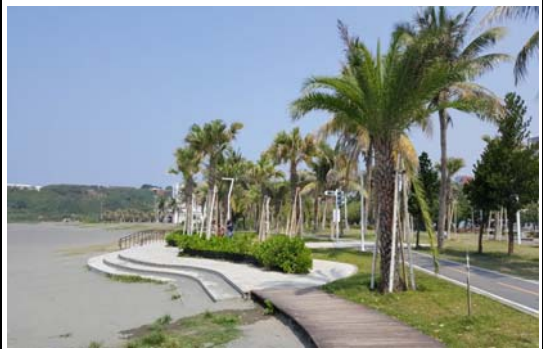
旗津沙灘遊憩區周邊環境改善工程