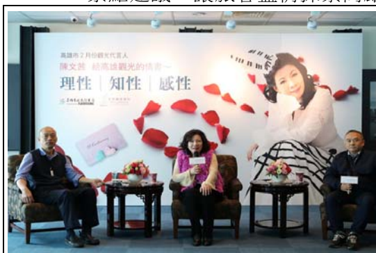
觀光代言人－陳文茜行銷高雄觀光活動

107 年 10 月新增本市新興景點（棧貳庫、哈瑪星光任務、崗山之眼等），介紹 4 條灣靠遊客 6-8 小時之特色行程介紹；另針對 Fly-Cruise 方式乘坐飛機來高搭乘郵輪旅客，設計不同主題，分別提供當日來回及兩日遊的景點建議，讓旅客盡情探索高雄風光。