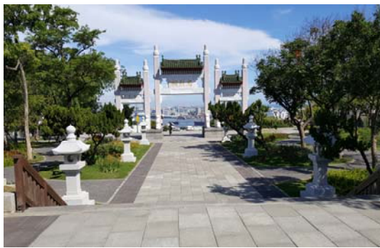
壽山情人觀景台周邊人文空間再造工程