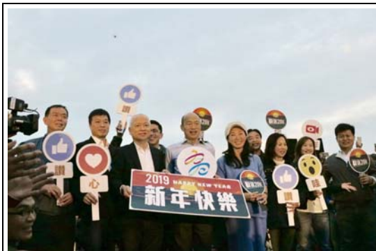
西子灣送夕陽活動