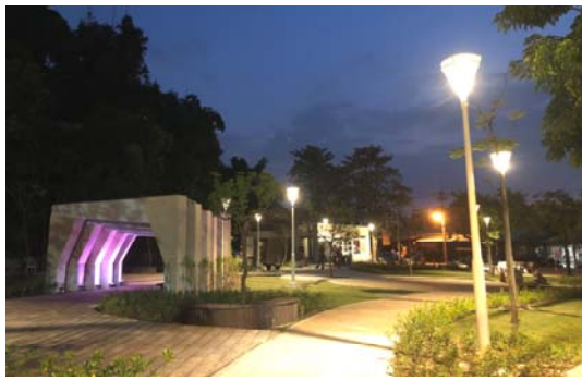
觀音山公廁及周邊環境新建工程