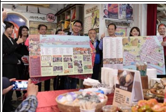
行銷旗鼓鹽美食之旅