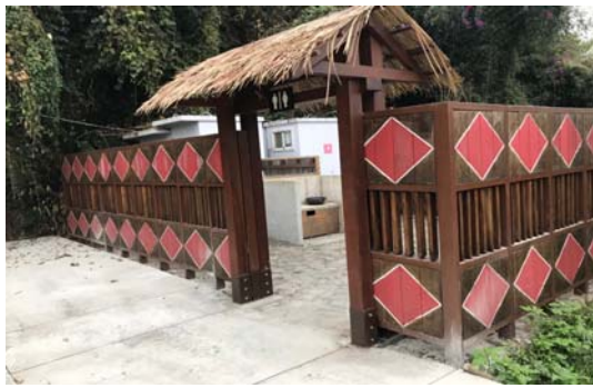
那瑪夏區觀光遊憩設施整建工程