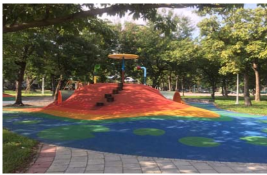
蓮池潭風景區整建工程