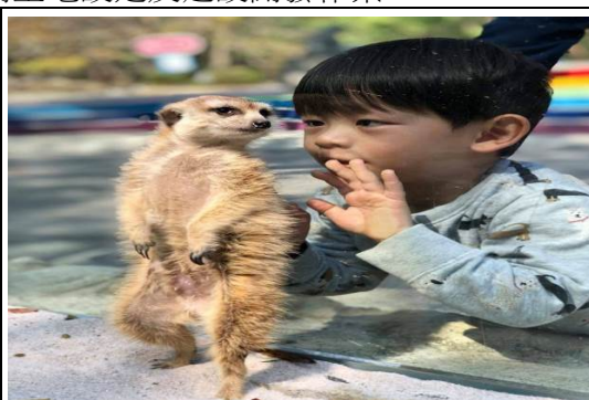
壽山動物園引入全新動物明星狐獴