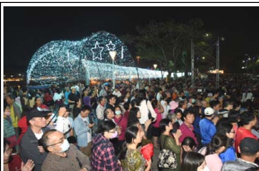
愛河燈會金銀河吸引眾多人潮