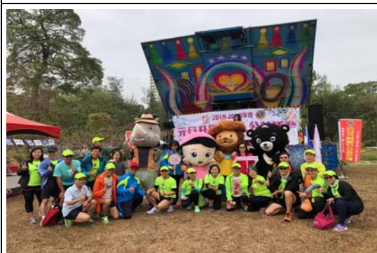
2019 元旦澄清湖動物認養活動