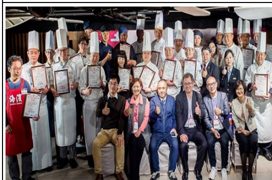
烏魚子佐餐酒大賽