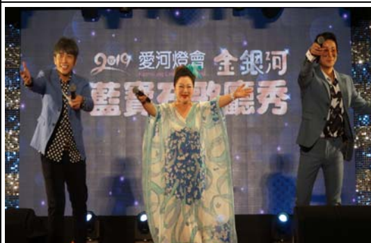
愛河燈會金銀河閉幕壓軸藍寶石歌廳秀