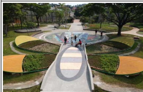
金獅湖蝴蝶園拍照打卡熱點