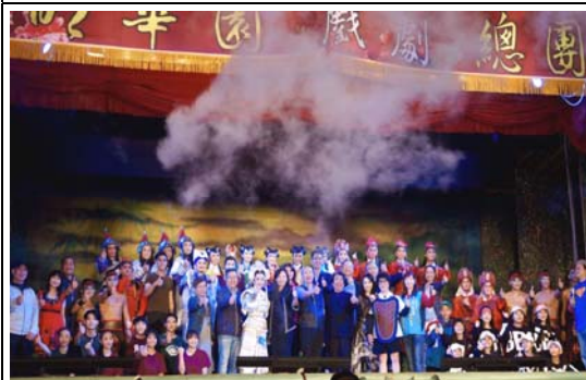
愛河燈會金銀河明華園戲劇總團精湛演出