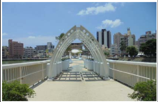
金獅湖風景區整建工程