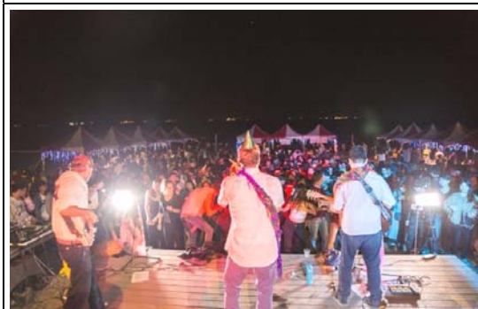
旗津沙灘吧音樂祭活動