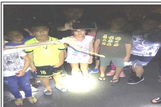
2018 動物野瘋狂夜宿營活動