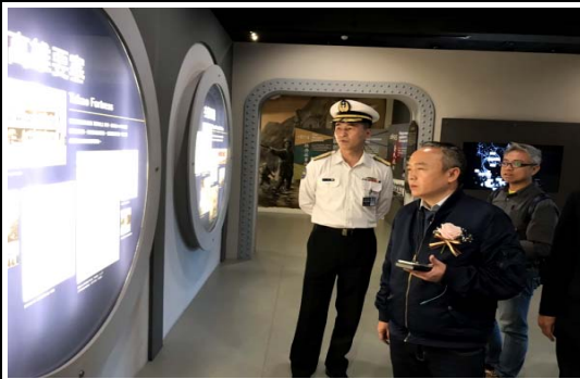
與海軍官校協商推動軍事觀光