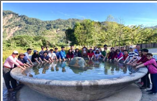
推薦特色旅遊行程踩線團