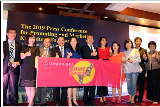
2019 年新加坡地區高雄觀光推廣活動