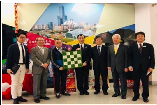
日本京都右京區區長等一行人拜會本局