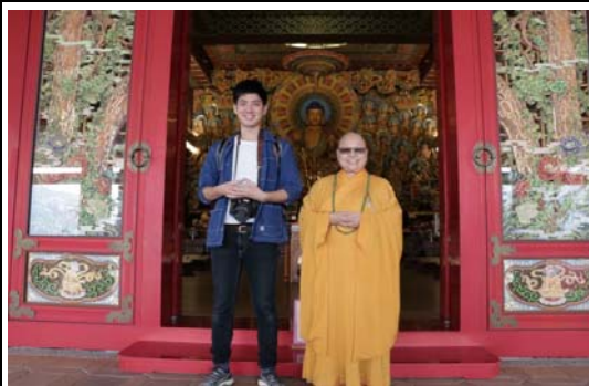
暖心六龜緩緩行行銷推廣活動