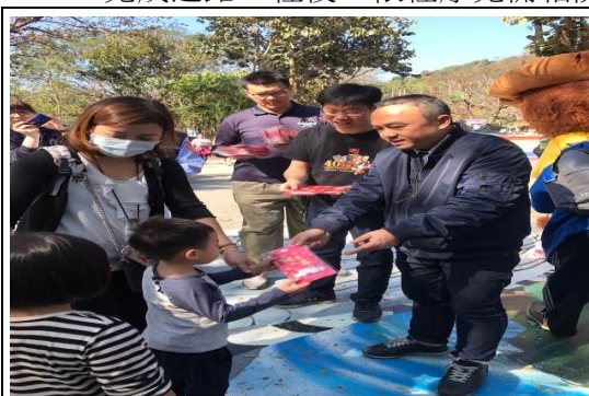
新春向民眾拜年暨發紅包活動

溫動物區及熱帶雨林動物區等）、水岸休憩區（含水鳥生態景觀區等）及戶外體健區等區域，以擴大園區開發之觀光效益。本計畫目前已完成「農地變更使用說明書」、「水土保持規劃說明書」、「環境影響評估說明書」等審查作業，另開發計畫書經內政部區域計畫委員會大會審查，於 107 年 9 月 5 日獲內政部核發開發許可在案。本案主要聯外道路預定於 110 年 4 月完工通車，園區土地異動登記地預定於 110 年 8 月底完成，規劃於 3 年內完成道路工程後，依程序完備相關土地設定及建設開發作業。