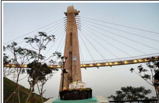
崗山之眼重新開幕