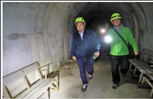
軍事觀光景點勘查