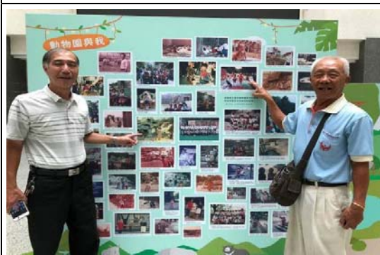
壽山動物園 40 週年老照片展活動