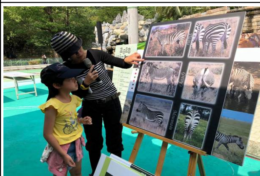
查普曼斑馬主題月活動