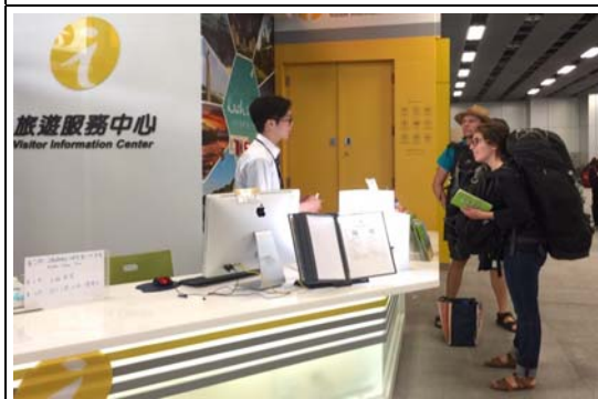
旅服中心榮獲評鑑全國特優