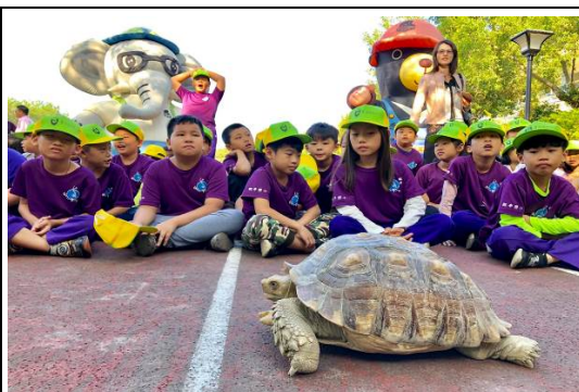
2018 大樹下的 ZOO 活動