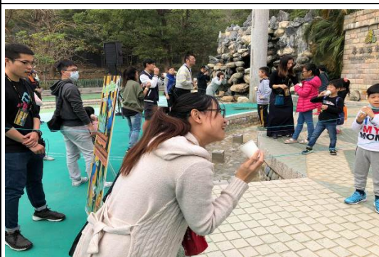
金剛鸚鵡－會飛的傳聲筒教育推廣活動