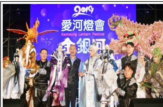
2019 愛河燈會金銀河開幕