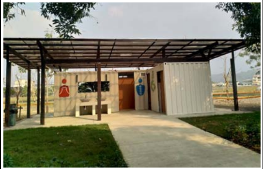
美濃湖環境空間品質改造工程