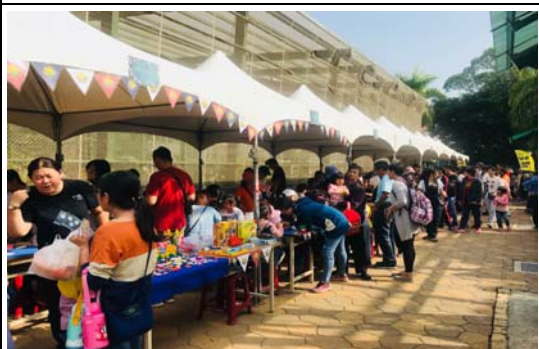
金獅湖「聖誕歡樂蝴蝶園」活動吸引民眾熱烈參與