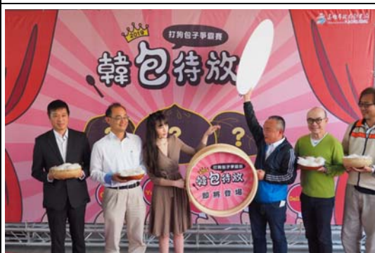
打狗包子爭霸戰行銷記者會