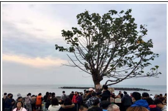
市境之南樹賞日出活動