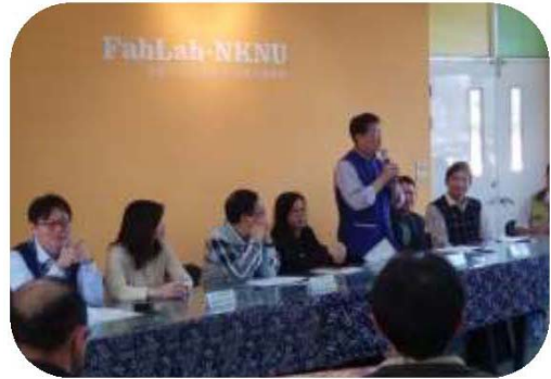
圖 2. 客華雙語師培及座談