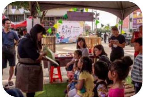
圖 27. 蘿蔔瑪奇特市集

107 年 11 月 4、10、11 日以美濃白玉蘿蔔為主題，由前來設攤的店家和業者製作蘿蔔相關產品，如麵包、糕點、料理、冰品、遊程、蘿蔔造型織品等，讓民眾體驗在地文創饗宴，現場亦有美濃