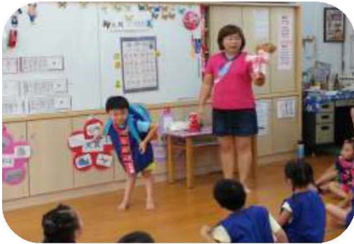
圖 1. 幼教全客語教學