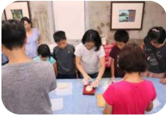
圖 19. 新丁板創意 DIY 活動

3.107 年 8 月 26 日至 108 年 3 月 31 日在美濃客家文物館圓形劇場舉辦「誠心朝禮—新丁板特展」，展示工藝製作過程、祭典祭儀之應用、播放紀錄片等，至 107 年 12 月 31 日止吸引約 3 萬人次參觀。