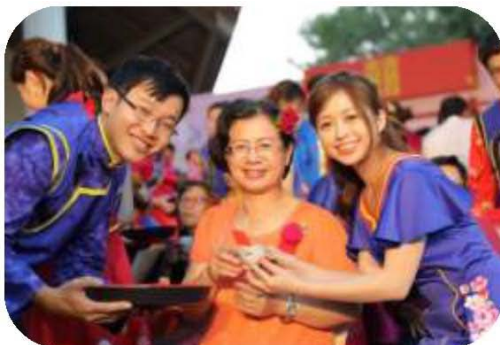
圖 16. 客家婚禮－食新娘茶

107 年 11 月 18 日假本市新客家文化園區辦理客家婚禮及客家宴，計 50 對新人參加婚禮，體驗傳統客家婚俗「上燈」、「插頭花」、「食新娘茶」等儀式，了解客家婚俗文化，同時配合婚禮辦理 88 桌客家筵席，共 2 萬 1,800 人次參加，獲得民眾高度評價與認同。以每人交通與餐飲平均消費 700 元計算，加上新人禮券、客家宴、媒體行銷宣傳、客家音樂及其他周邊商品，總產值達 1,756 萬元，有效達成振興客家產業、帶動高雄觀光旅遊、活絡都會客庄的目標。（如圖 16、17）