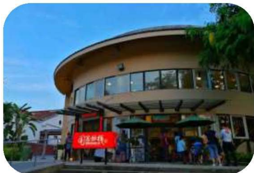
圖 20. 圓憲驛棧

受消費者青睞，107 年來客數計有 3 萬 6,000 人次。（如圖 20、21）