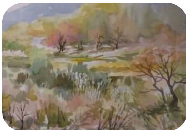
圖 22. 第二屆雄精采美術風暨名家藝術邀請展－畫家曾文忠先生作品

與高雄市采風美術協會合辦，展期自 107 年 7 月 3 日至 8 月 14 日止，展出 50 件水彩、油畫、水墨、綜合媒材等作品，多元題材並陳，吸引 5,472 人次參觀。（如圖 22）