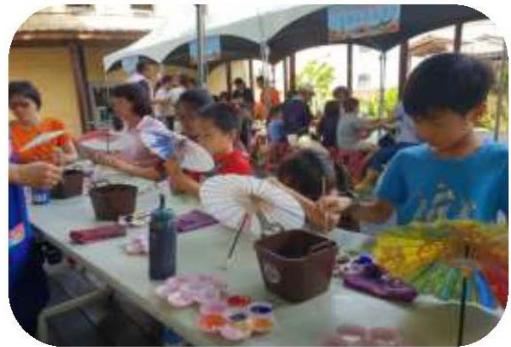
圖 15. 文物館 20 週年館慶－親子彩繪紙傘