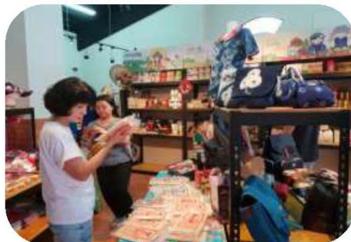
圖 21. 好客來寮館豐富客家文創商品