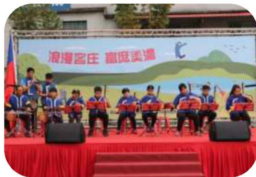
圖 34. 美濃國中客家八音演出