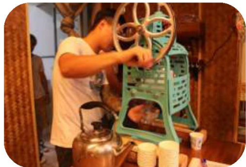
圖 30. 趣美濃－冰紛文創館之手工刨冰