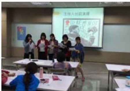
圖 3. 主持人來做客－雙語主持人培訓班