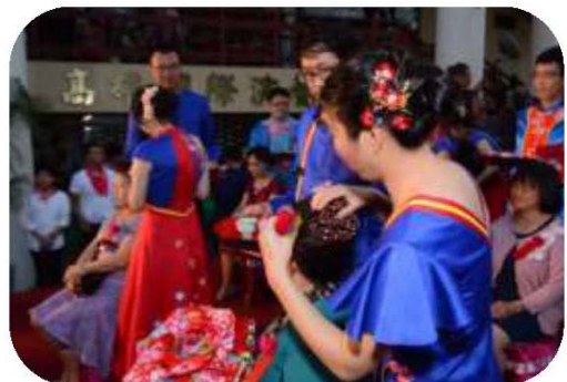
圖 17. 客家婚禮－新娘為長輩插頭花