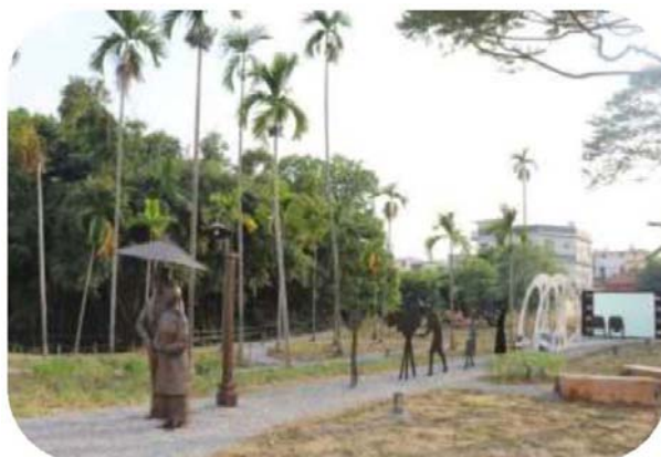
圖 28. 柚子林美濃溪左岸景觀營造

結合當地景觀，於美濃溪左岸打造特色裝置藝術，串聯鄰近美濃文創中心、永安老街、第一戲院等觀光資源，打造優質文化散步道，以帶動當地觀光，創造經濟效益，總經費 749 萬元，獲中央客家委員會同意補助 629 萬元，於 107 年 11 月竣工。（如圖 28）