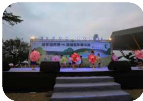
圖 32. 廣興國小附幼紙傘舞蹈

(四)辦理「浪漫客庄·富庶美濃」客家音樂會與好客市集 108 年 1 月 1 日假美濃文創中心舉辦，與美濃在地藝文表演團體、特色商家及旅宿業者合作，呈現精采的客家音樂與歌舞演出並展售客家特色商品，鼓勵民眾前進客庄，促進客庄經濟，落實韓市長「貨出去，人進來，高雄發大財」政策理念，逾 1,500 人參與。（如圖 33、34）