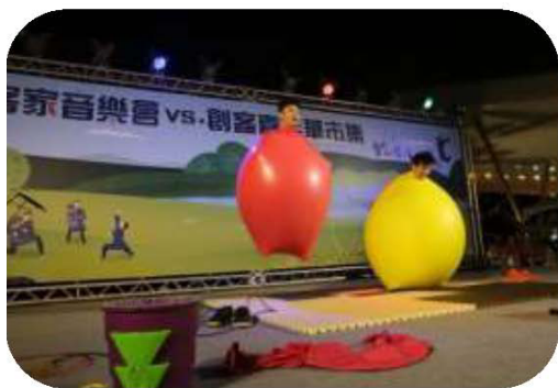
圖 31. 人人大球特技表演

與農業局、原住民事務委員會、海洋局、文化局、環保局等局處合作辦理「青山藍海·綠廊道」產業振興計畫，107 年 7 月至 11 月於本市中央公園舉辦產業串連市集。107 年 11 月 10、11 日輪由本會主辦，以客家音樂會及產業嘉年華為主軸，邀請本市 25 個客家社團及 5 個專業表演團體共同參與演出，並於現場展售客庄農特產品及手工藝品，行銷高雄特色產業，帶動高雄觀光發展。（如圖 31、32）