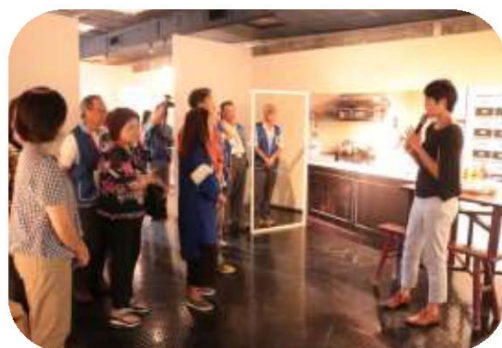
圖 25. 家的旅程－現場導覽

7.館內「兒童探索區」以「客家文化情境」、「客語沉浸」為主軸，運用「積木」素材，將美濃的自然、人文地景特色融入設計，設置豐富多元的遊戲角落，更特別引進全台獨有國外大型軟積木學習教具，可啟發孩童在數理、身體平衡、空間結構、戲劇、社交等能力，吸引眾多親子及戶外教學幼兒入場共樂，107 年約有 4 萬人次購票入館使用。