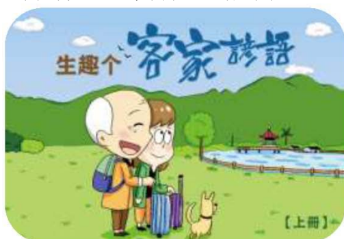
圖 11. 生趣个客家諺語上冊

透過打嘴鼓的方式收錄美濃古老客家生活慣用語、客家俗諺語等語音檔，並整理俗諺語的內涵、典故、使用時機等，精選 302 則諺語繪製成活潑生動的《生趣个客家諺語》有聲漫畫讀本，方便民眾學習，並為客語提供更完整、寶貴的語音資料，107 年 12 月 7 日辦理新書發表會，首印發行 500 套（含上、下冊）。（如圖 11、12）