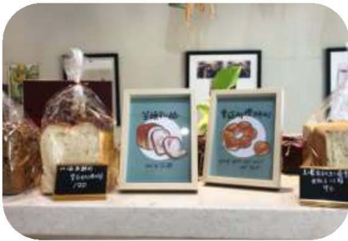
圖 4. 客語地底－美濃啖糕堂

2.107 年與美濃區 2 家文創商店、1 間國民小學合作，以型塑客語友善社區和環境為目標，建構客家商店「語言地景」（商品標語、說明等）。（如圖 4、5）