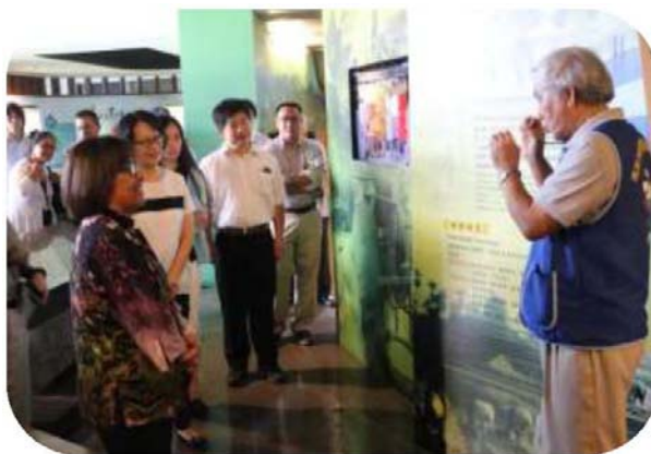
圖 10. 馬紹爾群島總統率團來訪美濃客家文物館－志工導覽情形

為有效運用社會人力資源，型塑客語無障礙環境，於三民區公所、美濃客家文物館、新客家文化園區文物館等重要公共場所，設置「客語服務窗口」，提供客語之專業服務解說及導覽，107 年計 95 名志工投入志願服務工作，總服務時數 1 萬 3,509 小時、共服務 25 萬 7,374 人次，績效優良。（如圖 10）