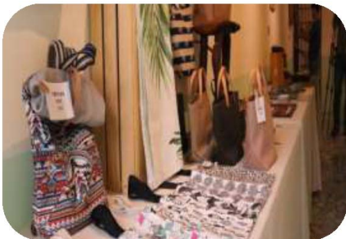
圖 29. 果然紅工作室販售美濃在地手工藝品