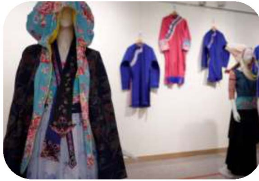
圖 23. 客家創意服飾展—下一站·美濃