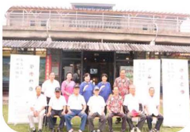
圖 18. 客家八音拼場合照