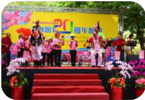
圖 14. 文物館 20 週年館慶－客家歌謠演出

(一)辦理「新客家文化園區文物館 20 週年慶系列活動」於 107 年 10 月 14 日辦理「文物館 20 週年館慶研討會－客家文化的傳承與創新論壇」，邀請對客家文化具有特殊貢獻的學者、專家共同與會，分享對客家文化與事務的體驗，以及展現投入研究的成果；另於 10 月 20 日舉辦館慶系列活動，安排客家歌謠演出、文創美食展及客家親子活動，2 場活動共計 1,600 人次參與。（如圖 14、15）