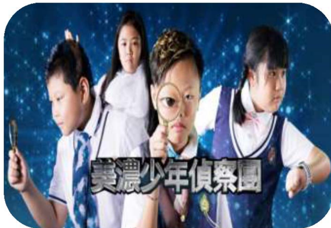
圖 6. 美濃少年偵察團第 1 集劇照

3. 邀請美濃國小客華雙語實驗班三、四年級學生拍攝 3 集短片，名為「美濃少年偵察團」，以孩童喜愛的推理、懸疑為主軸，並揉合詼諧、輕鬆的內容，透過影片傳達「講客語是件很酷的事」、「原來客家短片也可以這麼有趣」等印象，並營造「在美濃，我們可以用客語買東西」的社區群體意識。3 部影片分別於 6 月、8 月及 9 月播出，至 107 年 12 月 31 日止，觸及率達 20 萬 9,527 人次、觀看次數 9 萬 9,294 人次、留言分享 6,113 人次，受到許多客家鄉親和民眾的鼓勵與肯定，成為客家文化推動的新指標。（如圖 6）