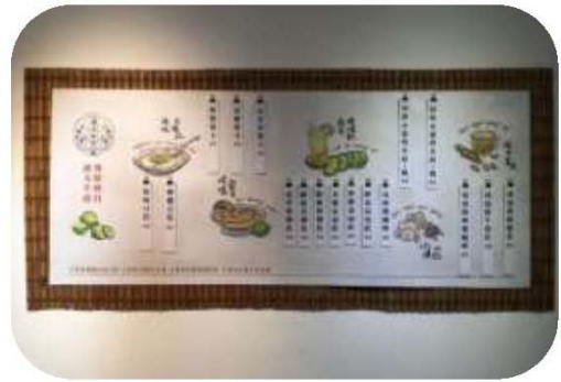
圖 5. 客語地底－農夫生活

3. 邀請美濃國小客華雙語實驗班三、四年級學生拍攝 3 集短片，名為「美濃少年偵察團」，以孩童喜愛的推理、懸疑為主軸，並揉合詼諧、輕鬆的內容，透過影片傳達「講客語是件很酷的事」、「原來客家短片也可以這麼有趣」等印象，並營造「在美濃，我們可以用客語買東西」的社區群體意識。3 部影片分別於 6 月、8 月及 9 月播出，至 107 年 12 月 31 日止，觸及率達 20 萬 9,527 人次、觀看次數 9 萬 9,294 人次、留言分享 6,113 人次，受到許多客家鄉親和民眾的鼓勵與肯定，成為客家文化推動的新指標。（如圖 6）