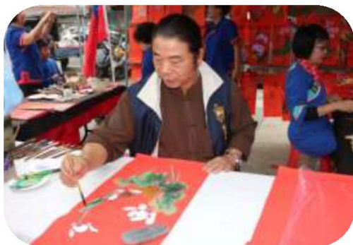
圖 33. 美濃月光山書畫藝術學會 現場作畫