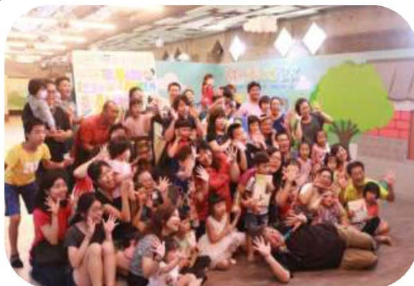
圖 26. 「美濃山下搞生趣」說故事活動

8.107 年 8 月 4 日至 10 月 6 日辦理「美濃山下搞生趣」說故事活動共 23 場次，計吸引 2,400 人次報名參加。（如圖 26）