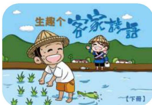
圖 12. 生趣个客家諺語下冊