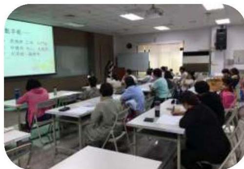
圖 9. 輕鬆說客語