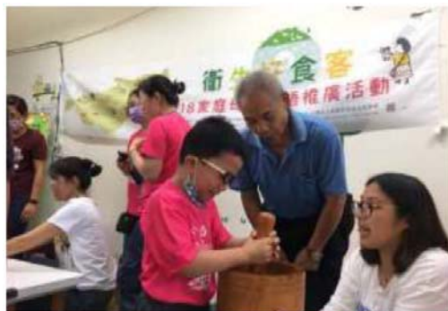
圖 7. 衛生好食客－2018 家庭母語客語推廣活動

家庭是學習母語的起點，國外有很多醫療院所均致力推動「說母語與喝母乳是同等重要」的觀念，培養小孩從小認同自己的族群及語言，可惜國內多數客籍家庭普遍不常使用客語對話，導致年輕一代對母語的疏離。本會自 104 年 6 月開始與衛生福利部旗山醫院、美濃、杉林、六龜、甲仙 4 區衛生所聯合推動「家庭母語」，107 年辦理「衛生好食客－2018 家庭母語客語推廣活動」，結合在地幼兒園，倡導父母在家多和子女說客語，落實母語生活化，計 400 多人參與。（如圖 7）