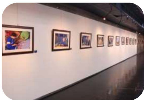
圖 24. 玩美的焦距－鍾北鳳美濃攝影展

展期自 107 年 11 月 13 日至 108 年 9 月 1 日，截至 108 年 1 月底計吸引約 1 萬 5,100 人次參觀。（如圖 25）