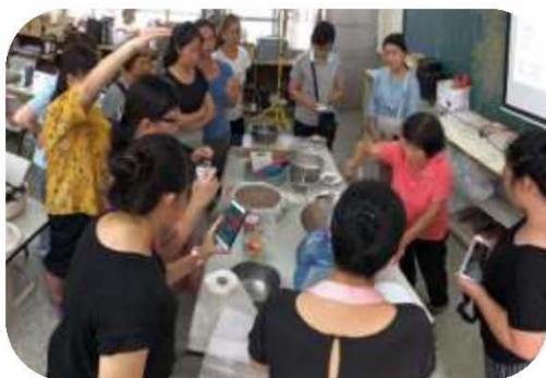
圖 8. 喜妹阿嬤現場示範炒料