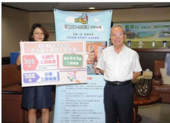
青年公部門暑期工讀計畫