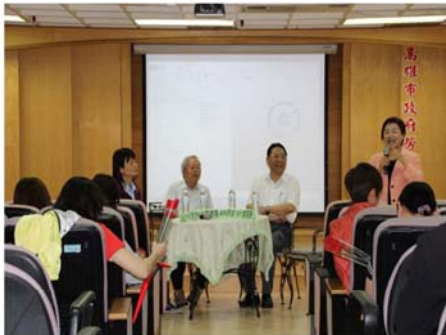
女性勞工推動職安衛業務暨職場母性健康保護宣導會