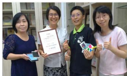
提供街友就業服務