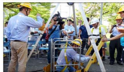
局限空間作業觀摩會