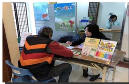
提供醫院駐點服務