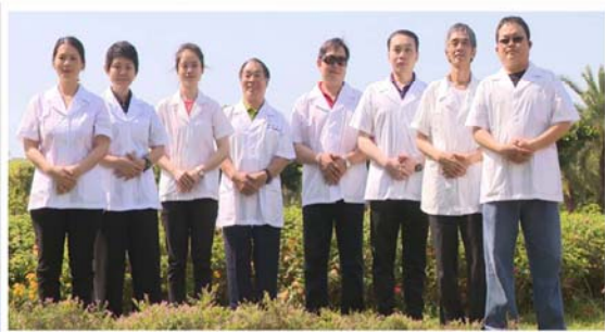
拍攝「視障按摩普拉斯」形象影片