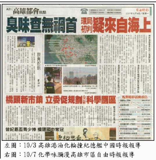
左圖：10/3 高雄港油化輪撞紀念級艦中國時報報導 右圖：10/7 化學味瀰漫高雄市區自由時報報導