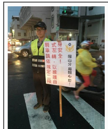
照相逕行舉發效率高無教育意義，攔停開單教育效果好耗費警力效率低。「2 剛 1 柔」1 站崗嚇阻 2 攝影機違規全都錄 3 勸導開罰 2 比 1。