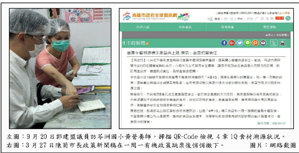
左圖：9月20日郭建盟議員訪苓洲國小黃營養師，掃描QR-Code檢視4章1Q食材溯源狀況。 右圖：3月27日陳菊市長政策新聞稿在一周一有機政策跳票後悄悄撤下。

檢視 19 及 20 兩日菜單，其中小黃瓜與高麗菜未依政策規定購買標章食材，其他天胡蘿蔔、菜瓜、豆薯、馬鈴薯、大蕃茄、綠豆芽等蔬菜，也普遍有此一狀況。學校表示主因高雄非根莖類蔬菜產區，難購得根莖標章食材。