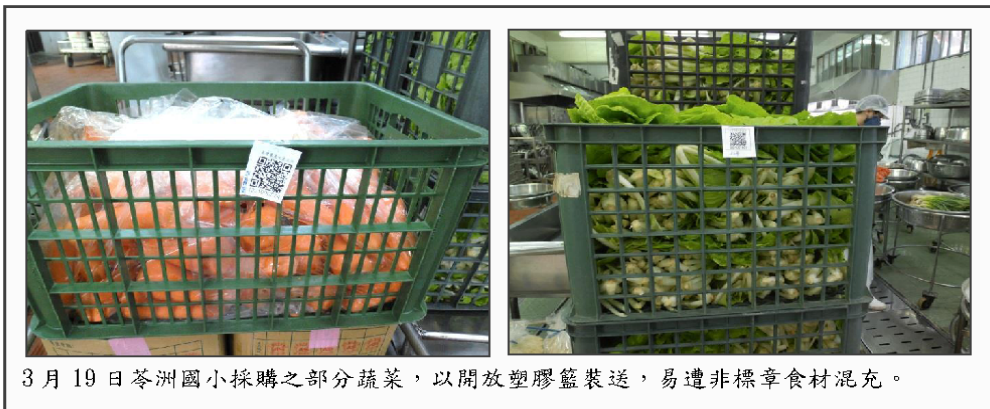
3月19日苓洲國小採購之部分蔬菜，以開放塑膠籃裝送，易遭非標章食材混充。

●高雄標章食材產量無法穩定供應校園採購所需？學校說小黃瓜高麗菜買不到，偏偏上農委會農產品經營業者查詢專區網站上 http://www.coa.gov.tw/fpiss/ ，內容不乏高雄在地業者。是貨源不足買不到？還是廠商不願出高價買？