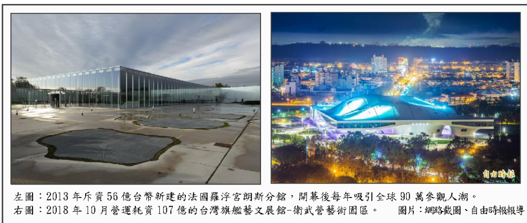
左圖：2013 年斥資 56 億台幣新建的法國羅浮宮阿布達比分館，開幕後每年吸引全球 90 萬參觀人潮。 右圖：2018 年 10 月營運耗資 107 億的台灣旗艦藝文展館-衛武營藝術園區。