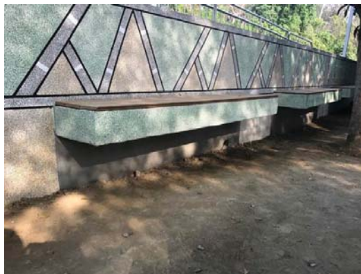
橋頭區糖蜜步道雨水下水道工程