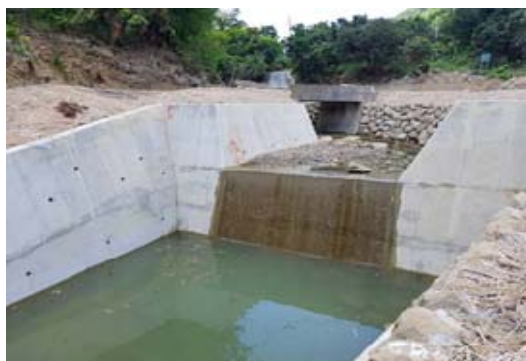
高 121 線玉門野溪整治工程