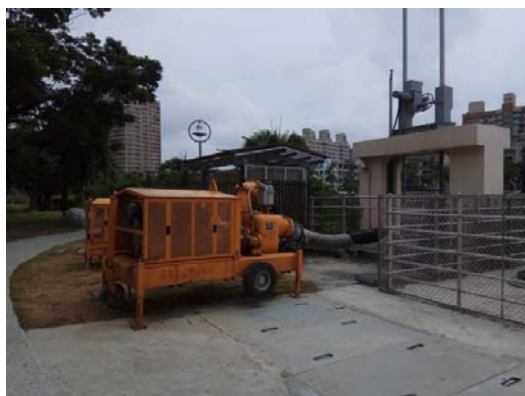
鼓山區河西一路抽水站功能提升工程