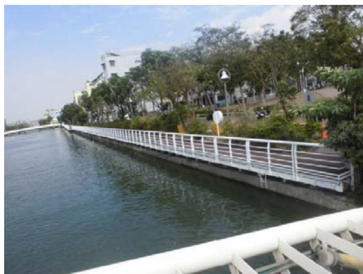
前鎮河兩岸木棧道及欄杆修復工程（鎮興路至興旺路南岸）