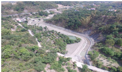
茄苳湖吉橋下游整治工程