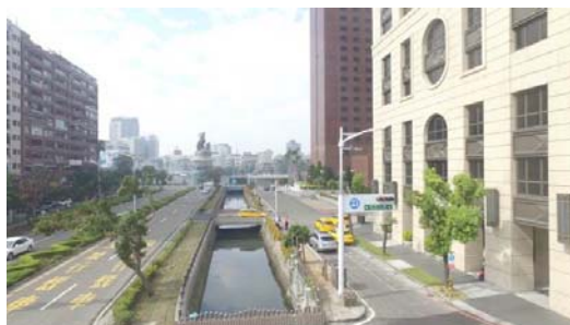
民生大排等雨水箱涵污水截流工程