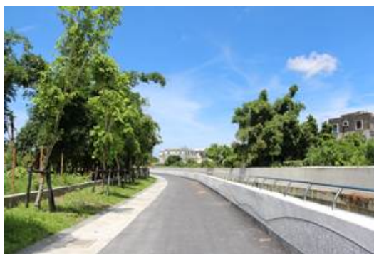
筆秀排水（出流口至海城橋段）整治工程（治理第一期）