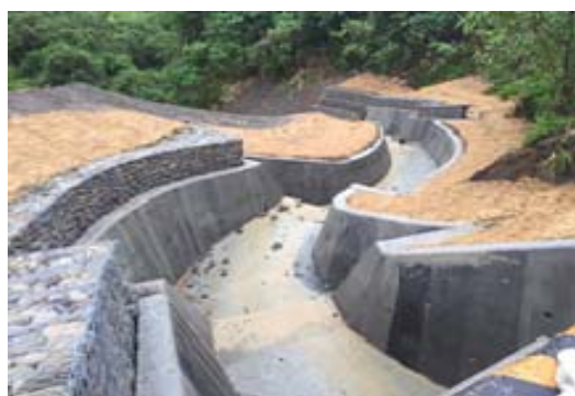
杉林區十張犁 193-652 地號等防砂壩 掏空修復工程