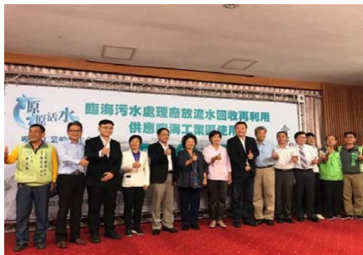
臨海污水廠（再生水廠）