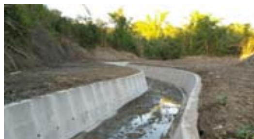
旗山區楊厝巷鳳明橋上游野溪整治工程