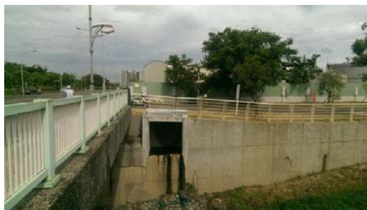
鳳山溪污水廠緊急繞流工程