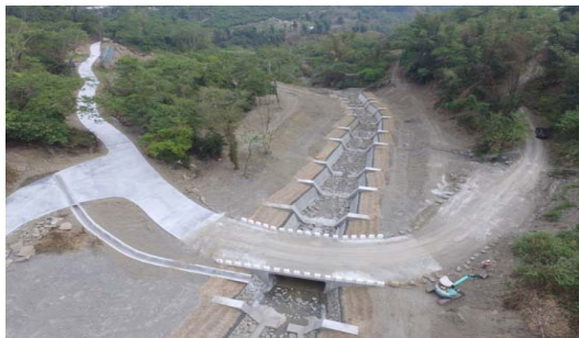
雙連堀野溪整治工程