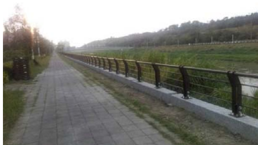
楠梓區後勁溪河岸設施工程