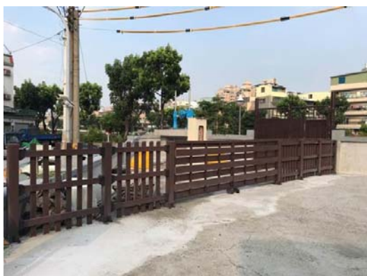
前鎮區鎮昌一巷簡易式抽水站工程