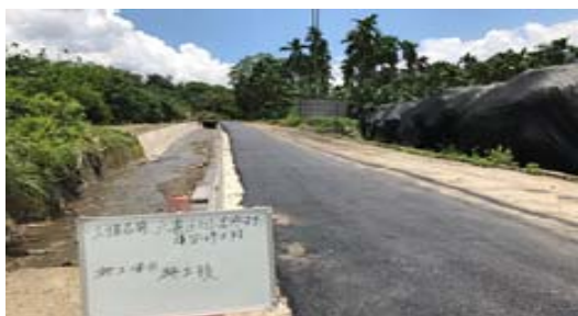
六龜區田營底野溪災修工程