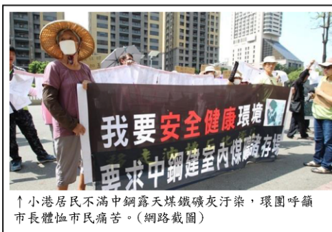
↑小港居民不滿中鋼露天煤鐵礦灰汙染，環團呼籲市長體恤市民痛苦。

然而 2016 年 6 月，中鋼等國營事業經營高層，面對地方政府要求污染改善的法案，未循正常管道進行溝通協調，尋求地方政府、市民、企業三方共榮的折衷方案，反而發生工會代表，挾眾聲勢施壓，讓在地市民拿「飯碗」與「健康」對立互砸，實為遺憾。建盟深深期許相關國營事業主事者，應本台灣隊命運一體，共謀國家長遠利益的態度，深思慎行。