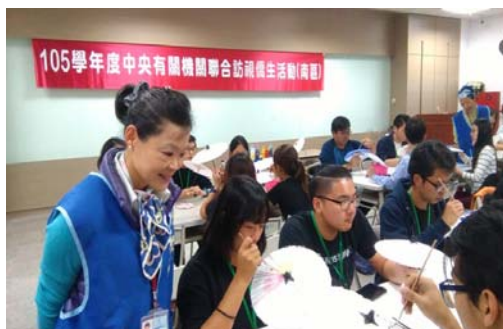
圖 31、南區僑生體驗紙傘彩繪