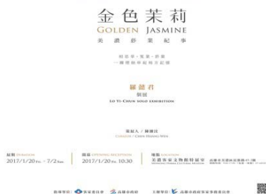
圖 35、金色茉莉-美濃菸業紀事展海報