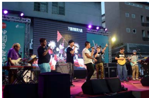
圖 20、青少年客語創作專輯發表