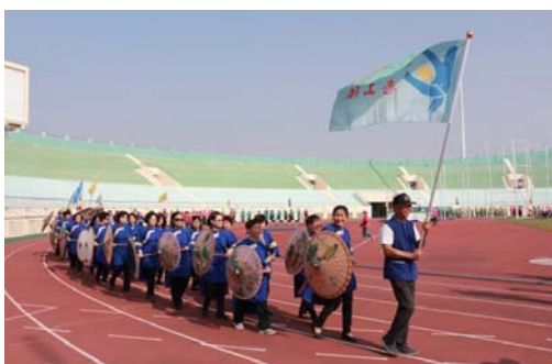
圖 10、參加國際志工日