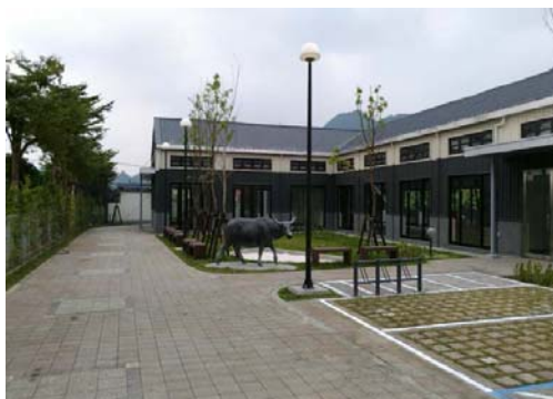
圖 46、福安菸葉輔導站整建完工樣貌