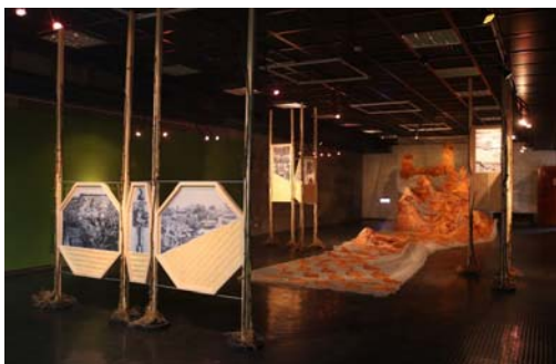
圖 36、金色茉莉-美濃菸葉紀事展