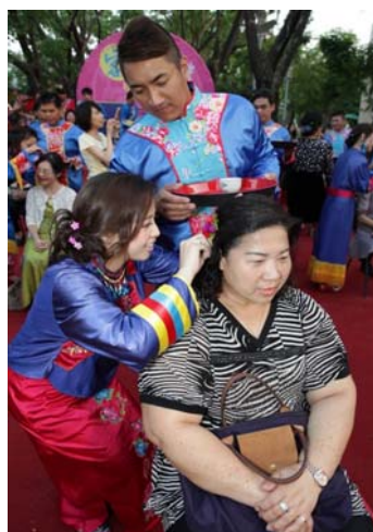
圖 16、客家傳統婚俗文化-插頭花

105 年 11 月 5 日於新客家文化園區辦理，今年擴大招募 50 對新人參加，並結合客家料理饗宴 100 桌，讓民衆在享用客家美食之際，也能體驗客家傳統特色婚俗文化。（如圖 16、圖 17）