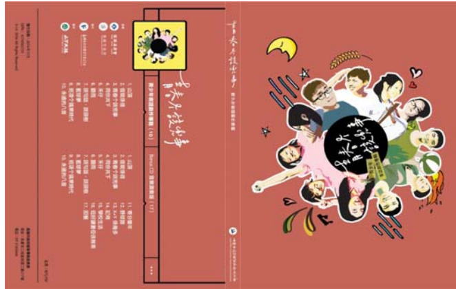
圖 12、青少年客語創作專輯《青春个該兜事》