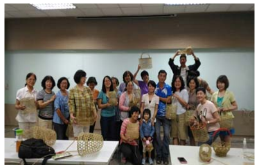
圖 5、客家學苑-客家創意竹編