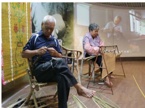
圖 15、竹門簾老師傅現場展演