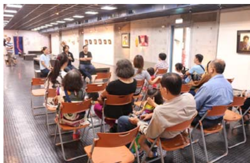
圖 33、「域外之境」藝術家解說作品 圖 34、「域外之境」藝術座談會