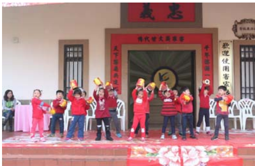
圖 21、幼兒園新春祈福演出

儀，在傳統客家八音的樂曲中，由市長率客家鄉親以三獻禮儀式，向土地伯公祈求新的一年風調雨順，祭祀完成後並發放開運小紅包及客家飯食給現場民衆，計約 700 人參加。(如圖 21、圖 22)