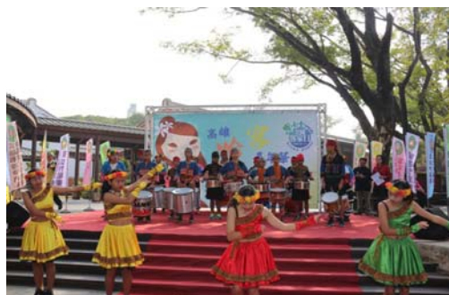
圖 26、全國客家日-瑪家森巴鼓樂隊