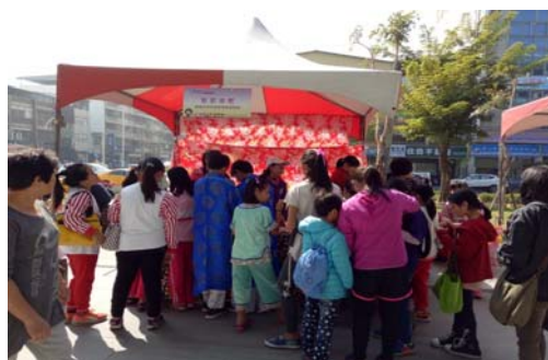
圖 24、世界母語日-體驗客家搗麻糬