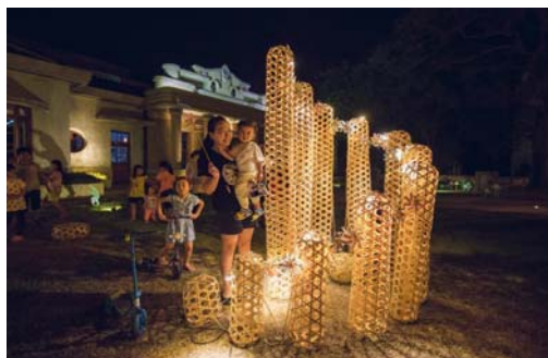
圖 42、駐村藝術計畫藝術家作品

為重現老街風采，辦理「照亮右堆-點亮美濃永安老街」駐村藝術計畫，邀請 2 位青年藝術家於 105 年 8 月至 10 月駐村，運用不同媒材創作激發原有場域的記憶及反思，將文創中心及周遭環境做為創作展覽空間，同時每個月推出竹編風車、氫版印刷…等藝術工作坊，105 年 11 月 19 日舉辦駐村創作展開幕儀式後，展示至 106 年 2 月 5 日，期望藉由藝術與創意為媒介引動客庄鄰里更多能量，共吸引 2 萬 8,000 人次參與欣賞。(如圖 42、圖 43)