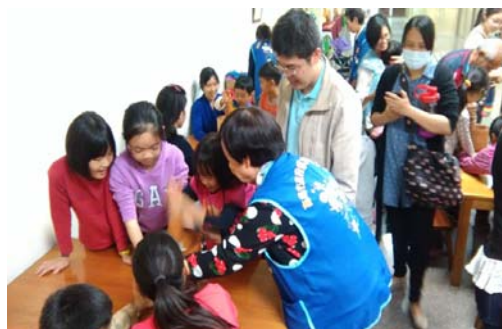
圖 32、親子體驗搗麻糬