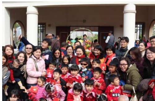
圖 22、市長發開運紅包給小朋友