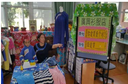
圖 1、全客語學習環境