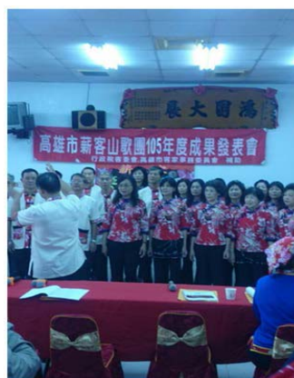
圖 27、輔導社團開辦客家歌謠培訓課程

105年9月至106年2月計輔導41個客家社團，開辦客家歌謠、舞蹈及技藝班等培訓課程與客家文化活動，參與鄉親計3,124人；社區公演逾4場次，參與鄉親及民眾達980人次。另輔導4個社團辦理「2016全國高雄美濃客家傳承盃民俗體育錦標賽」、「返鄉·發現客家-2016六堆青年論壇」、「金雞迎春，美藝文風」藝展及「滿年福春、秋報夜祭」等活動，參與鄉親及民眾達4,750人次，公私齊力推廣客家事務。(如圖27)