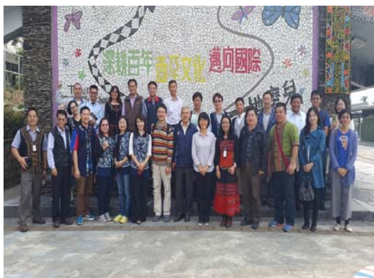
圖 3、參訪屏東地磨兒小學

106 年 1 月 9 日召開「客家實驗學校籌設諮詢會議」，邀請專家學者及美濃區 9 所國小校長及主任，參訪「屏東縣地磨兒國民小學」，了解該校實施母語沈浸式教學推動方式，透過入班觀課了解教學模式、課程設計及經驗分享，提供本會規劃客家實驗學校之參考。(如圖 3)