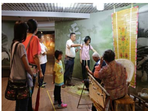
圖 14、美濃百工百業之師—竹門簾