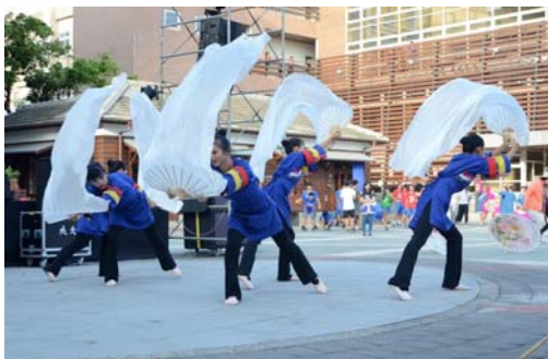
圖 19、青少年歌舞擂台賽

105 年 11 月 19 日於美濃文創中心辦理，邀請美濃樂團、高雄市傳唱客家民俗藝團、高雄市客家民謠研究會、美濃婦女合唱團、竹頭背八音團等在地社團演出，另發表第 2 張青少年客語創作專輯《青春个該兜事》，並舉辦高雄地區青少年歌舞擂台賽，計有 9 隊報名參加，熱鬧非凡。（如圖 19、圖 20）