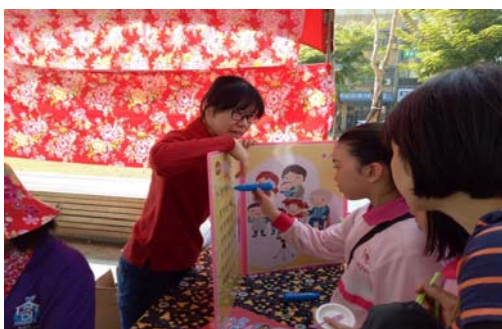
圖 23、世界母語日-客語點讀書

106 年 2 月 18 日與教育局、社會局及原住民事務委員會假鳳山行政中心共同辦理，以客家、原住民、新住民及閩南等四族群文化為主軸，規劃歌舞動態演出及靜態展示，並提供闖關遊戲，讓參與者藉由闖關活動認識不同族群的精采文化。(如圖 23、圖 24)