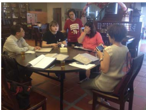
圖 47、「客家美食 HAKKA FOOD」餐廳實地輔導

於 105 年 10 月至 106 年 8 月辦理「客家美食 HAKKA FOOD」餐廳輔導計畫，遴選高雄市 20 家優質客家餐廳，並聘請專家學者於 105 年 12 月完成第 1 階段輔導，同時推薦爭取客家委員會「客家美食 HAKKA FOOD」餐廳認證，106 年 3 月至 6 月將再執行第 2、3 階段輔導，以提升本市客家餐廳服務品質及宣揚客家飲食文化。(如圖 47)