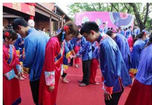
圖 17、三拜禮-夫妻對拜