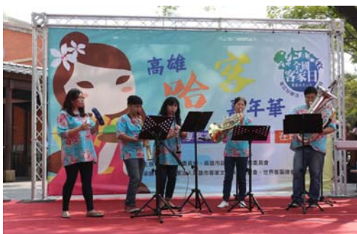
圖 25、全國客家日-客家印象銅管五重奏