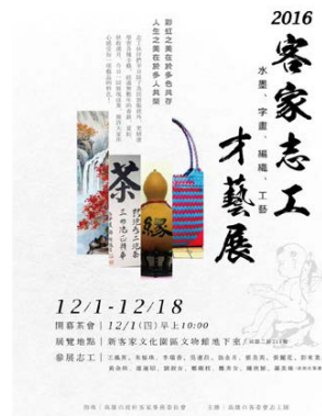
圖 30、客家志工才藝展

於 105 年 12 月 1 日至 12 月 18 日展出客家志工書法、水墨、工藝、服飾及油畫共 70 件作品，展現志工多元才藝，吸引 1,563 人次參觀。(如圖 30)