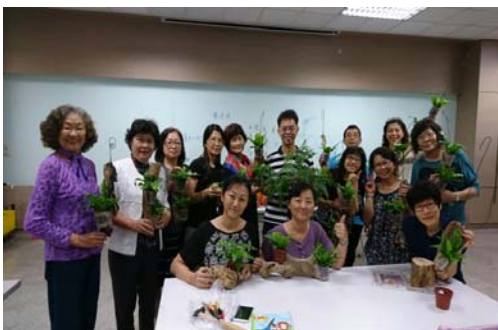
圖 4、客家學苑-家庭盆栽綠手指

105 年 9 月至 11 月於新客家文化園區文物館及鳳山區中正國小客家傳習教室分別開辦「四縣腔中高級客語」、「海陸腔中高級客語」、「客家諺語及歇後語」、「輕鬆說客語」、「就是愛唱客家歌」、「客家創意竹編」、「客家古禮」、「基礎電腦」等 19 門客語學習及文化技藝培訓班，計 2,005 人次參與，透過不同主題，讓民衆以寓教於樂的方式學習客語，展現客家多元豐富的文化藝術，並鼓勵語言學習班學員報名參加客語認證。(如圖 4~圖 7)