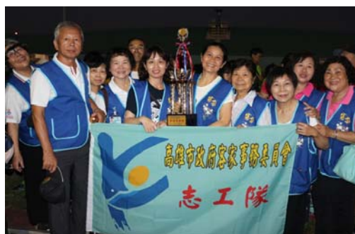
圖 11、榮獲「最佳青春獎」