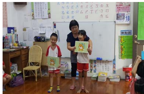
圖 2、全客語沉浸教學