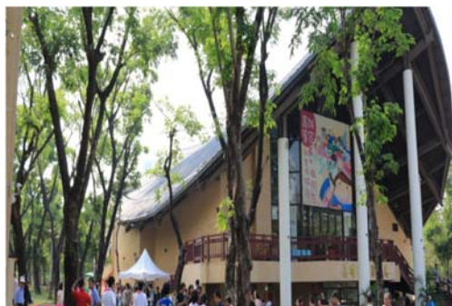
圖 28、高雄市新客家文化園區

1.新客家文化園區是南部首座都會型客家文化園區，主體建築演藝廳、圓樓餐廳及2棟展售中心出租民間廠商營運，引進民間資源及多元創新的經營理念，透過客家文化展演，搭配客家特色建築、美食及文創產品，帶動觀光產業，繁榮地方經濟。(如圖28)