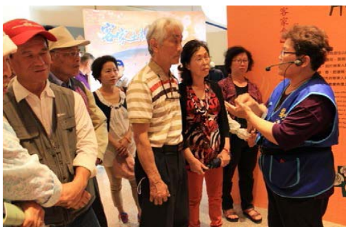
圖 8、志工導覽解說客家文物