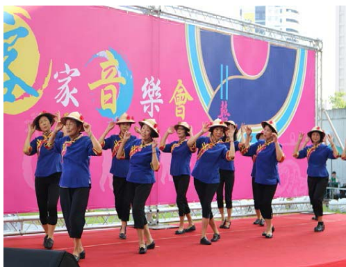
圖 18、本市客家表演團體演出

家藝術團、桂陽客家綜藝團、新桃苗揚客南胡樂團、客家鄉音樂團、歡樂客家成長團、松柏客家歌謠合唱團、新瓦樂團、文華客家藝術團等 23 個客家優質表演團體演出，提供客家藝文表演及觀摩交流的平台，也讓參與民衆共同體會客家音樂之美。（如圖 18）