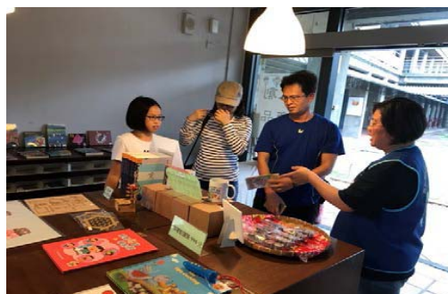
圖 9、美濃客家文物館志工介紹文創產品