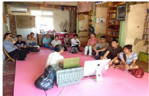
圖 7、鳳山客家傳習教室-客家文化講座