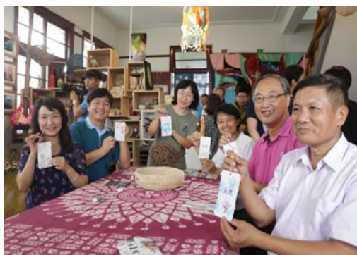
圖 44、「草木生活藝術工作室」開幕