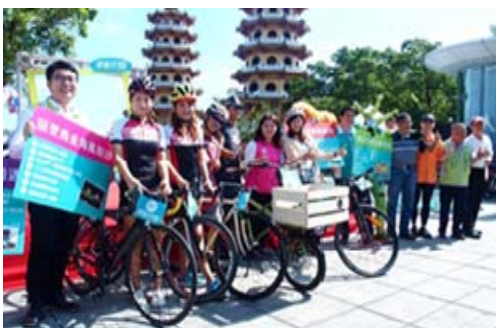
「乘風而騎」單車旅遊活動記者會