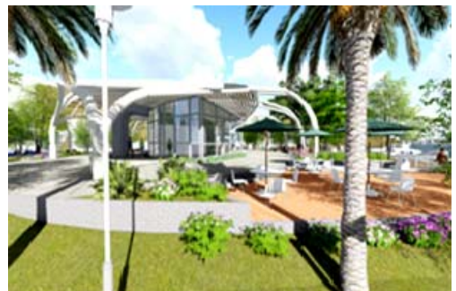
西子灣旅客服務中心新建及周邊環境整建(模擬圖)