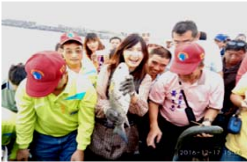
「來觀光吧!魅力高雄」-林園場活動