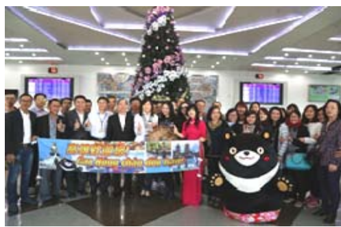
越捷航空「高雄-胡志明」首航迎賓