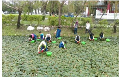
蓮池潭採菱角體驗活動