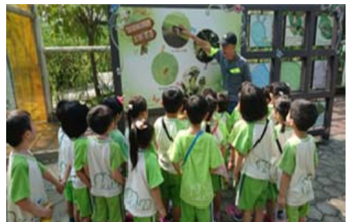
金獅湖蝴蝶園志工提供導覽解說服務