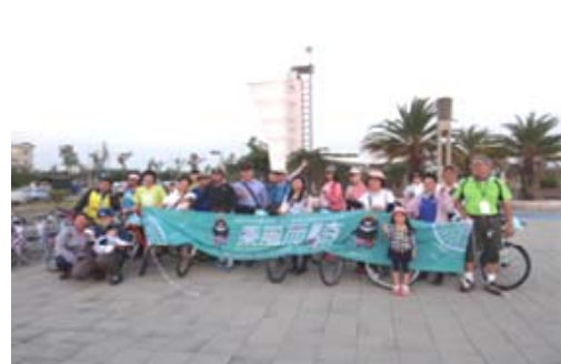
「乘風而騎」單車旅遊造訪茄萣