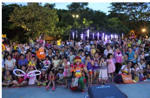
動物園暑期夜間表演活動