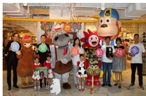
結合百貨業者合作推動動物認養及行銷活動