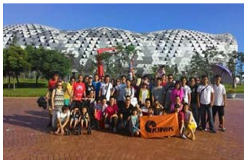
獎勵旅行業推廣高雄旅遊造訪新光碼頭