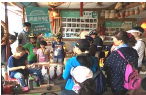
「乘風而騎」單車旅遊美濃紙傘體驗