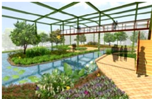
金獅湖風景區整建工程(模擬圖)