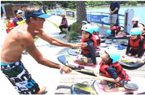
蓮池潭纜繩滑水營隊活動