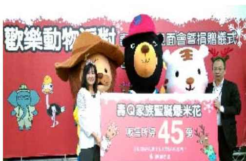
與企業合作辦理動物認養活動