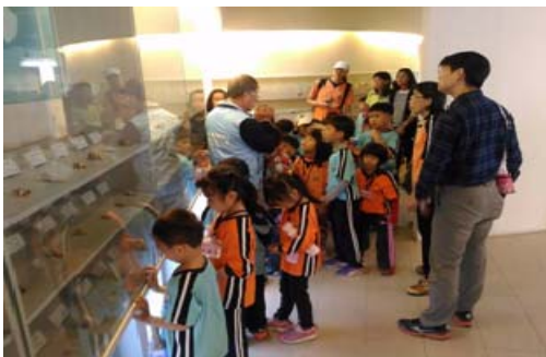
旗津貝殼館志工提供導覽解說服務