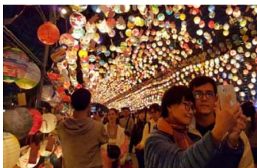
高雄燈會藝術節燈海

自 105 年 2 月公告至 12 月底，共有 25 家旅行社申請總金額計約 200 萬元，計帶來 67 團，400 輛遊覽車，約 12,341 人次到訪高雄旅遊景點，創造約 3,700 萬元觀光產值。