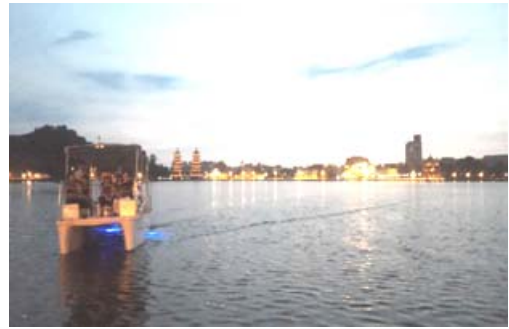
蓮池潭電動船低碳旅遊