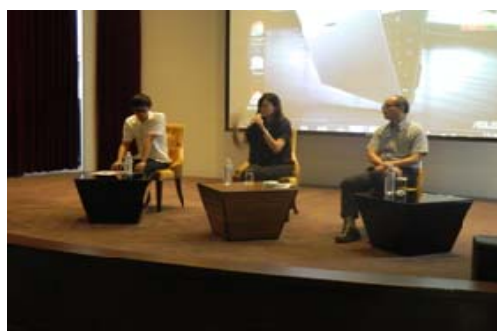
穆斯林友善餐旅認證輔導說明會