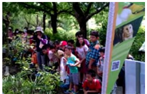
鳥松濕地志工提供導覽解說服務