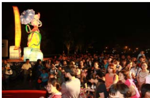
田寮奇幻月世界活動