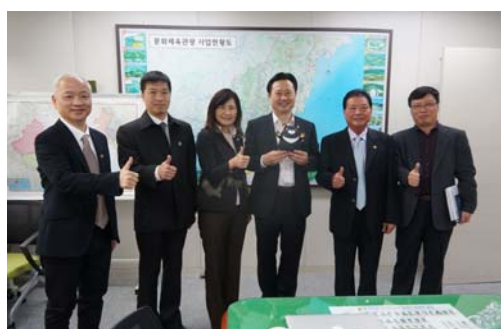
拜會釜山文化觀光局洽談觀光交流議題