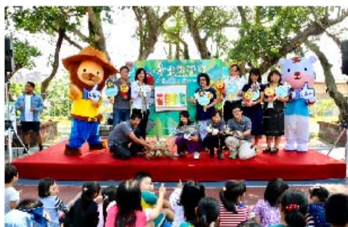
「看見動物-大樹下的 Zoo」保育推廣巡迴活動