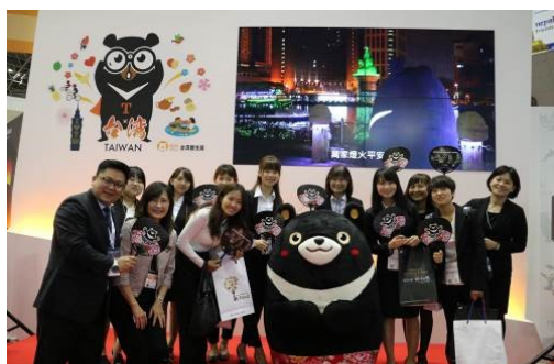
參加日本東京旅展及推廣活動