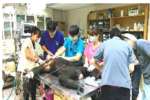
與國際專家進行動物醫療技術交流