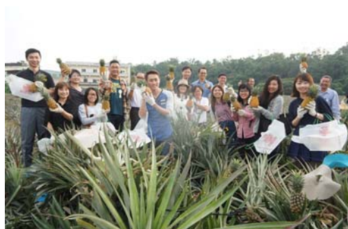
新加坡踩線團體體驗下田摘鳳梨