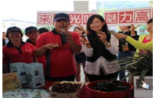
「來觀光吧!魅力高雄」-大寮場活動