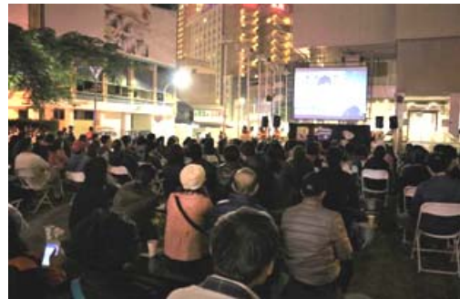
露天咖啡電影之夜吸引參加人潮