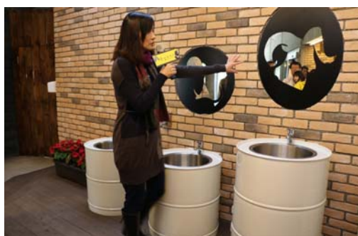
整建壽山動物園友善公廁

與內門紫竹寺管理委員會簽訂土地租賃契約，由其提供約 12 公頃土地作為初期開發為內門觀光休閒園區，以多元性休憩功能及生態保育推廣為目標導向，期打造成為觀光休閒新景點。目前委託專業廠商依規定進行水土保持、環境影響評估及開發許可等法定審議程序作業中，預定 106 年 6 月完成用地變更編定。