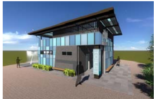
蓮池潭艇庫碼頭公廁整修(模擬圖)