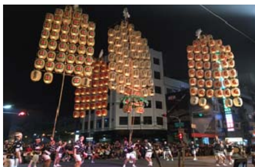
萬人提燈大遊行表演活動