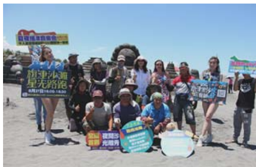
旗津黑沙玩藝節活動