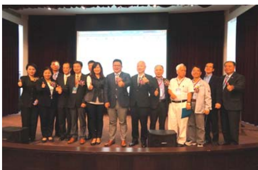
產官學界參與觀光發展座談會