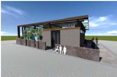
蓮池潭小龜山公廁整修(模擬圖)