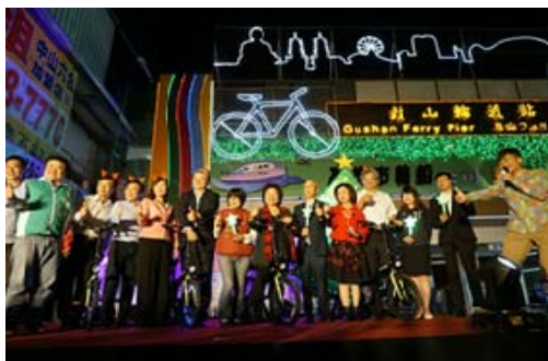
「聖誕燈節就在哈瑪星」活動