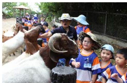
動物園志工導覽解說