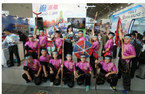
參加高雄市旅行公會冬季國際旅展