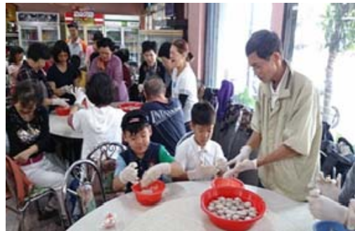
「四季逍遙遊」彌陀漁村體驗