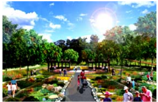
崗山之眼園區週邊環境整建(模擬圖)