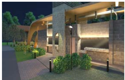
西子灣旅客服務中心新建及周邊環境工程(模擬圖)