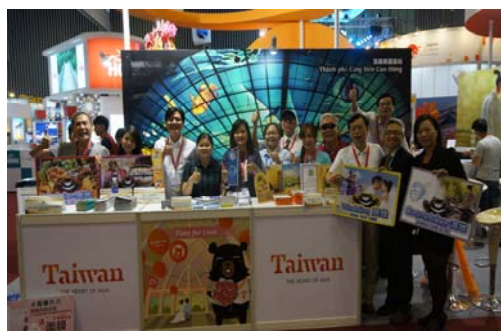
參加胡志明市國際旅展