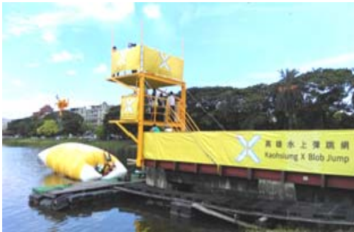
蓮池潭水上彈跳新型態活動