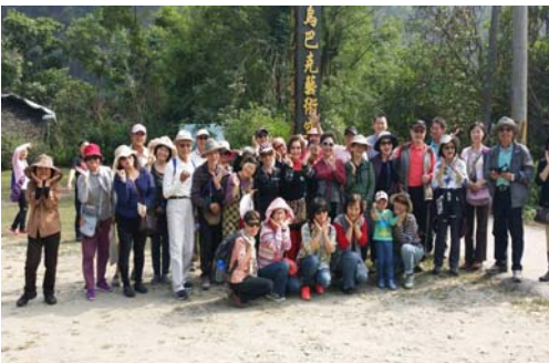
「四季逍遙遊」茂林賞蝶生態之旅