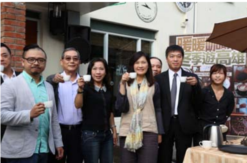
「暖暖咖啡香·冬季遊高雄」活動