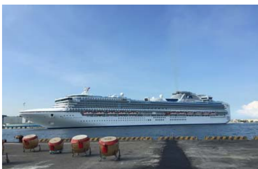
鑽石公主號郵輪進港