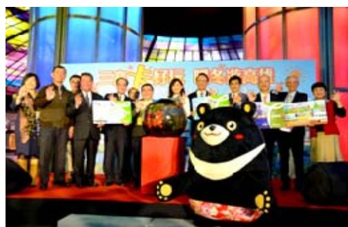
與高鐵、高捷合作好玩卡行銷