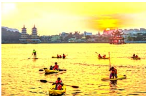
「揪愛水高雄」水域遊憩體驗活動