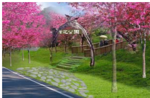
寶來賞花環境營造工程(模擬圖)