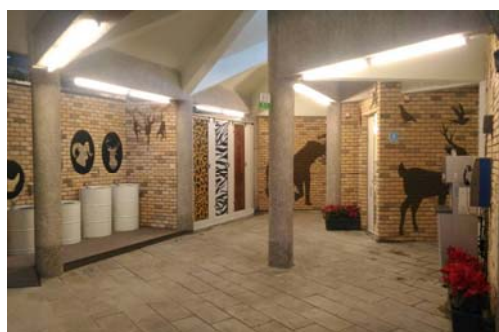
壽山動物園公廁全新風貌