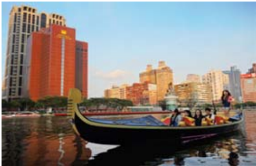
貢多拉船浪漫遊愛河