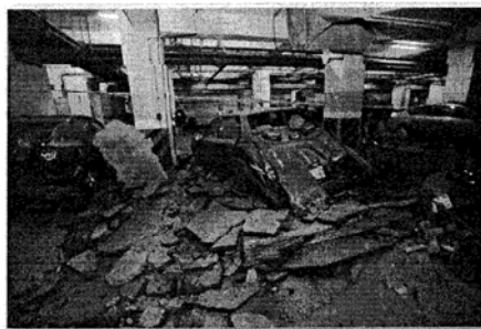
105/6/30 高雄市前鎮區獅甲國宅地下停車場，因管線沼氣濃度高引發爆炸，威力驚人。

大規模的慘痛災難也多次發生。1992 年墨西哥瓜達拉哈市發生下水道沼氣腐蝕地下油管，讓油料散佈下水道爆炸，造成 252 人死亡，五百多人受傷，1.5 萬人無家可歸；2 年前的高雄 81 氣爆，也正是李長榮丙烯管漏洩入下水道爆炸造成 32 死悲劇。一樁樁血淚教訓，高市府當局不得輕忽。