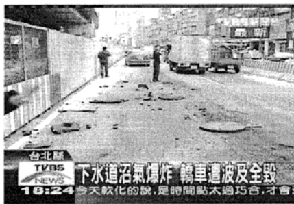
97/1/22 新北市板橋下水道沼氣濃度過高，人孔蓋炸飛。