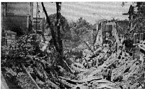
1992 年墨西哥瓜達拉哈市發生下水道沼氣腐蝕地下油管，讓油料散佈下水道爆炸，252 人死逾 500 傷 1.5 萬人無家可歸，與高雄 81 氣爆肇因相同。