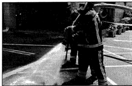
105/7/22 新興區開封路沼氣濃度瀕中毒標準

個月內，高雄接連發生四起下水道沼氣濃度攀升封路警戒的案件。其中 7 月 22 日發生在新興區開封路的案件，沼氣硫化氫濃度達 18ppm(濃度 100 萬分之 1)，已逼近會造成中毒的 20ppm 危險標準，且居民表示，狀況並非偶發「這已是住戶最近第三次聞到很濃的瓦斯味」。