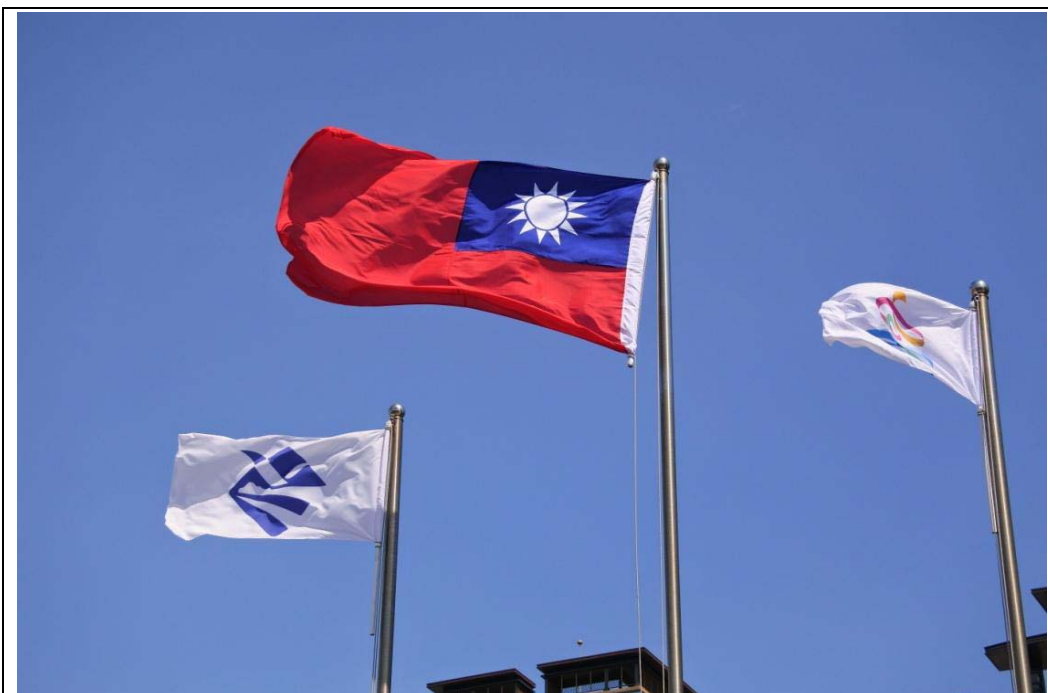
照片 11：本府四維行政中心升起高雄與釜山市旗，紀念姊妹市半世紀情誼。