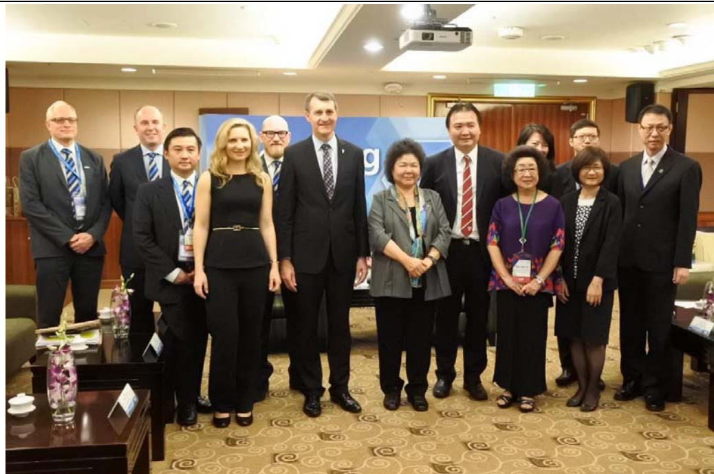
照片 6：澳洲布里斯本庫爾克市長拜會市長