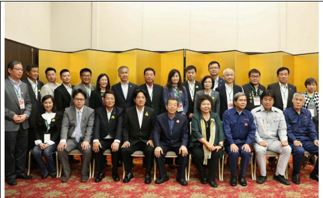
照片 9：高雄市與台南市共同出訪日本熊本縣，拜會熊本縣政府。