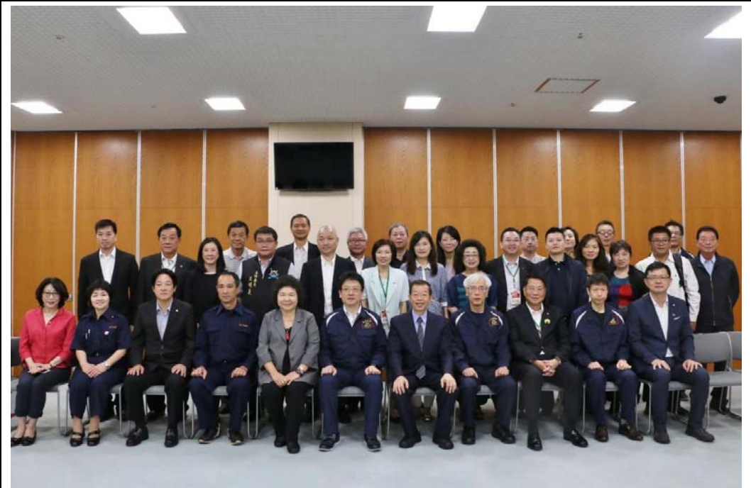
照片 10：高雄市及台南市共同出訪日本熊本市，拜會熊本市政府。