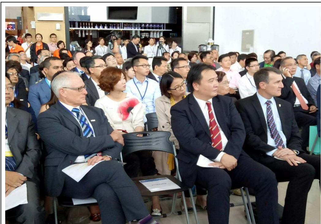
照片 7：布里斯本庫爾克市長團於港灣論壇期間舉辦商洽會