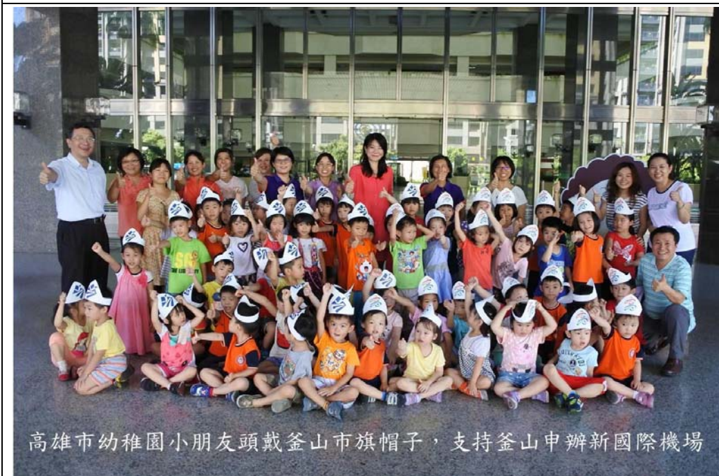
高雄市幼稚園小朋友頭戴釜山市旗帽子，支持釜山申辦新國際機場