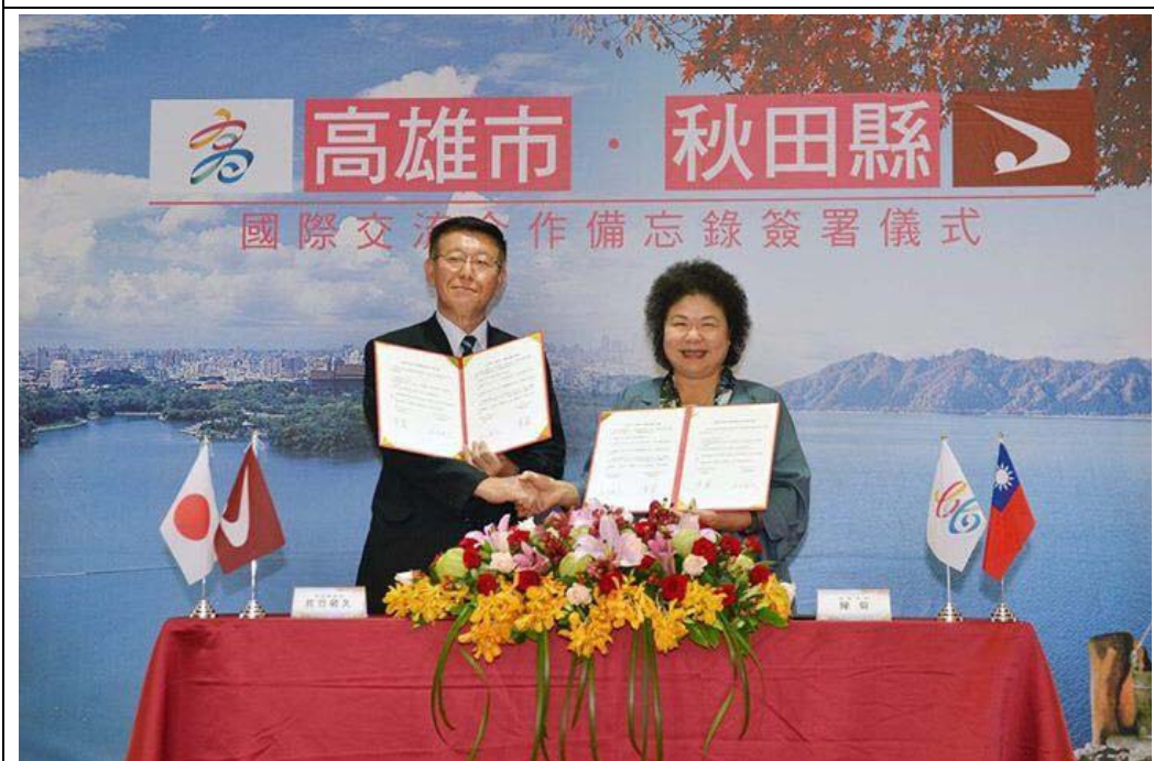
照片 18：高雄市與秋田縣國際交流合作備忘錄。