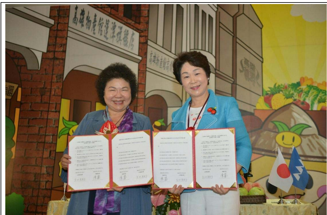
照片 17：高雄市與山形縣經濟及文化交流友好合作備忘錄簽署儀式。