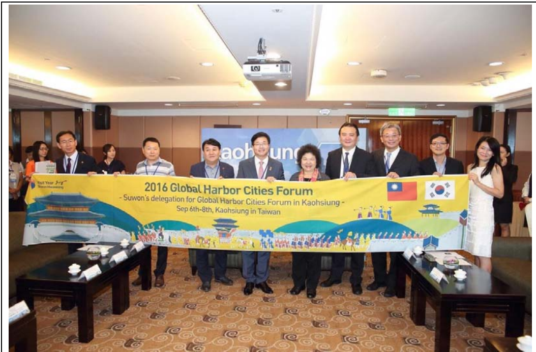
照片 1：韓國水原市廉泰英市長拜會市長