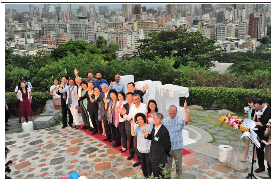
照片 15：高雄市與巴拿馬市締結姊妹市，並邀請 2016 全球港灣城市論壇各國貴賓一起見證。