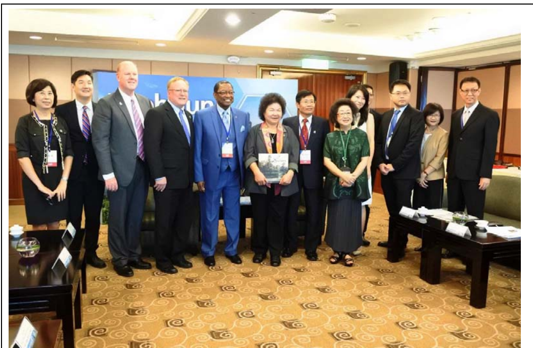
照片 3：美國巴頓魯治霍爾登市長拜會市長