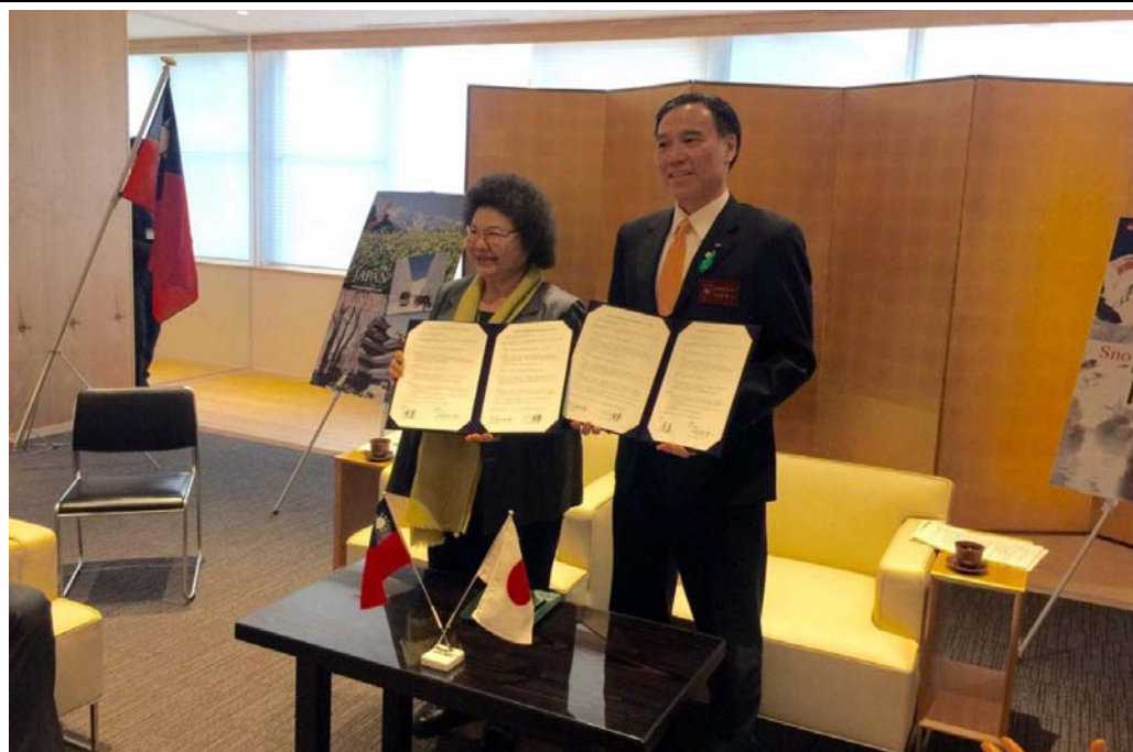
照片 8：高雄市與長野縣續簽觀光暨教育交流合作備忘錄。