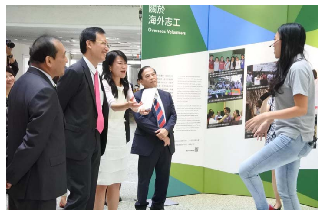
照片 21：「國際合作成果印象展—高雄場」，前海外志工分享教學經驗。