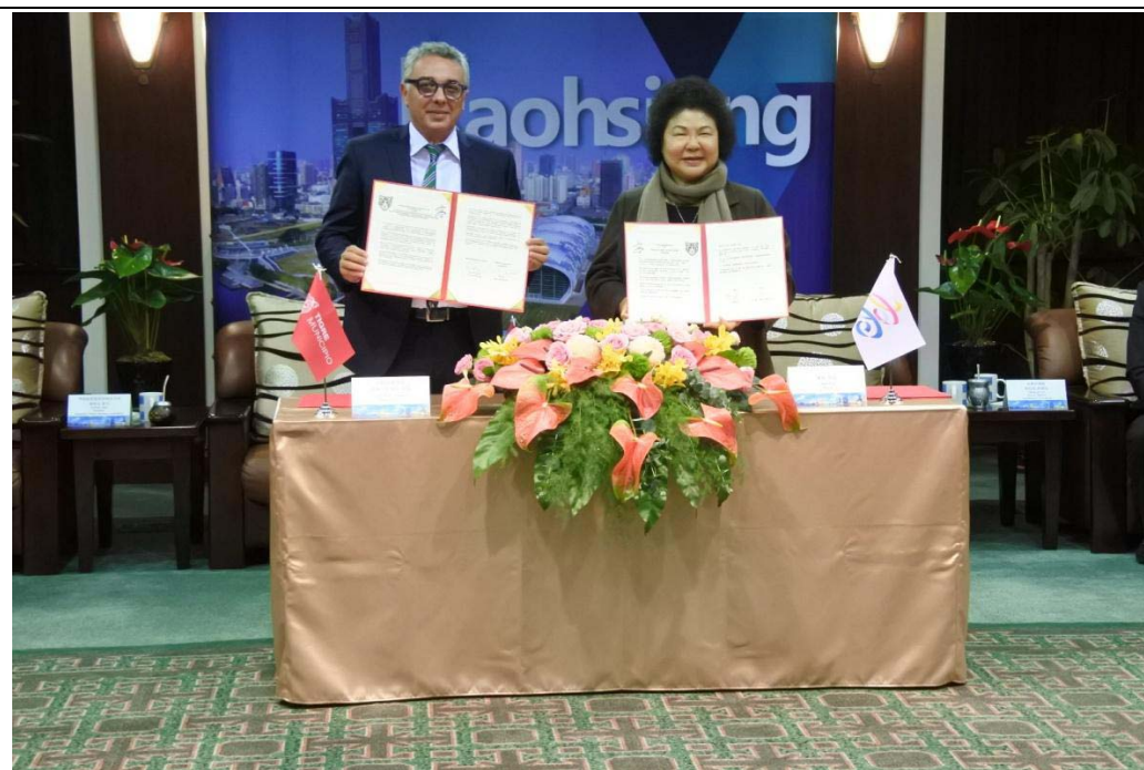
照片 16：高雄市與阿根廷老虎城簽署「友好交流備忘錄」。