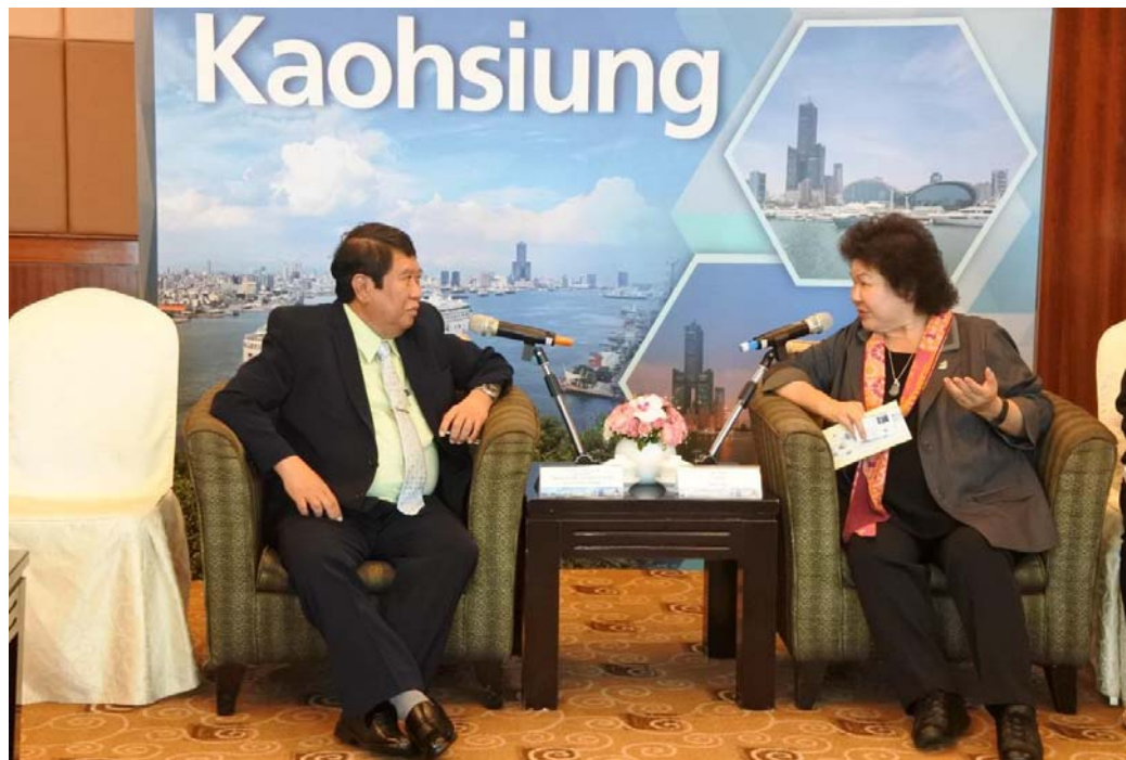
照片 2：緬甸仰光茂茂索市長拜會市長