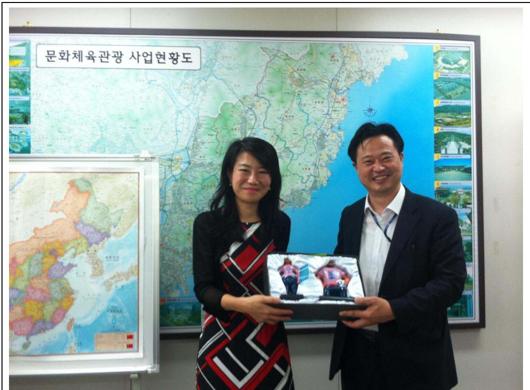
照片 13：本處出訪韓國釜山拜會釜山市政府文化旅遊局金炳圻局長。