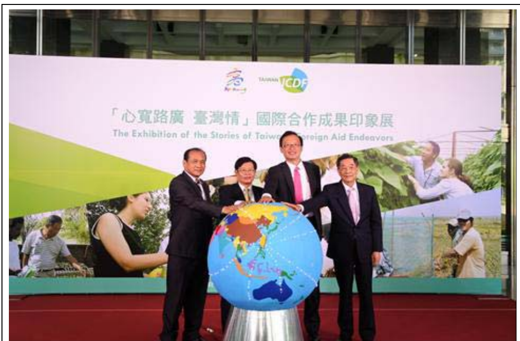
照片 19：「國際合作成果印象展—高雄場」，貴賓一同點亮象徵台灣向世界傳播愛心的地球儀。