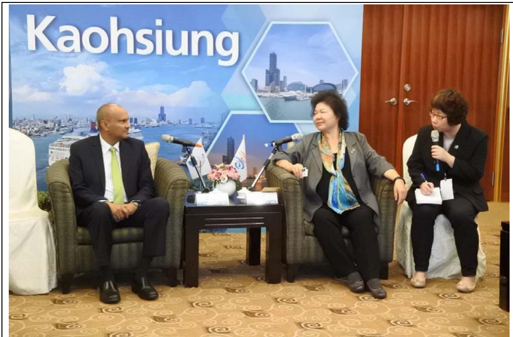
照片 5：馬爾地夫馬列謝哈布市長拜會市長