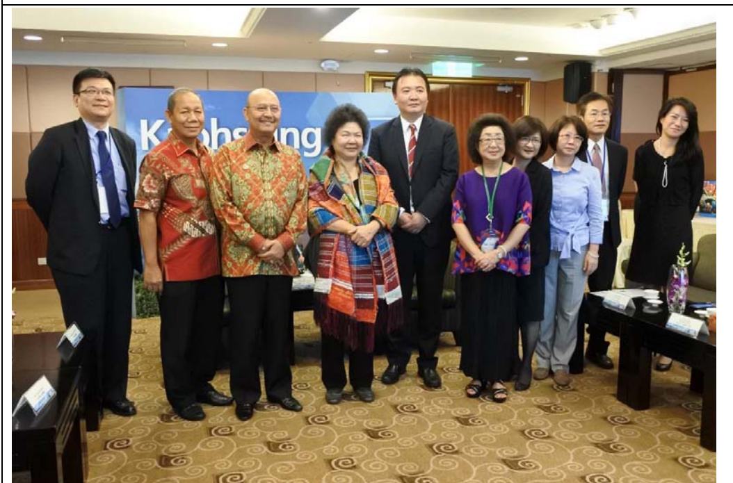
照片 4：印尼棉蘭市艾丁市長拜會市長