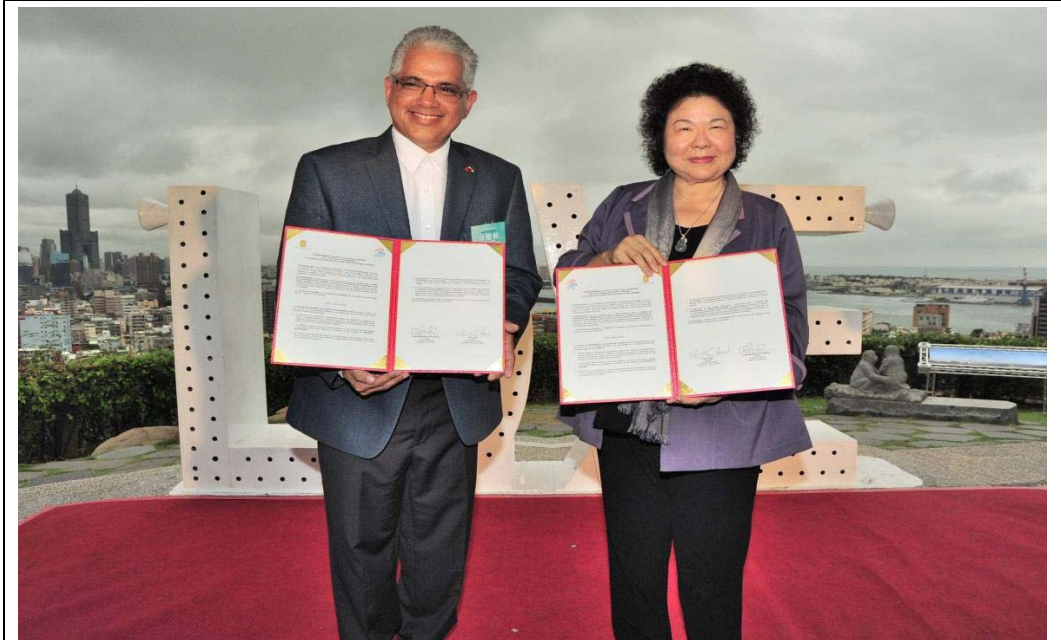
照片 14：高雄市與巴拿馬市共同簽署姊妹市締結協議書。