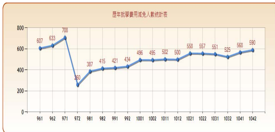
圖一：歷年就學費用減免人數統計表