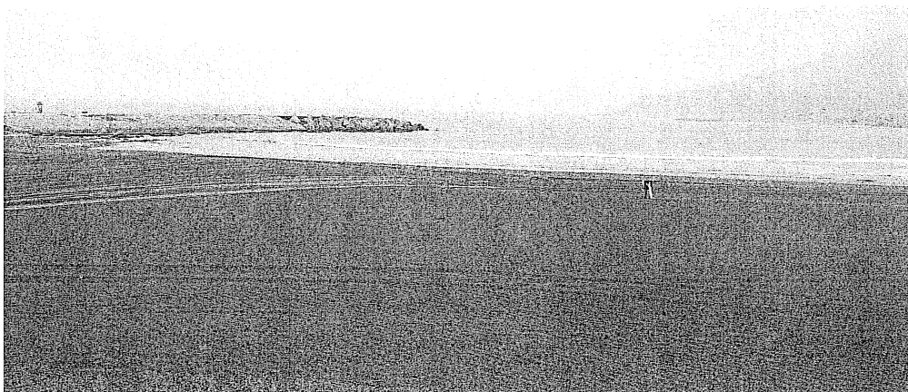
西子灣南岬頭現況照片