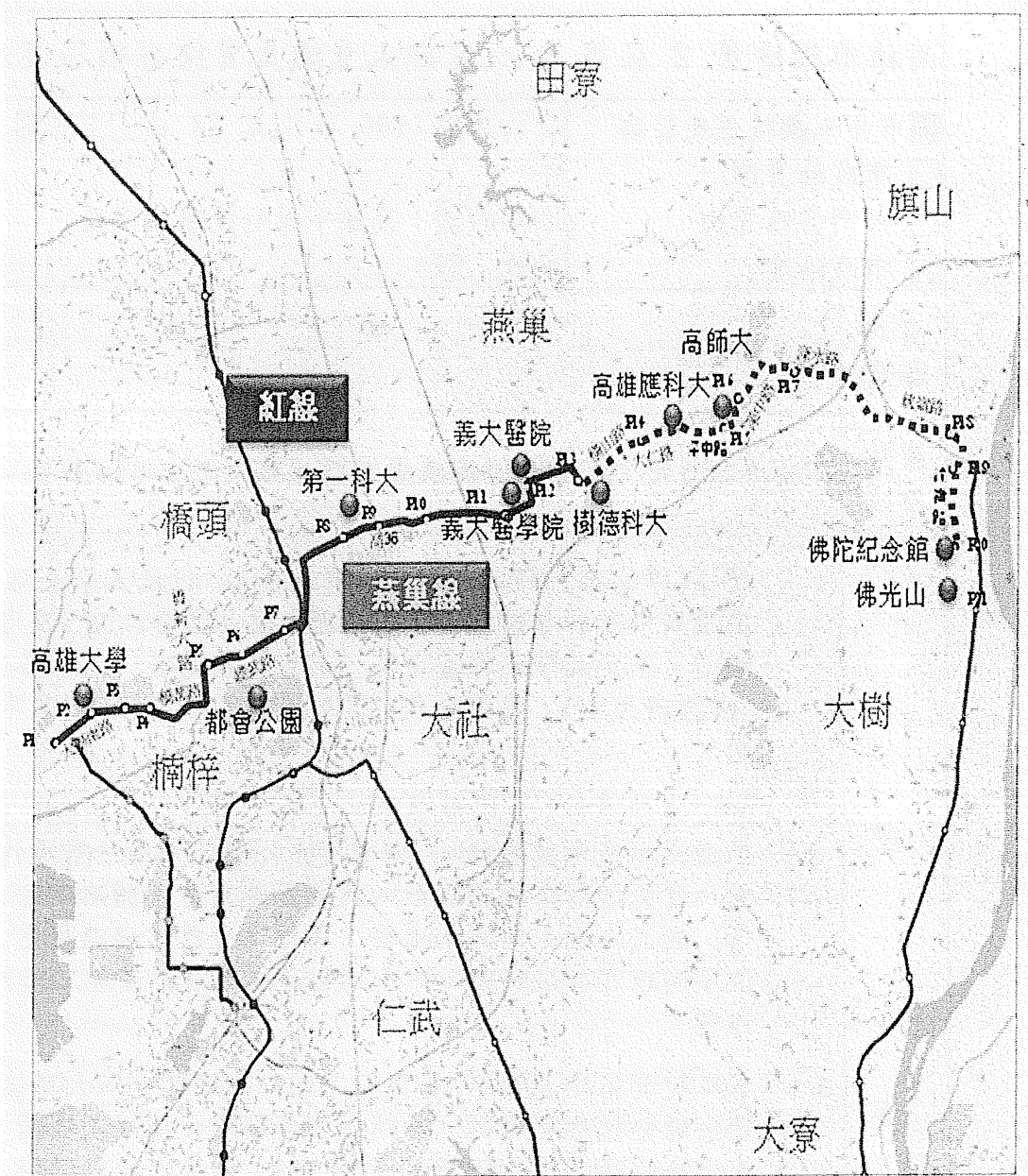
高雄捷運燕巢線規劃路線示意圖