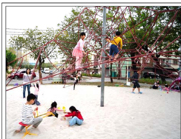
繩索攀爬架高達三米，倘若孩童不慎墜落，底下玩耍的小孩可能遭重壓受傷，建盟建議底層繩索加密，充當防護網。

台灣夏日除颱風外，暴雨也多，極易積水。積水退卻易匯聚異物，危及孩童安全，維護單位應訂颱風暴雨積水後封閉沙池的規定，及清潔維護措施。