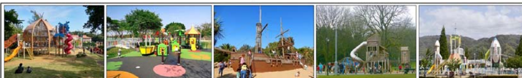
建盟從 4/26 起於 FB 進行「國際兒童夢幻公園大 PK」問卷調查，讓網民票選最喜歡的特色公園，由左至右分別是沖繩奧武山公園、高雄衛武營都會公園、倫敦海德公園、英國威爾斯戰爭紀念公園、大阪花園中央公園。

在建盟深入討論沙池問題前，先報告建盟於 4/26 傍晚起 2 天於 FB 所做的趣味問卷調查。