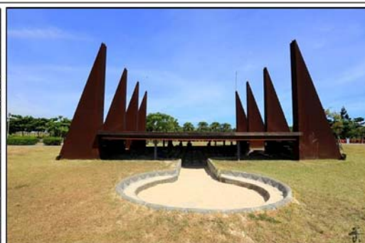
圖為八里十三行博物館，該遊樂場沙坑設有遮棚，能夠遮避陽光。南臺灣夏天如此酷熱，若公園沙坑加裝遮陽棚，不但可以防曬，亦能提高離峰時間使用率，但建議不超過 1/3，且定期置換沙土，讓遮陽區內的沙土能夠曝曬消毒。