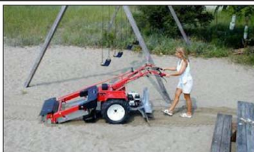
國外採用手推自動翻沙機具進行沙坑維護工作，能清除沙池內的異物，亦能將底部的沙翻動，達到曝曬陽光殺菌的效果。

事件(新聞連結)·所幸民眾發現得早·未釀意外。而國外採手推自動翻沙機具(連結 1、連結 2)·亦可考慮引進採用。而再緊密的防護·關鍵要項 衛教防護宣導不能少 。