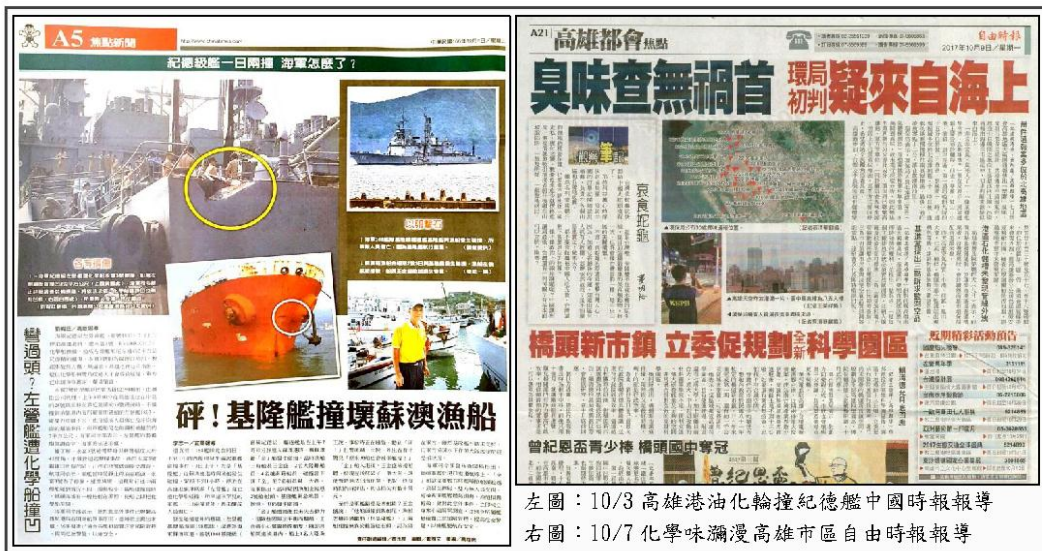
左圖：10/3 高雄港油化輪撞紀德艦中國時報報導 右圖：10/7 化學味瀰漫高雄市區自由時報報導