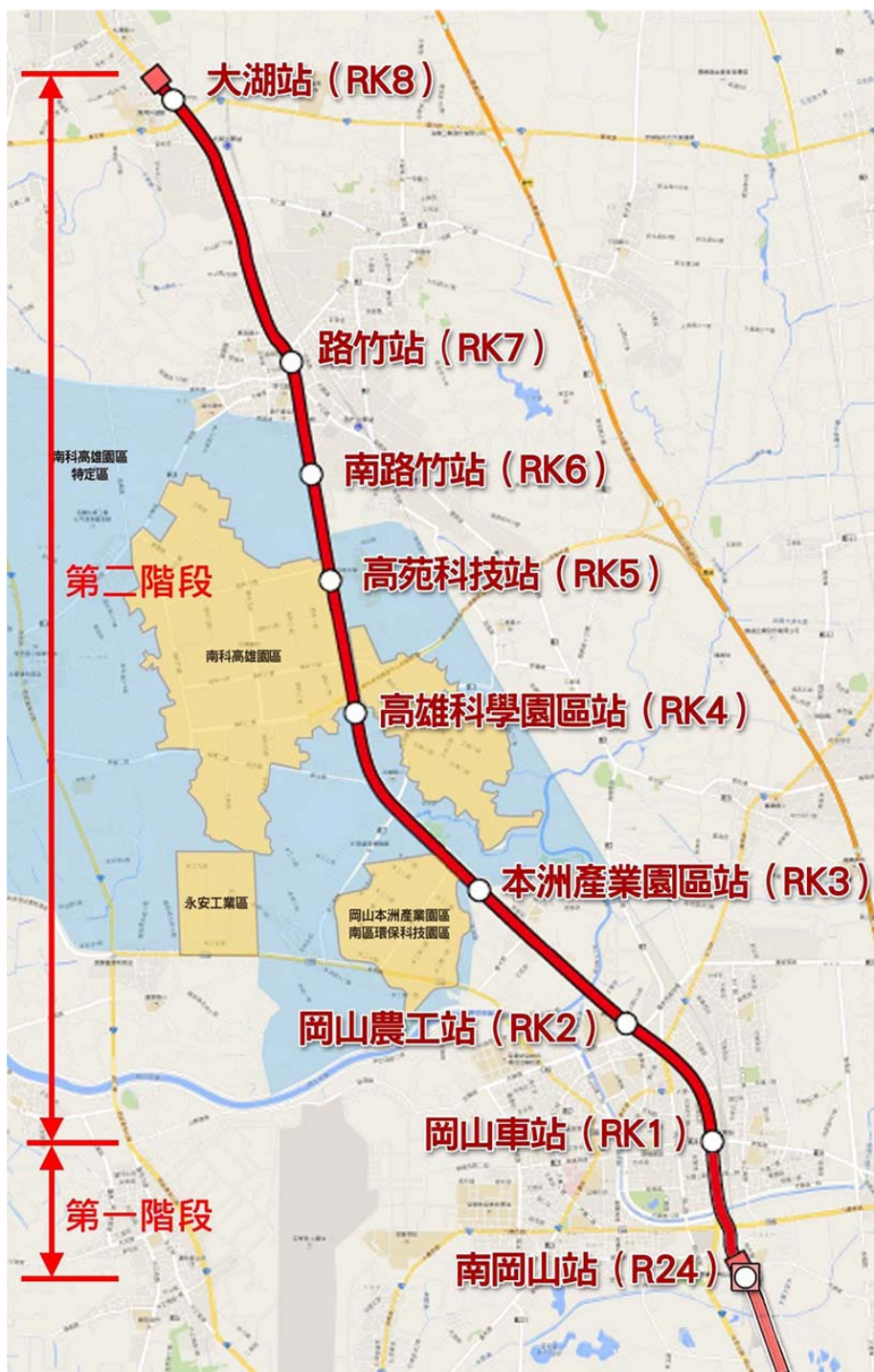
高雄捷運岡山路竹延伸線建議路線圖