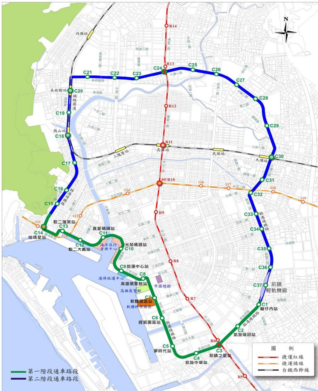
高雄環狀輕軌捷運建設路網示意圖