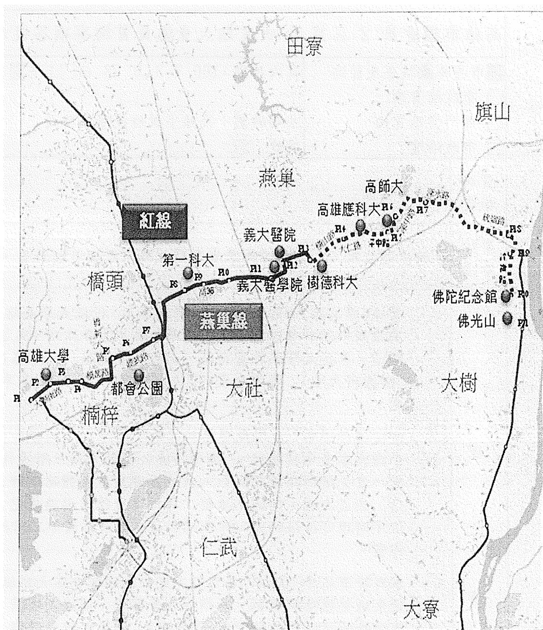
高雄捷運燕巢線規劃路線示意圖