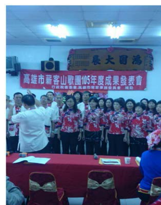
圖 27、輔導社團開辦客家歌謠培訓課程

105年9月至106年2月計輔導41個客家社團，開辦客家歌謠、舞蹈及技藝班等培訓課程與客家文化活動，參與鄉親計3,124人；社區公演逾4場次，參與鄉親及民眾達980人次。另輔導4個社團辦理「2016全國高雄美濃客家傳承盃民俗體育錦標賽」、「返鄉·發現客家-2016六堆青年論壇」、「金雞迎春，美藝文風」藝展及「滿年福春、秋報夜祭」等活動，參與鄉親及民眾達4,750人次，公私齊力推廣客家事務。（如圖27）