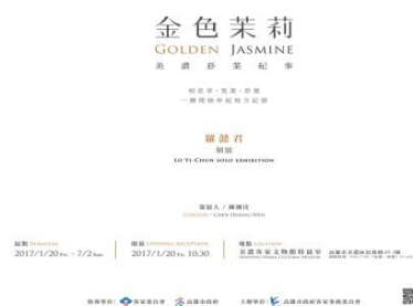
圖 35、金色茉莉—美濃菸業紀事展海報