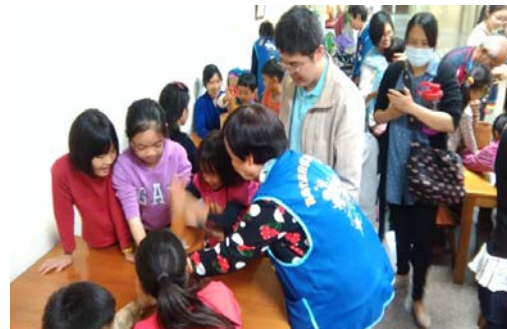
圖 32、親子體驗搗麻糬