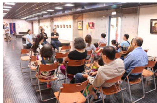
圖 33、「域外之境」藝術家解說作品