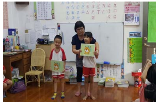
圖 2、全客語沉浸教學