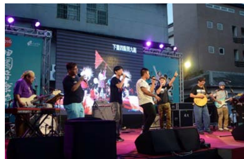
圖 20、青少年客語創作專輯發表