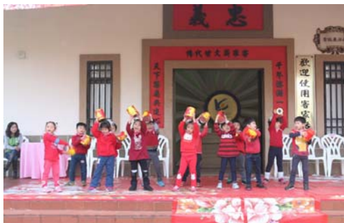
圖 21、幼兒園新春祈福演出

儀，在傳統客家八音的樂曲中，由市長率客家鄉親以三獻禮儀式，向土地伯公祈求新的一年風調雨順，祭祀完成後並發放開運小紅包及客家飯食給現場民衆，計約 700 人參加。（如圖 21、圖 22）