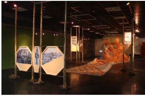
圖 36、金色茉莉-美濃菸葉紀事展