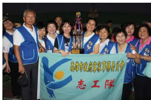
圖 11、榮獲「最佳青春獎」