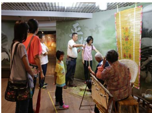
圖 14、美濃百工百業之師-竹門簾