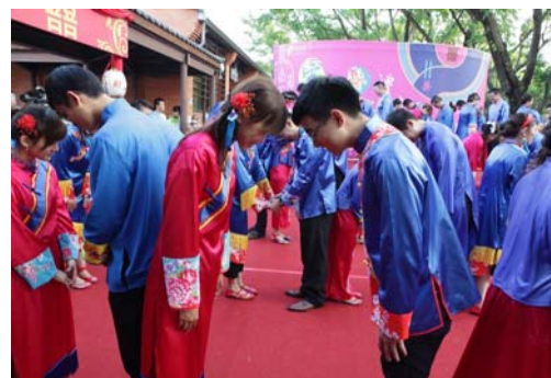
圖 17、三拜禮-夫妻對拜