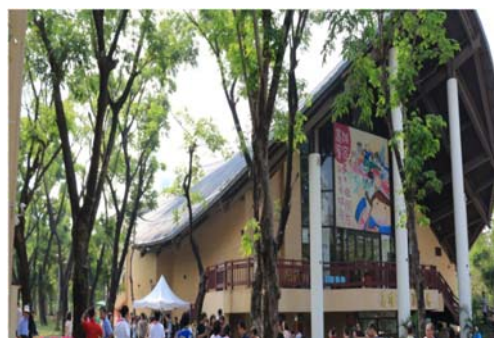
圖 28、高雄市新客家文化園區

1. 新客家文化園區是南部首座都會型客家文化園區，主體建築演藝廳、圓樓餐廳及2棟展售中心出租民間廠商營運，引進民間資源及多元創新的經營理念，透過客家文化展演，搭配客家特色建築、美食及文創產品，帶動觀光產業，繁榮地方經濟。（如圖28）