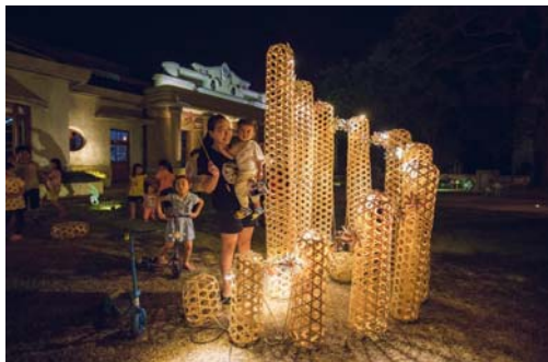
圖 42、駐村藝術計畫藝術家作品

為重現老街風采，辦理「照亮右堆-點亮美濃永安老街」駐村藝術計畫，邀請 2 位青年藝術家於 105 年 8 月至 10 月駐村，運用不同媒材創作激發原有場域的記憶及反思，將文創中心及周遭環境做為創作展覽空間，同時每個月推出竹編風車、氫版印刷…等藝術工作坊，105 年 11 月 19 日舉辦駐村創作展開幕儀式後，展示至 106 年 2 月 5 日，期望藉由藝術與創意為媒介引動客庄鄰里更多能量，共吸引 2 萬 8,000 人次參與欣賞。(如圖 42、圖 43)