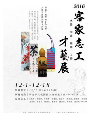
圖 30、客家志工才藝展

於 105 年 12 月 1 日至 12 月 18 日展出客家志工書法、水墨、工藝、服飾及油畫共 70 件作品，展現志工多元才藝，吸引 1,563 人次參觀。（如圖 30）