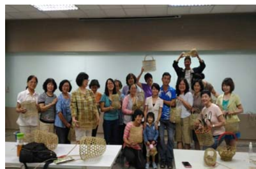
圖 5、客家學苑-客家創意竹編