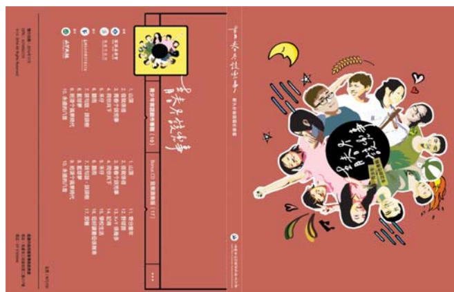
圖 12、青少年客語創作專輯《青春个該兜事》