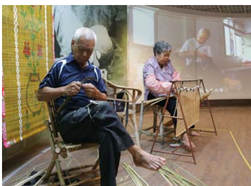
圖 15、竹門簾老師傅現場展演