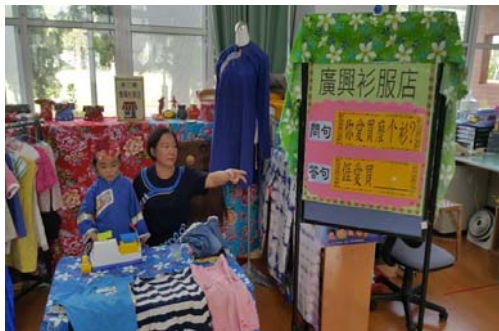
圖 1、全客語學習環境