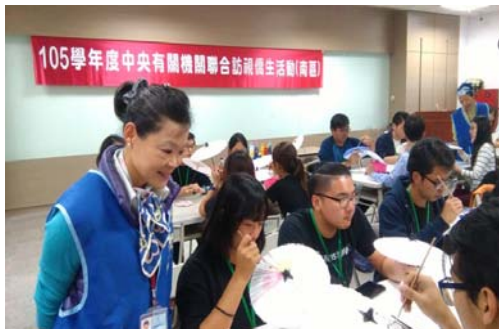
圖 31、南區僑生體驗紙傘彩繪