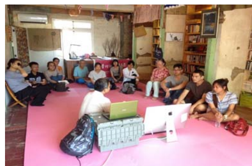
圖 7、鳳山客家傳習教室-客家文化講座