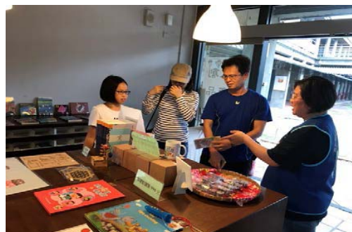
圖 9、美濃客家文物館志工介紹文創產品