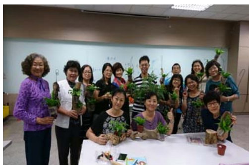
圖 4、客家學苑-家庭盆栽綠手指

105 年 9 月至 11 月於新客家文化園區文物館及鳳山區中正國小客家傳習教室分別開辦「四縣腔中高級客語」、「海陸腔中高級客語」、「客家諺語及歇後語」、「輕鬆說客語」、「就是愛唱客家歌」、「客家創意竹編」、「客家古禮」、「基礎電腦」等 19 門客語學習及文化技藝培訓班，計 2,005 人次參與，透過不同主題，讓民眾以寓教於樂的方式學習客語，展現客家多元豐富的文化藝術，並鼓勵語言學習班學員報名參加客語認證。（如圖 4~圖 7）