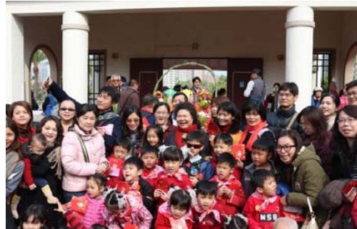
圖 22、市長發開運紅包給小朋友